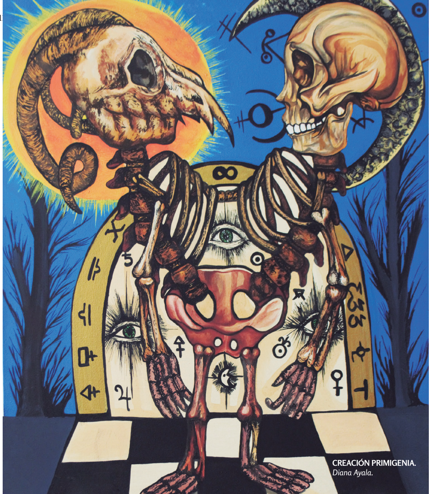
CREACIÓN PRIMIGENIA. Diana Ayala.