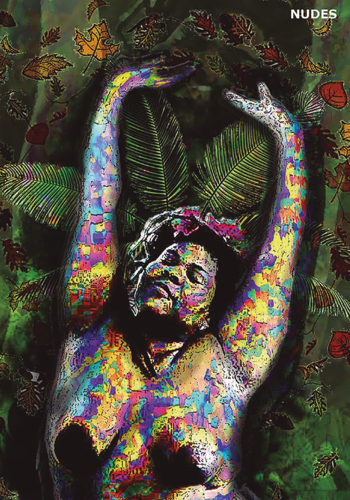
Serie Nudes