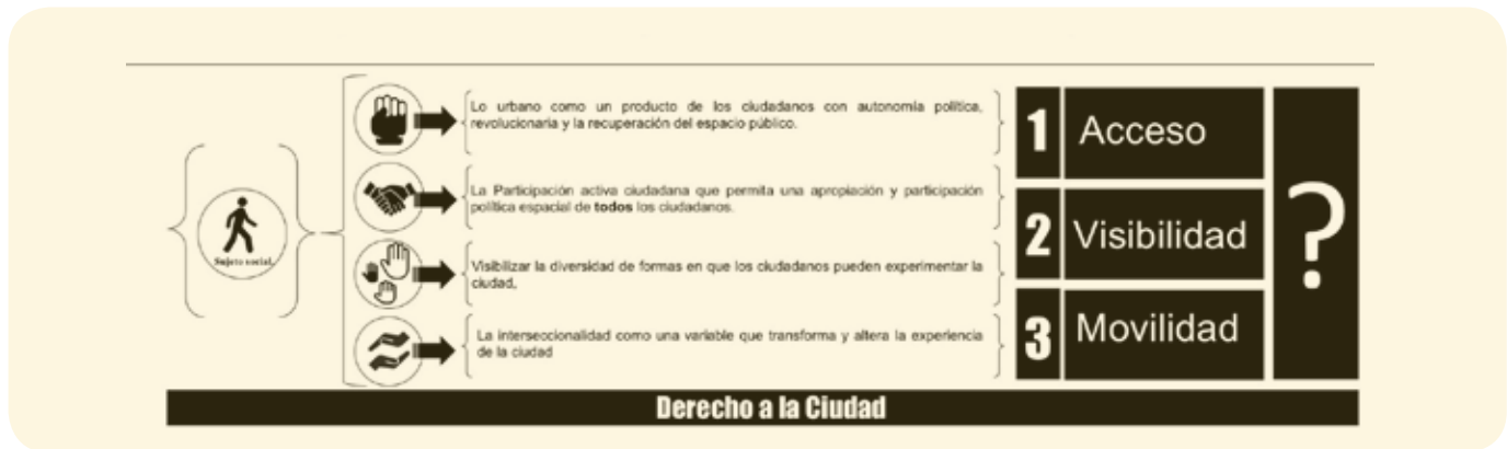
Gráfico 4. Derecho a la ciudad

que permia la inclusión de la ciudadanía en los cambios urbanos, que no pretenda erradicar los conflictos sino interpelarlos (Harvey, 2013).