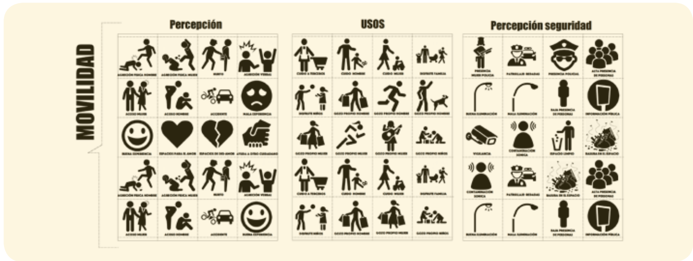
Gráfico 6. Variable de visibilidad.

Ahora bien, para esta investigación se presenta dos sujetos de estudio que evidencian la relación entre la geografía y el género.