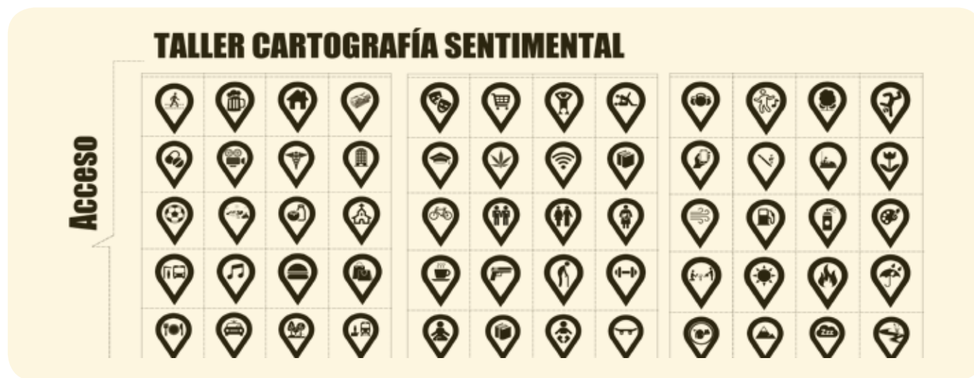
Gráfico 5. Variables de acceso. Elaboración propia.