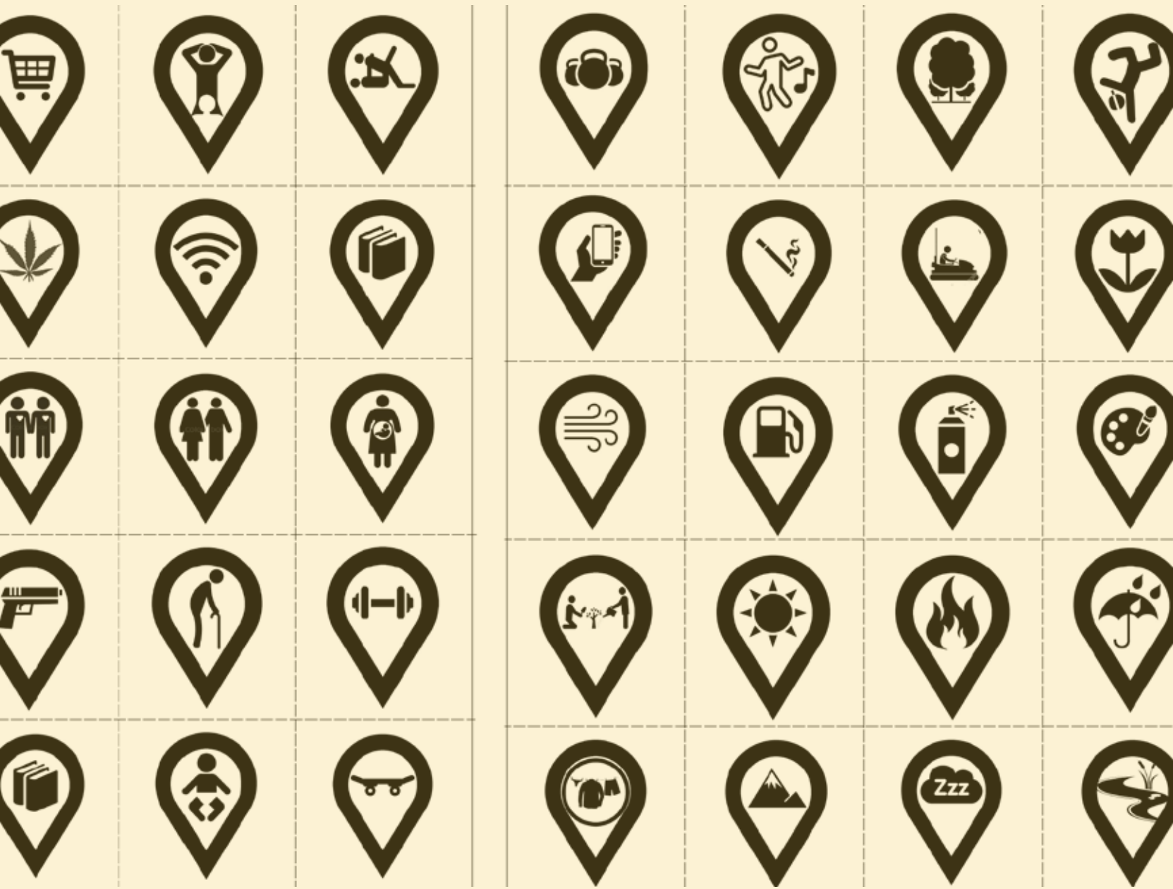
Variables de acceso (fragmento del gráfico 5). Elaboración propia.