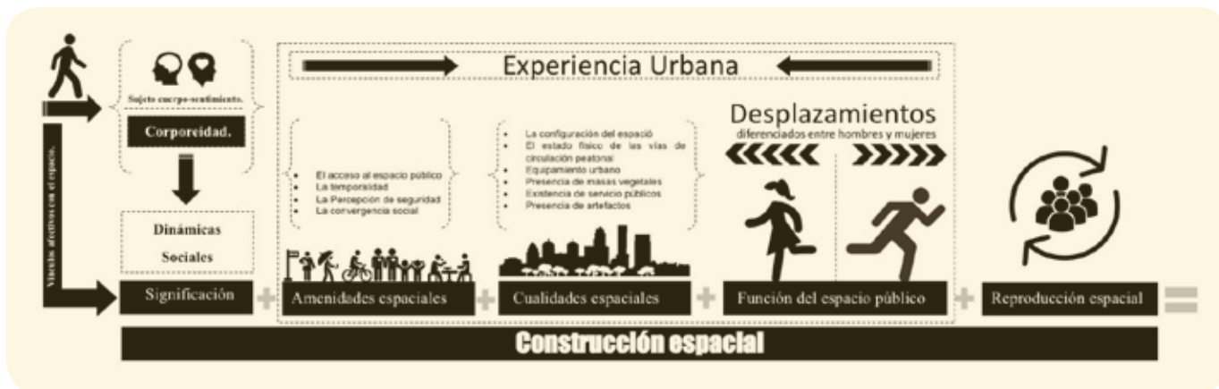
Grafico 2. La construcción espacial