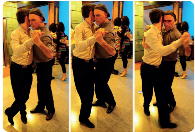
Figura 2. Fotos de bailarinxs

La danza de tango, como señala Camacho (2000), tiene una matriz de género en que se refuerza una cierta masculinidad asociada al liderazgo y el poder (Camacho, 2000). Davis (2015) considera que la danza de tango tiene una hiperheterosexualización de lo masculino y lo femenino, en el que existen desigualdades de género, una sumisión femenina y una masculinidad machista.