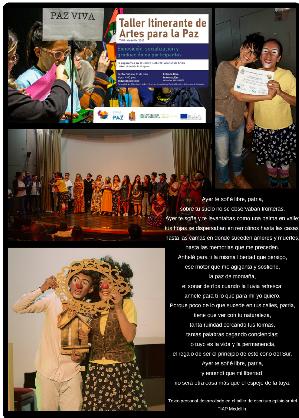
Figura 7. Fotorrelato socialización . Pieza de difusión TIAP. Fotografías tomadas por David Romero, Julieta Bohórquez y Walter Quinchía (2022)