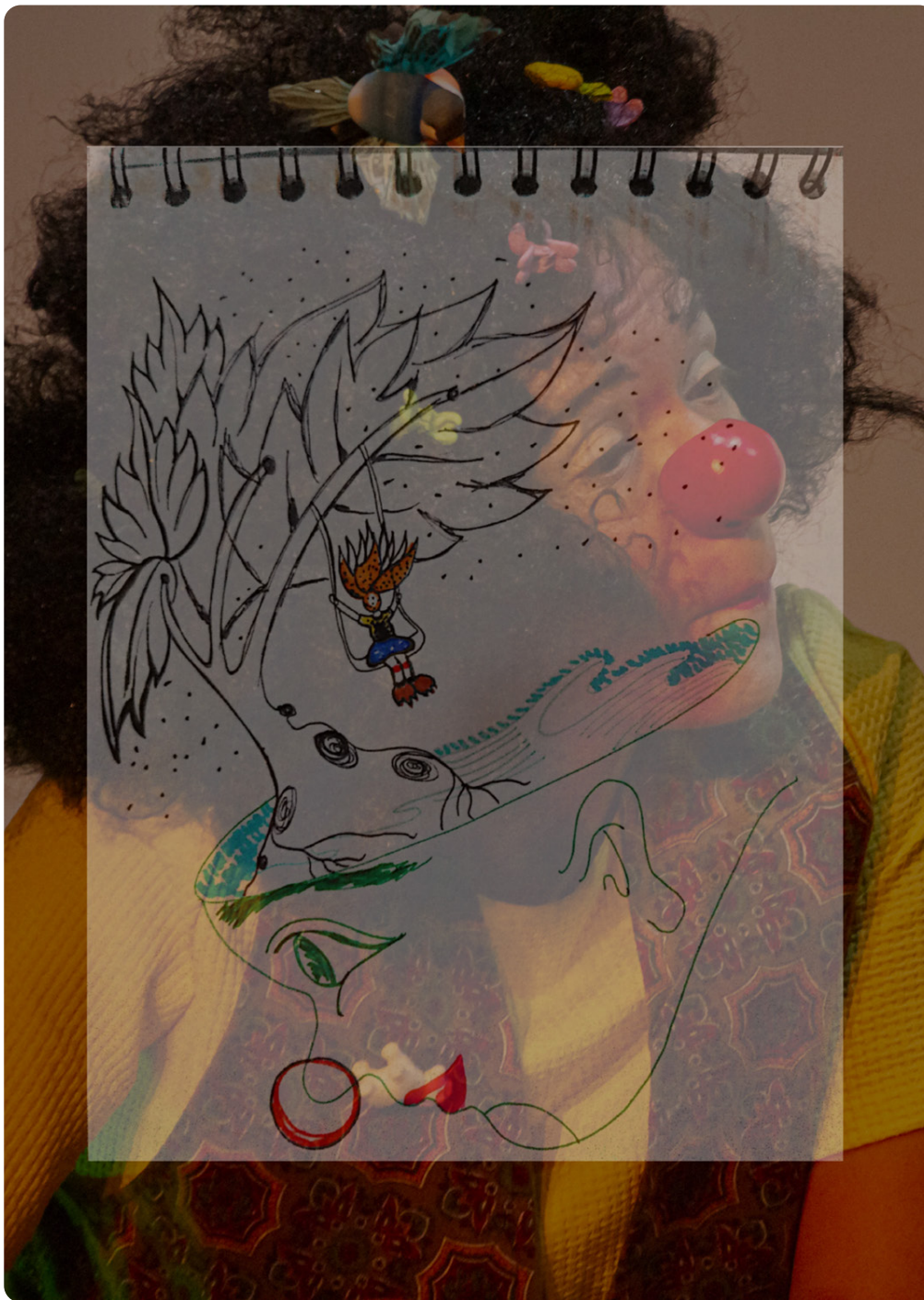
Figura 9. Fotografía final . Superposición de imagen de bitácora personal Edna Lagos y fotografía tomada por David Romero y Julieta Bohórquez (2022).