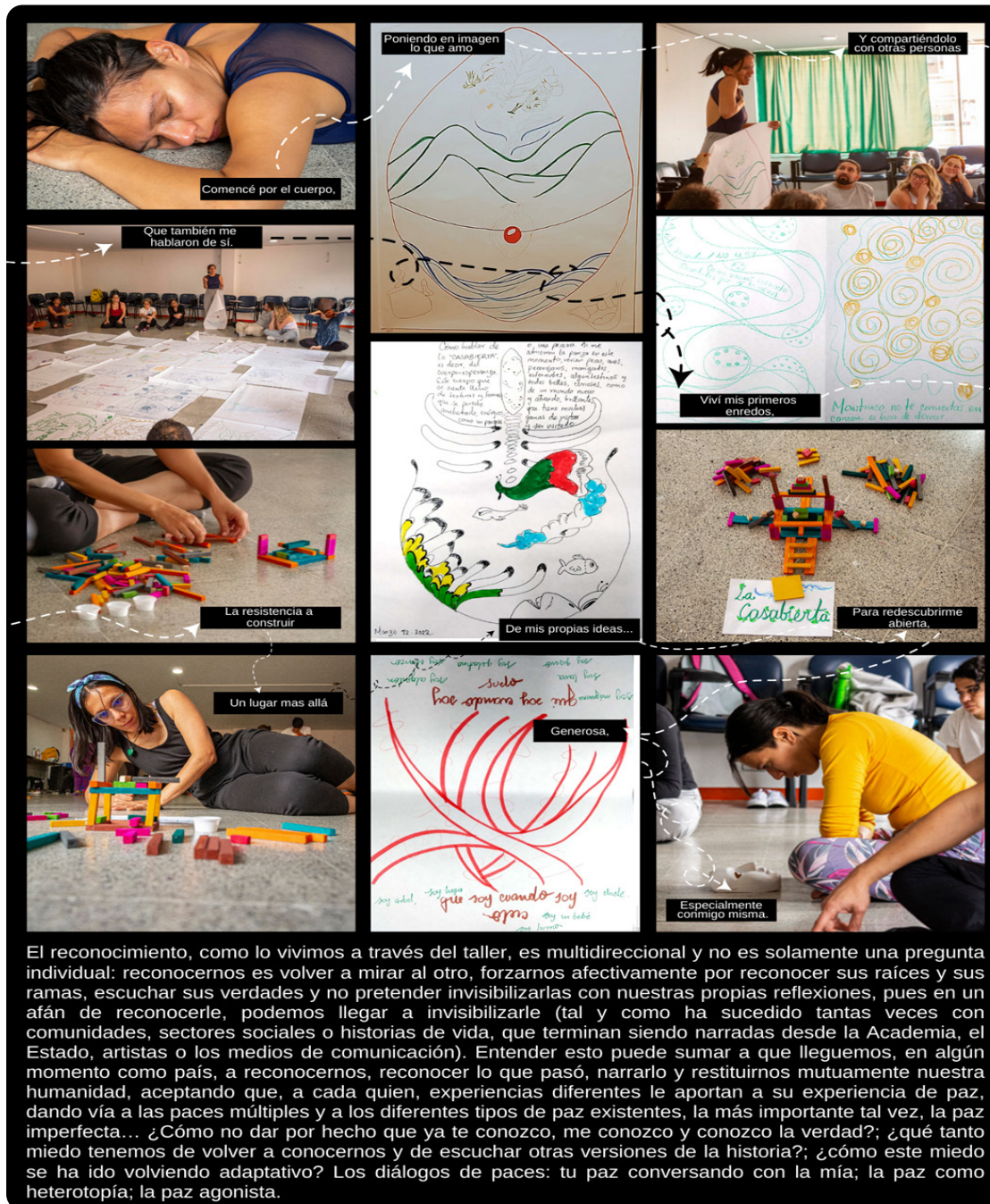
Figura 2. Fotorrelato del Taller 2.