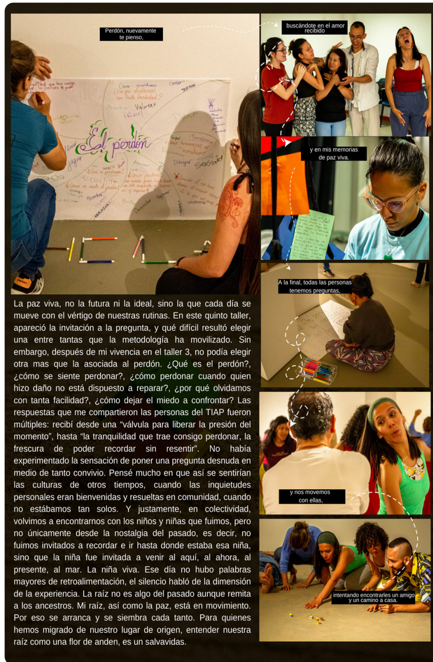
Figura 5. Fotorrelato Taller 5. Fotografías tomadas por David Romero y Julieta Bohórquez (2022)