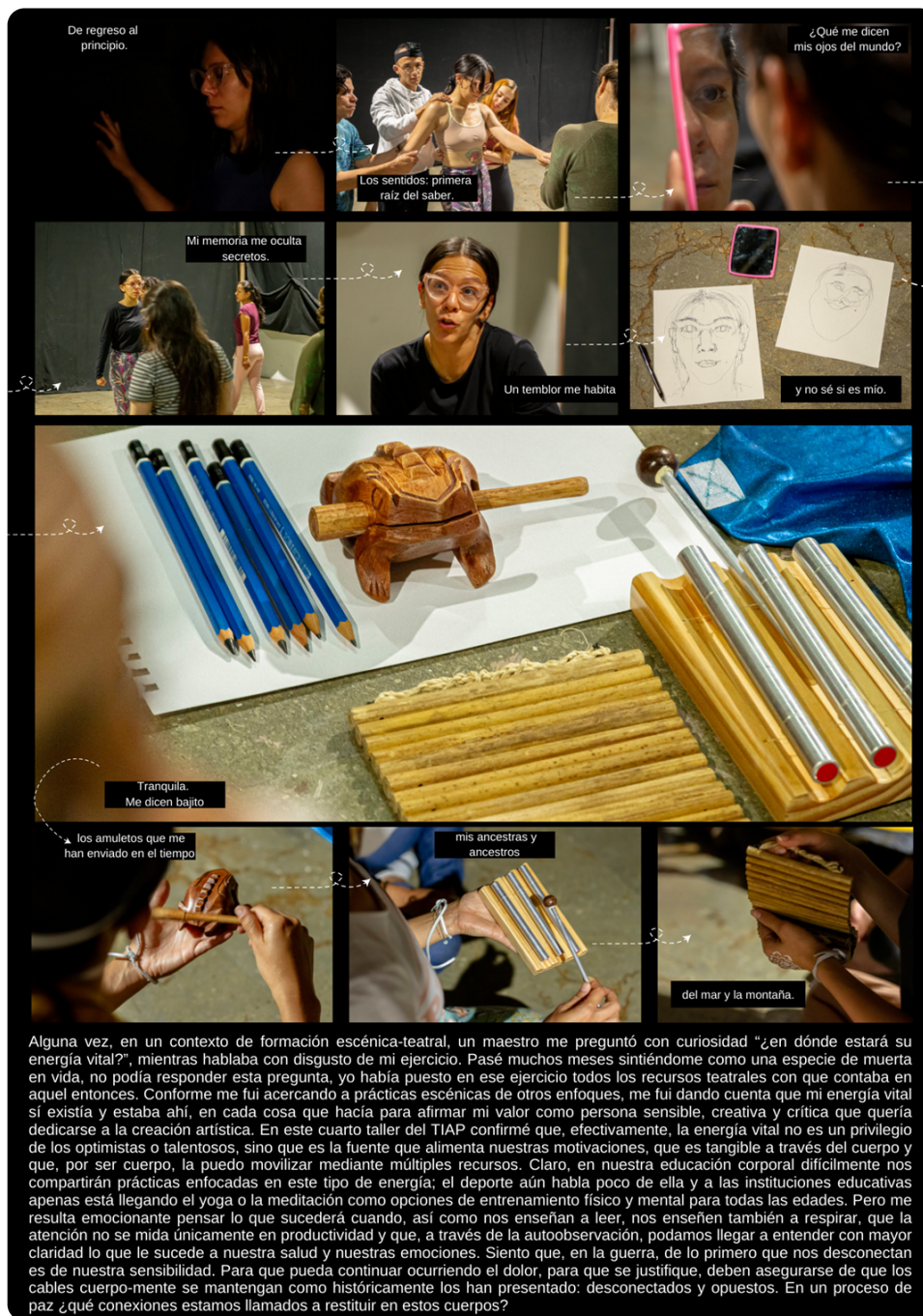
Figura 4. Fotorrelato Taller 4.