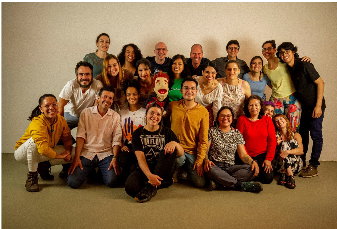
Figura 10. Participantes del TIAP Medellín. Docente de escritura epistolar, equipo de registro audiovisual e investigadores Transmigrarts.