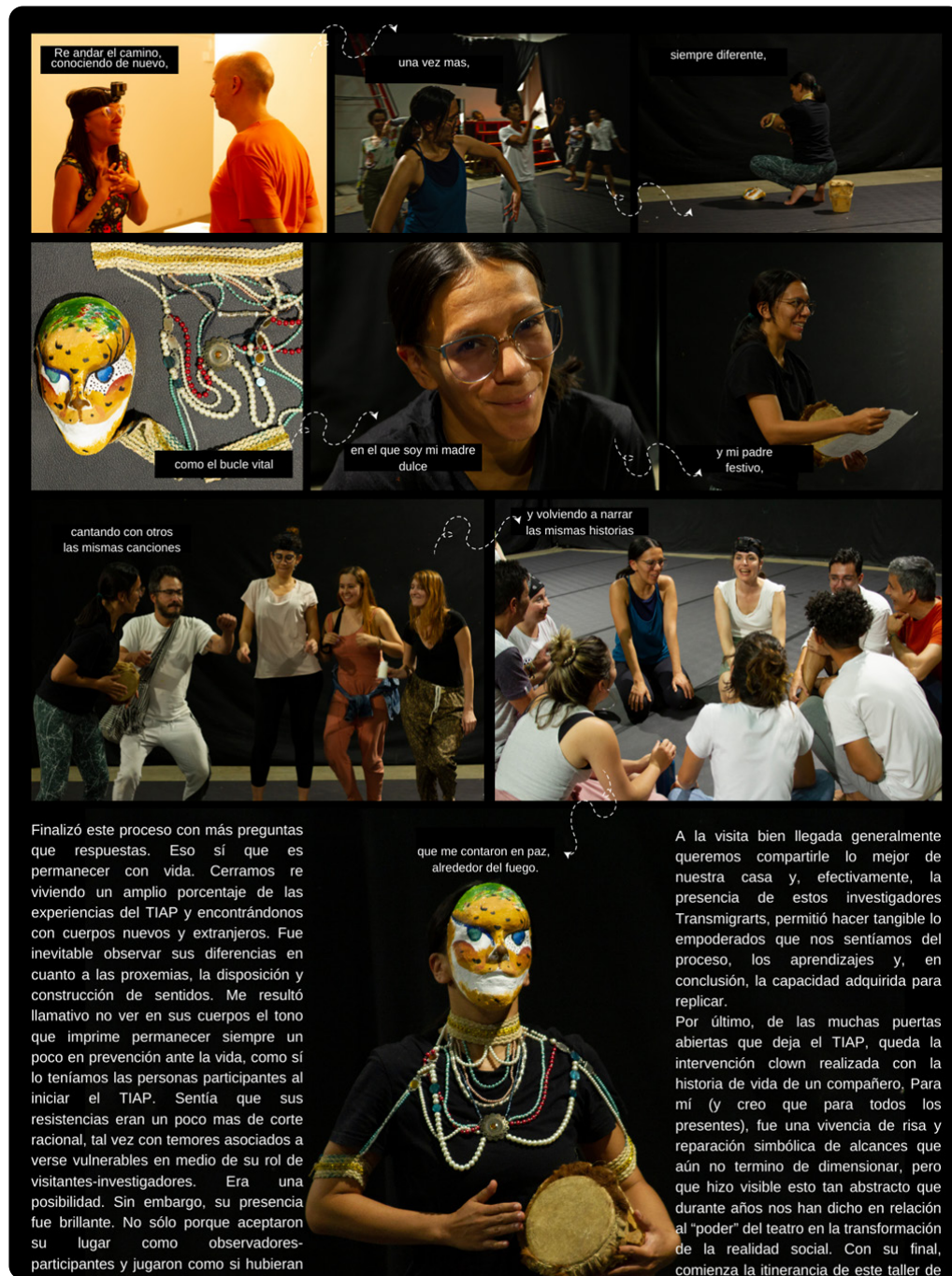
Figura 6. Fotorrelato Taller 6. Fotografías tomadas por David Romero y Julieta Bohórquez (2022)