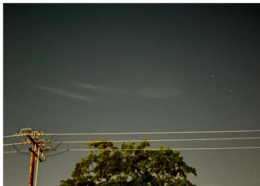
Figura 4 : La Osa Menor.

La relación epistémica estudiantil con el saber astronómico, mediada por la observación del eclipse, se caracteriza por su aprendizaje activo y autónomo anterior al eclipse en diversos espacios académicos relacionados con la Astronomía. Este conocimiento se ve influenciado por el contexto académico y las experiencias prácticas, como la observación del eclipse y constelaciones no visibles en sus latitudes de origen. El estudiante mencionó que identificó por primera vez la constelación de la Osa Menor, destacando a Polaris en su cola, y acompañó su comentario con una foto.