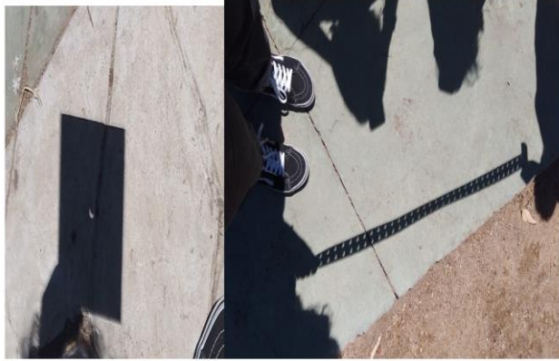
Figura 2 : Observación indirecta desde Guadalajara, México del eclipse 8 de abril de 2024.

Para el caso de la observación desde Dallas, la misma se realizó desde la Plaza de los Fundadores y contaba con un telescopio Celestron Refractor 90t. Durante la observación, el estudiante fue entrevistado por el Dallas Morning News , que es un periódico local. Las siguientes fotografías tomadas por el estudiante, evidencian parte del eclipse y además características como manchas solares. El estudiante señala: “se puede identificar la corona solar, la actividad solar y las perlas de baileys ”.