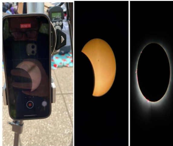
Figura 3: Observación directa desde Dallas del eclipse 8 de abril de 2024 empleando el telescopio Celestron Refractor 90t.

Para el caso de la observación desde Dallas, la misma se realizó desde la Plaza de los Fundadores y contaba con un telescopio Celestron Refractor 90t. Durante la observación, el estudiante fue entrevistado por el Dallas Morning News , que es un periódico local. Las siguientes fotografías tomadas por el estudiante, evidencian parte del eclipse y además características como manchas solares. El estudiante señala: “se puede identificar la corona solar, la actividad solar y las perlas de baileys ”.