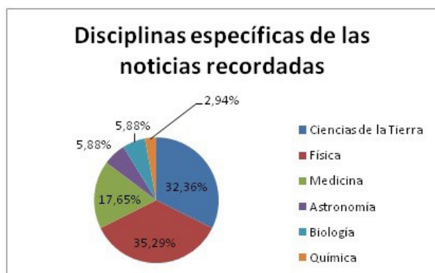
Figura 2. Distribución de las noticias recordadas según la disciplina específica a la que pertenecen

En cuanto al porcentaje de personas de la muestra que recuerdan alguna noticia relacionada con las Ciencias Naturales, podemos destacar que de los alumnos universitarios encuestados, el 44,44 % pudo mencionar algún artículo periodístico. Por su parte, del total de los alumnos pertenecientes al secundario, solo el 15,15 % pudo mencionar alguna noticia leída con anterioridad. Por último, de los profesores, el 87,50 % recordaron algunas notas periodísticas relacionadas con las Ciencias Naturales. Las noticias mencionadas por los encuestados se distribuyen, en relación con las disciplinas específicas, de la siguiente manera: