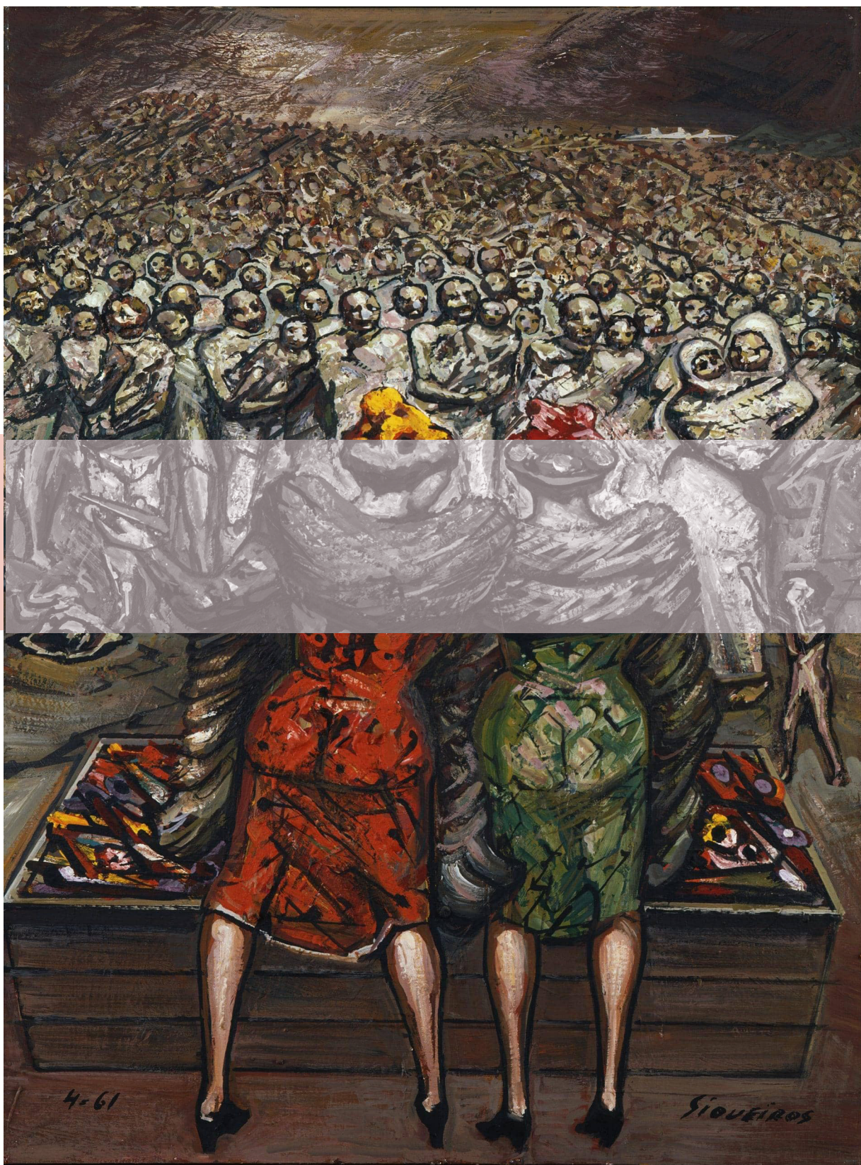
David Alfaro Siqueiros Entrega de juguetes, 1961/ Óleo /Madera 82 x 62 cm