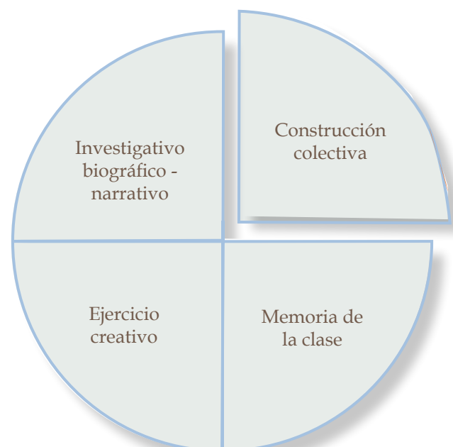
Gráfica 3. Características asociadas a la implementación del portafolio.

En relación con la comprensión de este tipo de ejercicios que promueven la construcción de una identidad docente de manera consciente, a partir de la escritura, es im-