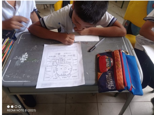
Figura 4 Grupos interactivos