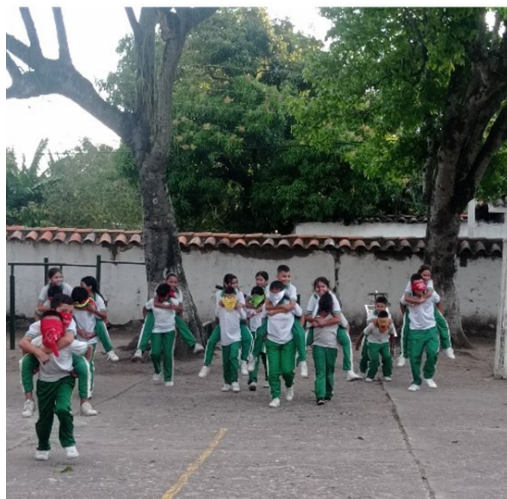
Figura 9 Clase de Educación física