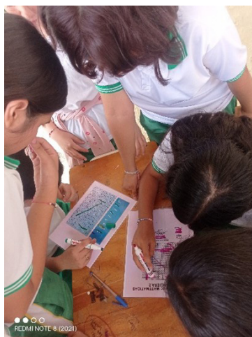
Figura 10 Rally Matemático

La segunda actividad se enfocó en preparar a los alumnos de cuarto y quinto para el “rally matemático”, una experiencia que combinó actividades deportivas y de conocimiento lógico, permitiendo a los estudiantes disfrutar de dinámicas que fortalecieron tanto su aprendizaje como su bienestar emocional como se puede observar en la figura 10.