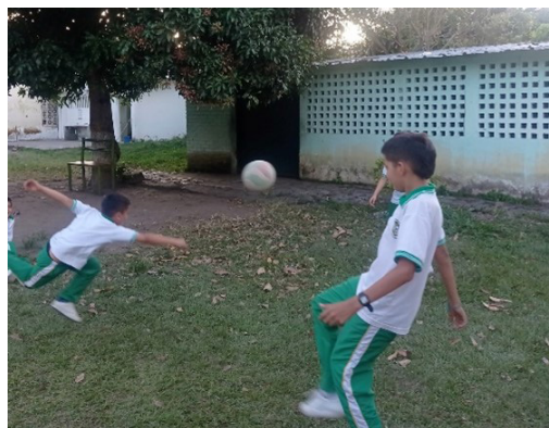
Figura 8 Clase de Educación física

La primera consistió en brindar apoyo en el área de educación física a los estudiantes del grado quinto de primaria, quienes no contaban con un docente especializado en esta área. Gracias a los conocimientos adquiridos en el curso de deporte formativo de la Universidad Surcolombiana, se implementaron actividades que promovieron el trabajo en equipo y la práctica deportiva (figura 8 y 9).