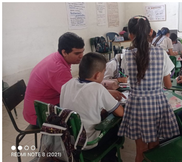
Figura 5 Grupos interactivos