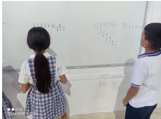
Figura 7 Refuerzos académicos