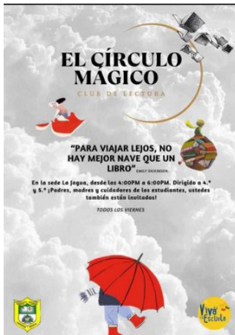
Figura 3 Flyers del club de lectura

Para fomentar la participación, se diseñó un flyer denominado “El Círculo Mágico” (figura 3), cuyo nombre evoca la idea de que la lectura, al integrarse con la historia local y la imaginación, posibilita la creación de mundos llenos de fantasía. Como dijo Emily Dickinson: “Para viajar lejos, no hay mejor nave que un libro”. Este enfoque logró motivar tanto a los estudiantes como a la comunidad, impulsando su participación activa, la mejora de los aprendizajes y en el fortalecimiento de la identidad cultural.