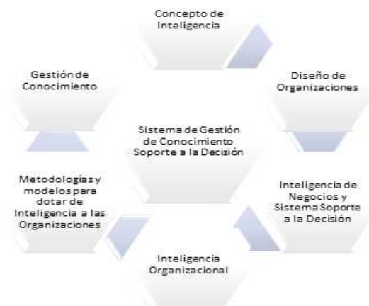
Figura 3. Estrategia para construir el Marco teórico

Atendiendo lo anterior, la estrategia para construir el marco teórico del proyecto de investigación en Inteligencia Organizacional tiene como componentes los que se observan en la Figura: