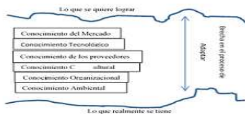
Diagrama 1 Brecha de conocimiento

Es evidente que el fracaso en la creación y desarrollo de las empresas se debe al desconocimiento del comportamiento del sistema organizacional y de su entorno, ya sea la de no conocer el mercado y las preferencias de los clientes, de la falta de conocimiento de los procesos y de la tecnología, de no saber comprender el comportamiento de los proveedores y de los flujos de material, de la cultura organizacional y del impacto al medio ambiente como de observa en la Figura 1.