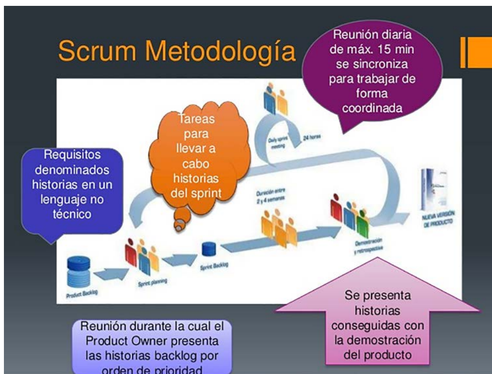
Figura 2. Metodología de desarrollo ágil SCRUM

Para lograr un desarrollo rápido se precisa de metodologías o procesos que amortigüen los problemas que han existido durante el desarrollo de software (Díaz et al. , 2014). Para el levantamiento de las SAO, HFC y alternativas se emplea la metodología de desarrollo ágil SCRUM, donde se definen las principales fases, reuniones y revisiones con las herramientas seleccionadas para ello (figura 2).