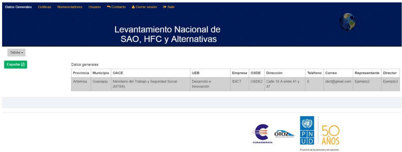
Figura 4. Vista de reportes