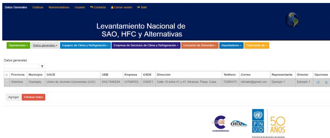
Figura 3. Vista de gestión de la herramienta desarrollada

El sistema generado para el levantamiento de las SAO, HFC y alternativas (San Juan, 2017) ha sido desarrollado completamente sobre tecnologías libres (figura 3, figura 4 y figura 5).