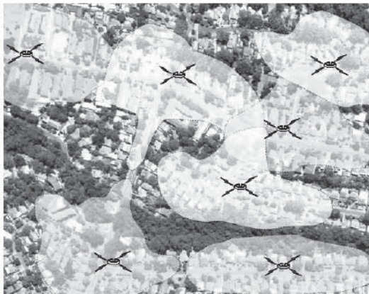
Figura 3. Zonas de cubrimiento Wi-Fi en Bucaramanga. Tomado de [23].

mapa (Figura 3). Cada zona Wi-Fi cubrirá principalmente sitios de interés predefinidos en el Área Metropolitana de Bucaramanga (AMB).