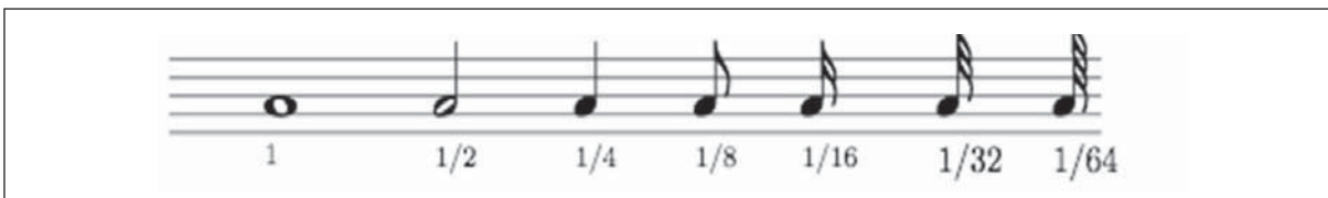
Figura 6. Notas musicales básicas y su respectiva duración sobre un pentagrama musical.