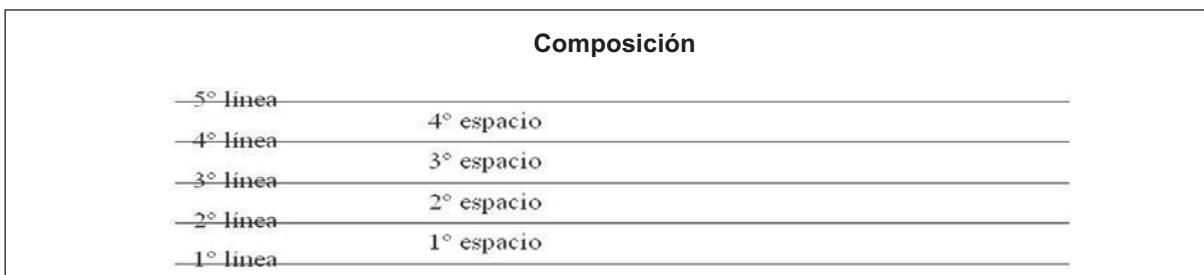
Figura 1. Pentagrama con sus respectivas líneas y espacios.