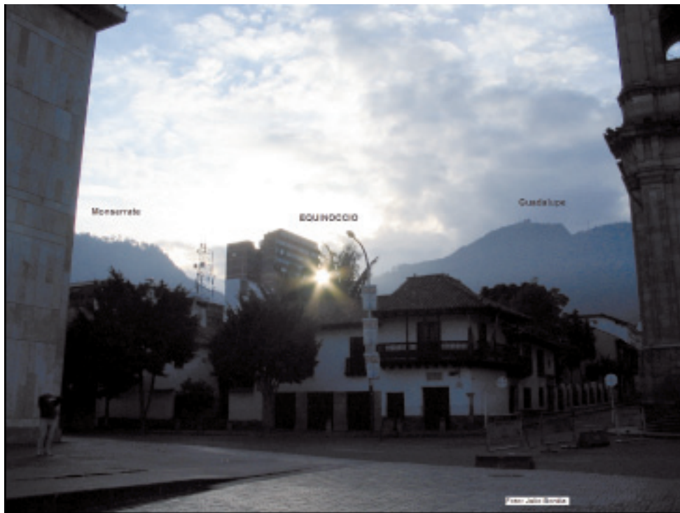
Figura 3. Fotografía al amanecer del equinoccio de 21 de septiembre 2005, visto desde la esquina nororiental de la plaza de Bolívar en Bogotá.