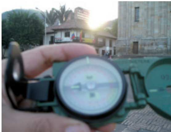
Figura 2. Fotografía del Equinoccio del 21 de septiembre de 2009.