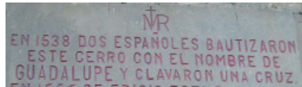
Figura 4. Fotografía de la inscripción en la iglesia sobre la montaña de Guadalupe. Tomada por Julio Bonilla

Según la historia oficial, Bogotá fue fundada el 6 de agosto de 1538 (sobre la ciudad que ya existía). Subiendo a la montaña sobre la que se encuentra la iglesia de Guadalupe, en una de sus paredes se puede leer una placa que reza: “EN 1538 DOS ESPAÑOLES BAUTIZARON ESTE CERRO CON EL NOMBRE DE GUADALUPE Y CLAVARON UNA CRUZ”.