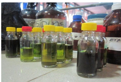
Figura 2. Extractos de hojas y cortezas

Se extrajeron 90 extractos definidos por las cinco especies cada uno con la determinación de corteza y hojas y tres individuos distintos por especie. Las muestras para extracción se secaron en el horno de convección del Laboratorio de Silvicultura de la Facultad de Medio Ambiente y Recursos Naturales de la Universidad Distrital Francisco José de Caldas, durante 72 horas a una temperatura de 50°C, posteriormente se trituraron en molino mecánico y se procedió a la maceración en etanol a temperatura ambiente con filtraciones continuas hasta conseguir el extracto etanólico posteriormente etiquetado. Para la obtención del extracto ácido se realizaron filtraciones con adición de ácido sulfúrico (H 2 SO 4 ).