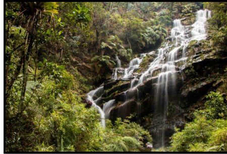
Figura 1. Quebrada Las Delicias

De acuerdo con Herrera (2014) "un ecosistema estratégico es una porción geográfica con características especiales y valores únicos que garantiza la oferta bienes y servicios ambientales imprescindibles para el bienestar de las personas y el equilibrio natural." (p.51)