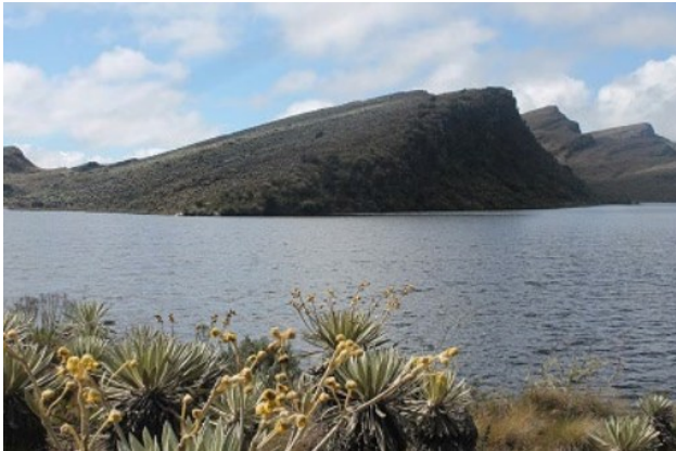
Figura 1. Río Sumapaz