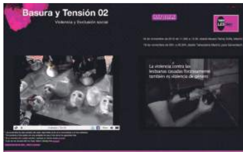
▲ Imagen 6: Captura de pantalla del canal de streaming en directo de Toxic Lesbian, www.toxiclesbian.org durante la retransmisión del proyecto El esqueleto tatuado con Suzanne Lacy (2010).