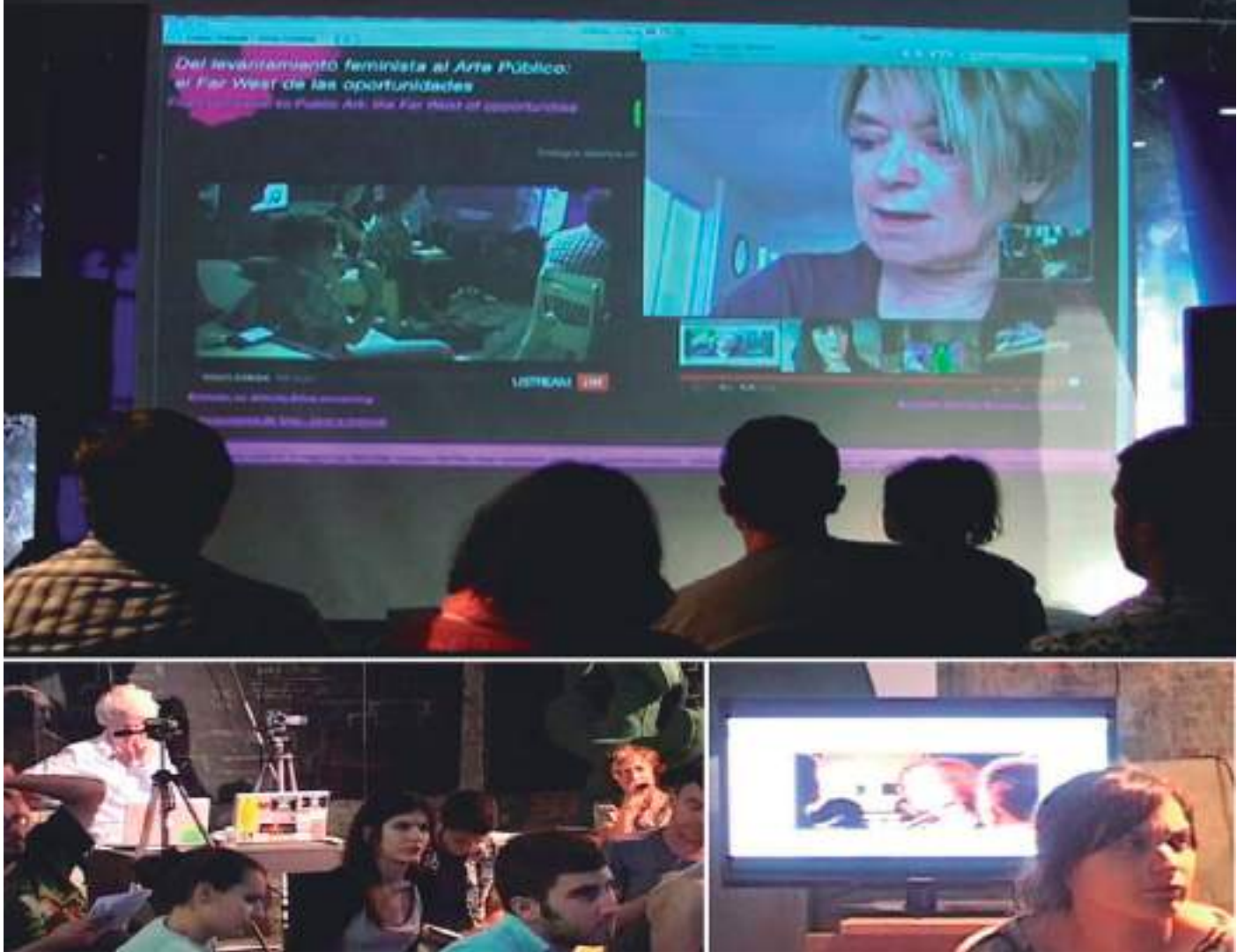
▲ Imagen 1: Suzanne Lacy durante el ciberencuentro en Matadero Madrid en mayo de 2014.

La primera cuestión abordada pretendió dilucidar el crucial papel que el movimiento feminista jugó en la definición del arte público actual; la segunda, qué era lo que buscaban o qué querían las mujeres artistas al experimentar estas nuevas tendencias. También quisimos ahondar en la relación entre estas apuestas estéticas feministas iniciadas en los años 70 por artistas mujeres de su misma generación y el ciberarte feminista. Finalmente, nos interesamos sobre el concepto de autor y su radical cambio conceptual en manos de, precisamente, estas artistas feministas: quisimos saber por qué redefinen con sus prácticas el concepto de autoría.