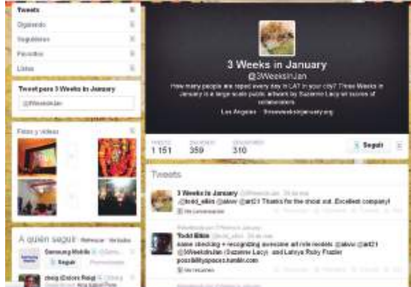
▲ Imagen 3: Suzanne Lacy utilizó Twitter en 2012 en su proyecto Three Weeks in January .

A pesar de estos inconvenientes, ella incorpora en sus últimos proyectos protocolos de comunicación online, delegando, eso sí, su gestión a terceros. Lacy nos explica cómo generacionalmente se siente más implicada en el “cuerpo a cuerpo”, de modo que la virtualidad le concierne mucho menos. No en vano, la primera etapa del cambio deseado en las