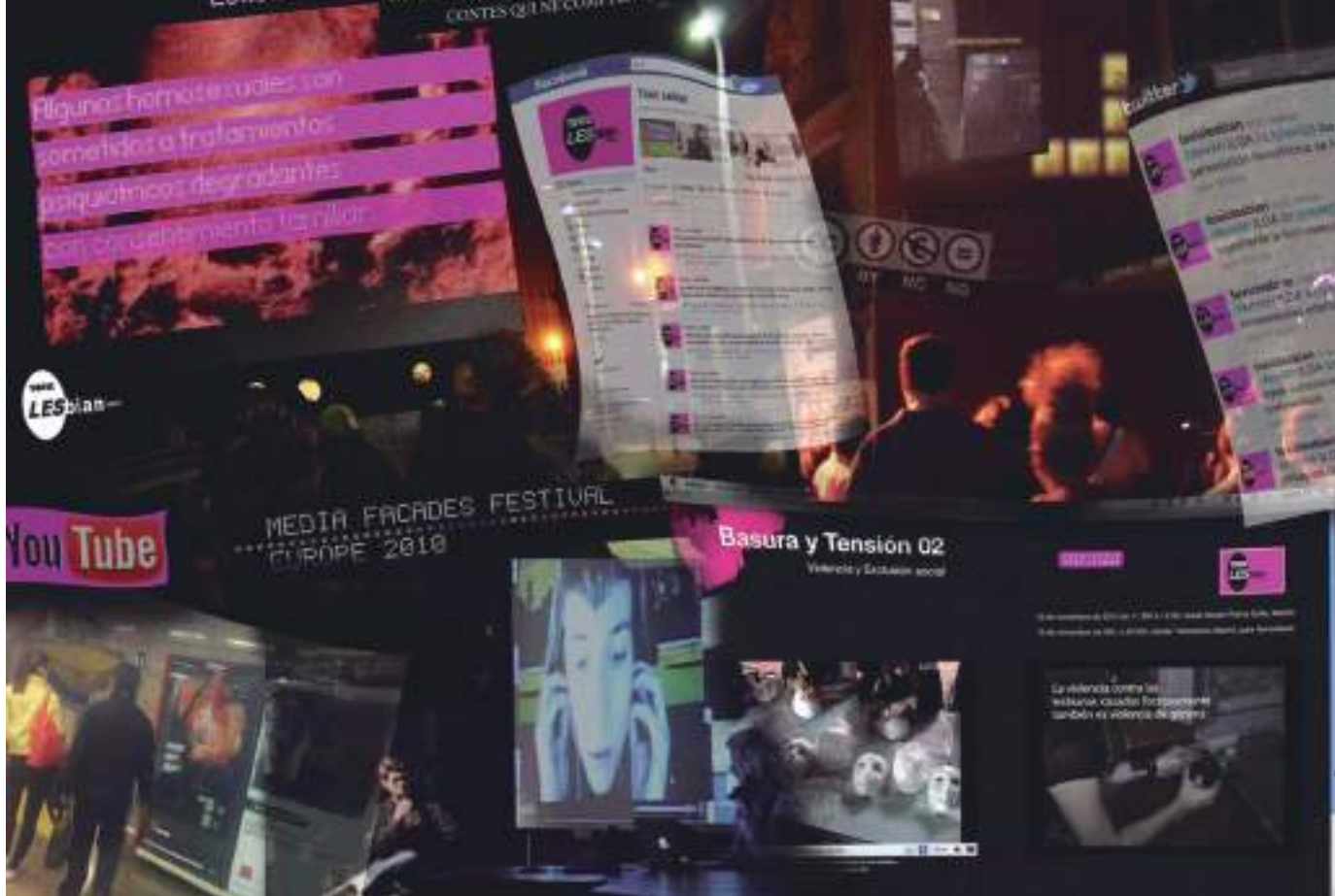
▲ Imagen 2: Las manifestaciones de arte público digital presuponen la creación de comunidades a través del uso de redes sociales, los encuentros con el público en la calle o en las propias instituciones culturales.

Lacy es, precisamente, ese interés en la efectiva y verdadera transformación de la realidad a través de las herramientas que propicia el arte. Para lograr este mismo fin, los caminos tomados por artistas desde el entorno de género han sido muy variados. Es más evidente el deseo de transformar la realidad en este grupo de artistas que en los colectivos de artistas hombres, y dentro de estos, serán los blancos, heterosexuales, procedentes de culturas cristianas y clases medias o altas los que más se alejan de esta intención. Es altamente relevante apreciar que en cuanto un artista sufre discriminación por alguna de las causas que habitualmente se producen en la sociedad, su producción artística se ve claramente preñada, bien de pensamiento crítico en sus contenidos, bien de estrategias más o menos rupturistas con el medio convencional de exhibición y comunicación del arte. Es lógico, en cuanto que el medio artístico es un claro reflejo del status quo, de lo que "no debe cambiar": del patriarcado, en definitiva.