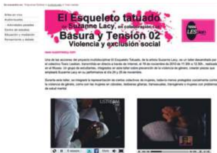
▲ Imagen 5: Interface captada durante la retransmisión en directo a través de internet del Museo Nacional del Centro de Arte Reina Sofía en 2010 de la performance de Toxic Lesbian incluida en el proyecto de Suzanne Lacy para esa institución.

Siguiendo el discurso en torno al poder no cabe duda de que la idea de la autoría, la nueva autoría, queda más o menos desdibujada a partir de lo que la red y cierto activismo artístico permiten. Durante el proyecto que Suzanne Lacy llevó a cabo en el Museo Nacional Centro de Arte Reina Sofía en 2010, El esqueleto tatuado , la artista colaboró para su producción con Toxic Lesbian, quien llevó a cabo como parte del proyecto un performance transmitido en directo a través de su propio canal de streaming en www.toxiclesbian.org (imagen 6) y la propia web de la institución (imagen 5). De esta parte de la pieza lo que resta es inmaterial, creación web. Esta acción en directo constituyó la primera o una de las primeras piezas transmitidas por el museo y suponía una proyección en este medio.