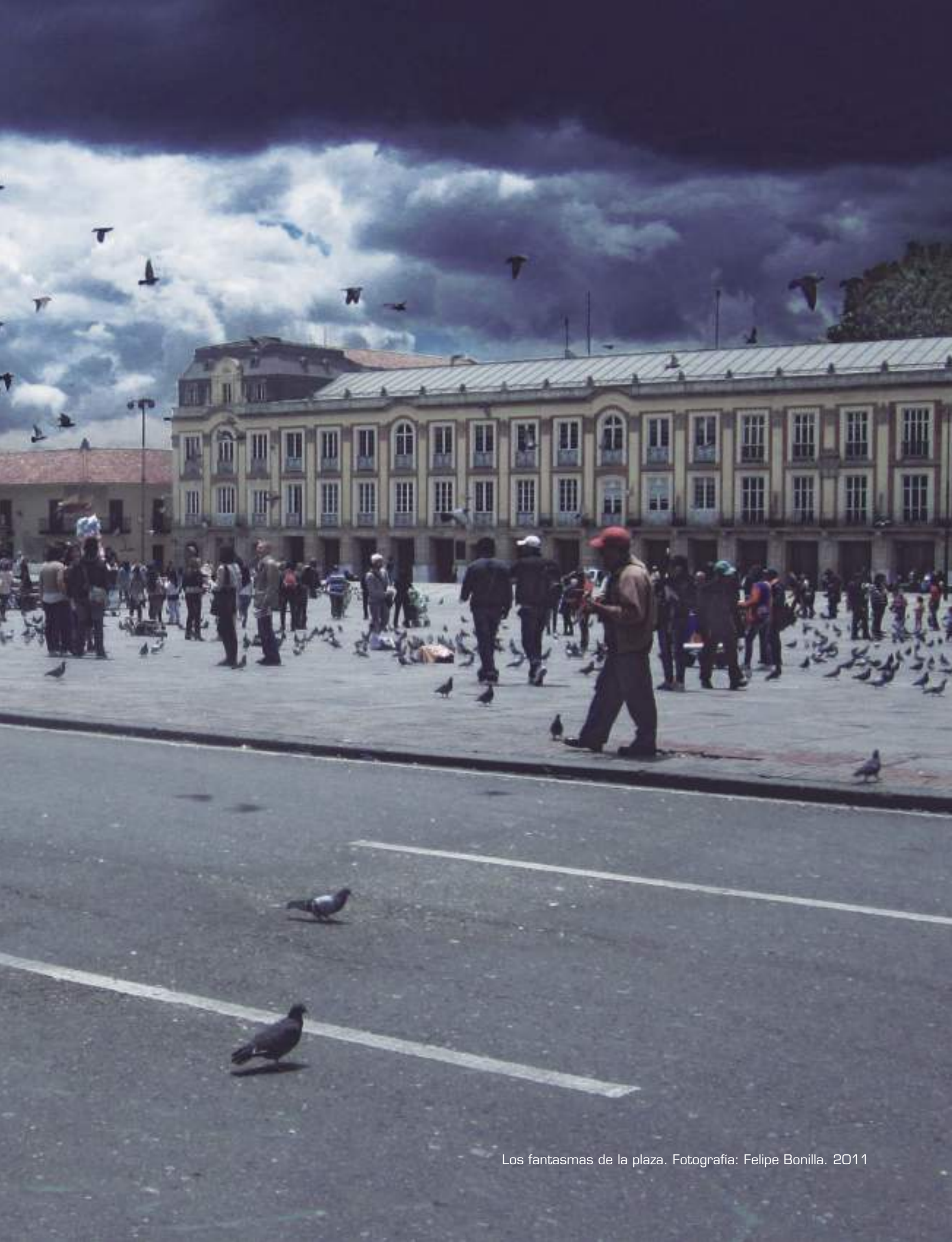
Los fantasmas de la plaza. 2011