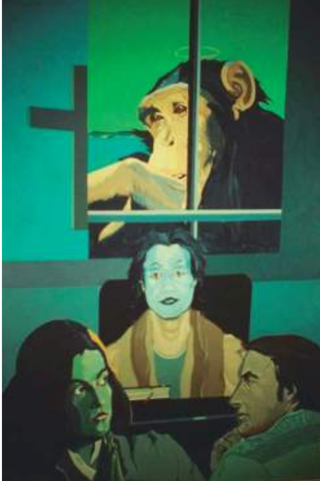
▲ Raquel Ramírez. Séptimo Penal No. 2 . Acrílico sobre lienzo. 100 x 70 cm. 1980. Ubicación de la obra: desconocida

en la celda a la artista, que deja ver sobre su cabeza una aureola como señal irrefutable de inocencia, mientras va lanzando por su boca pompas de chicle en su afán de distanciarse irónicamente de tan vulgar representación barroquizante. De acuerdo con las declaraciones de Ramírez: