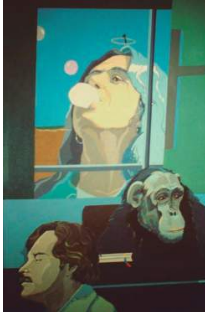
▲ Raquel Ramírez. Séptimo Penal No. 4 . Acrílico sobre lienzo. 100 x 70 cm. 1980. Ubicación de la obra: desconocida

En términos formales, el uso de módulos para contar este “hecho anecdótico” (testimonio más de