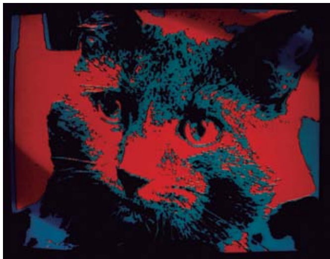
▲ Fotograma de uno de los videos que forman Zapping Zone .

Catherine Lupton de entender Zapping Zone como “entidad física” (Lupton, 2006). Debe señalarse, por otro lado, que a pesar de la disposición lineal según las exigencias del formato y de aparecer ordenadas numéricamente, las distintas notas han sido elaboradas autónomamente sin atender a ninguna clase de lógica de conjunto.