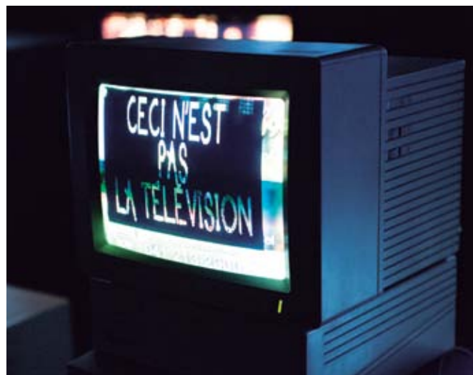
▲ Detalle de uno de los monitores de Zapping Zone en el Kunstnernes Hus de Oslo.

La revista rusa Kinowedtscheskije sapiski , según el comentario de Thomas Tode en una conferencia pronunciada en 2002, hizo pública una encuesta sobre el futuro del cine en la que Marker concluía: "No, el cine no conocerá un segundo siglo. Eso es todo". Los nuevos medios tecnológicos serían, consiguientemente, la fuente que Marker encontraría para la renovación de su actividad creativa durante la década de los noventa. La computadora Apple II GS TV MAC, los doce discos láser, las dos cintas U-Matic, los doce reproductores de disco láser, el reproductor U-Matic, los trece monitores y el reproductor de sonidos, hacen de Zapping Zone su primera gran instalación multimedia. En adelante, su trabajo muchas veces consistiría en reciclar sus propias imágenes para darles una segunda vida habiendo sido convertidas mediante estas y otras tecnologías en algo distinto.