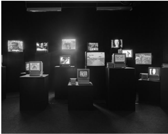
▲ La instalación Zapping Zone en el Kunstneres Hus de Oslo.

Echemos ahora la mirada sobre otras de sus obras. Una memoria que se estructura por imágenes visuales y sonidos ensamblados en una articulación laberíntica: esta sería la modalidad táctica de la instalación interactiva Roseware , la obra en progresión realizada por este autor un año después del cd-rom de 1997 Immemory . En una pieza y en otra se sigue esta idea y se aplica esta táctica, algo que por otro lado ya se manifestaba de forma latente en su célebre ensayo cinematográfico Sans soleil , una década y media antes. Pero, en Roseware se añade además la aspiración utópica de que los sueños y los recuerdos de todas las personas pudieran algún día coexistir. Roseware es una obra abierta en la que se insta a cada usuario a introducir sus propios fragmentos visuales, sonoros o textuales como reflejo de su memoria y, también, como parte de una memoria total que todos compartimos.