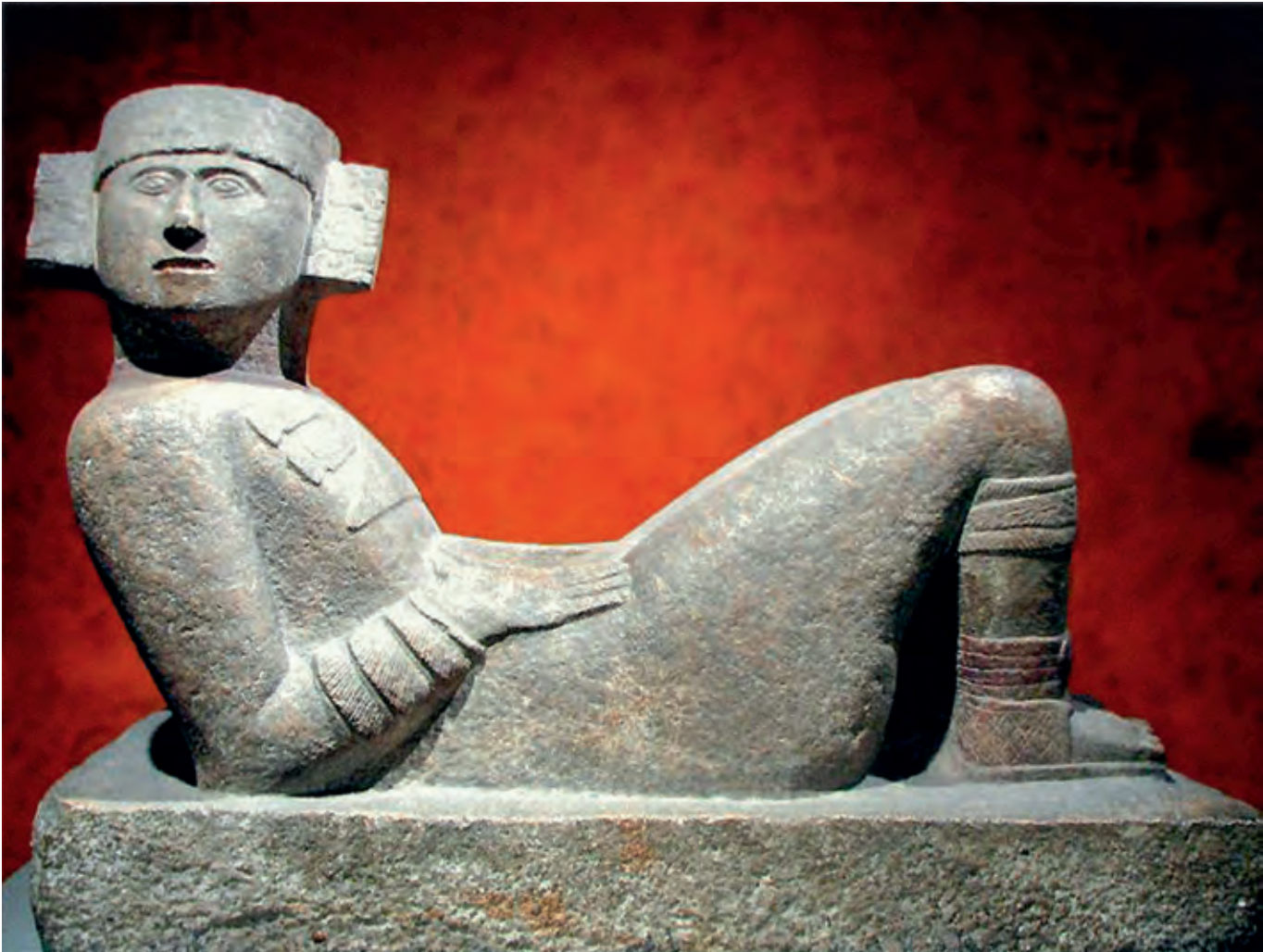
Imagen 2. Maya, Chac Mool.