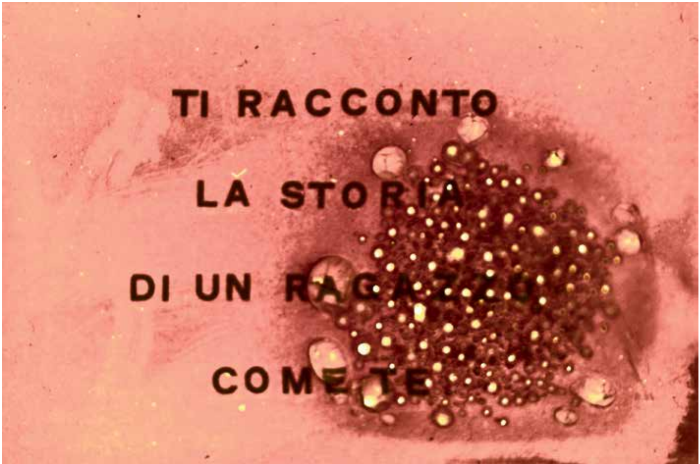
Imagen 1. Metacuento , correspondiente a un carrusel de diapositivas encontradas y posteriormente modificadas. Claudia Salamanca (2018).

desedificante, casi todo invita y gravita, oscila y vacila por lo cogido de antemano, undosa combinatoria telepática no necesariamente al son del Ahorcado marsellés, bailarín aéreo ufano del nudo de su wit, en antiguo alto alemán "soga" de nuevo, casi nada que ver o no ver con Witz, espesa broma freudiana, conste para no herir susceptibilidades reacias a las tradiciones populares de ultramar como si por el lado de allá no urgiera e insurgiera un Sur casi tan jodido como el de acá, desedificante y desdiciente ningún supremo dictado, a lo sumo verticalismo de Totalidad e Infinito , interperspectiva de Alieno y Altísimo dondequiera que "la dimensión misma de la altura está abierta por [ est ouverte par ] el deseo metafísico" (Lévinas, 1971, pp. 4-5; trad. 59), a pacto de acoger por cuenta relativamente nuestra el anhelo de todos los anhelos hasta la encarnación de lo metafísico en lo famélico capaz de reventar dicotomías de urna excelsa y vida en bruto mientras la mirada precipita por su cuenta y riesgo hacia una "animalidad" desafortunadamente comprometida con el imperio contranimista de la utilería promovida por los "malvados [ méchants ]" en reemplazo de las cosas vivas no digo después de haber levantado los ojos hacia la " noblesse " (Lévinas, 1971 pp.