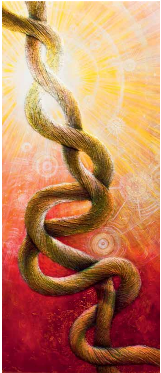
Imagen 2. Fuego interior , de la serie Graffas del Espíritu . Javier Lasso (2013). Técnica mixta 123 x 80 cm.