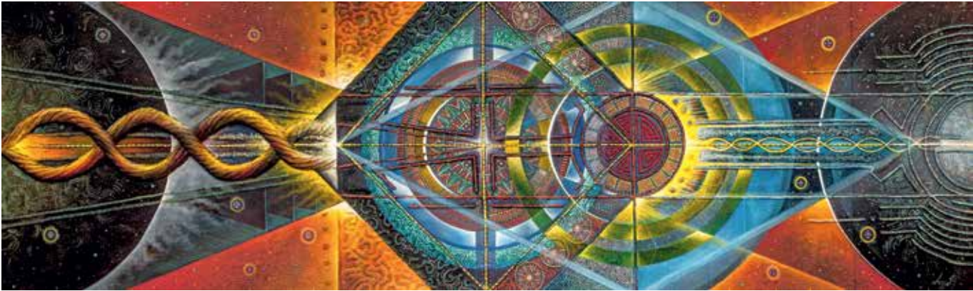
Imagen 3. Pineal, de la serie Graffas del Espíritu . Javier Lasso (2013). Técnica mixta, 200 x 60 cm.