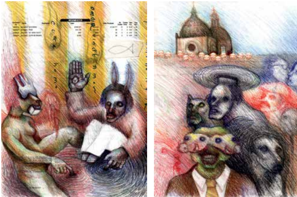
Imagen 4. De la serie Estampas de la cordialidad . Jhon Benavides (2018). Dibujo sobre papel.