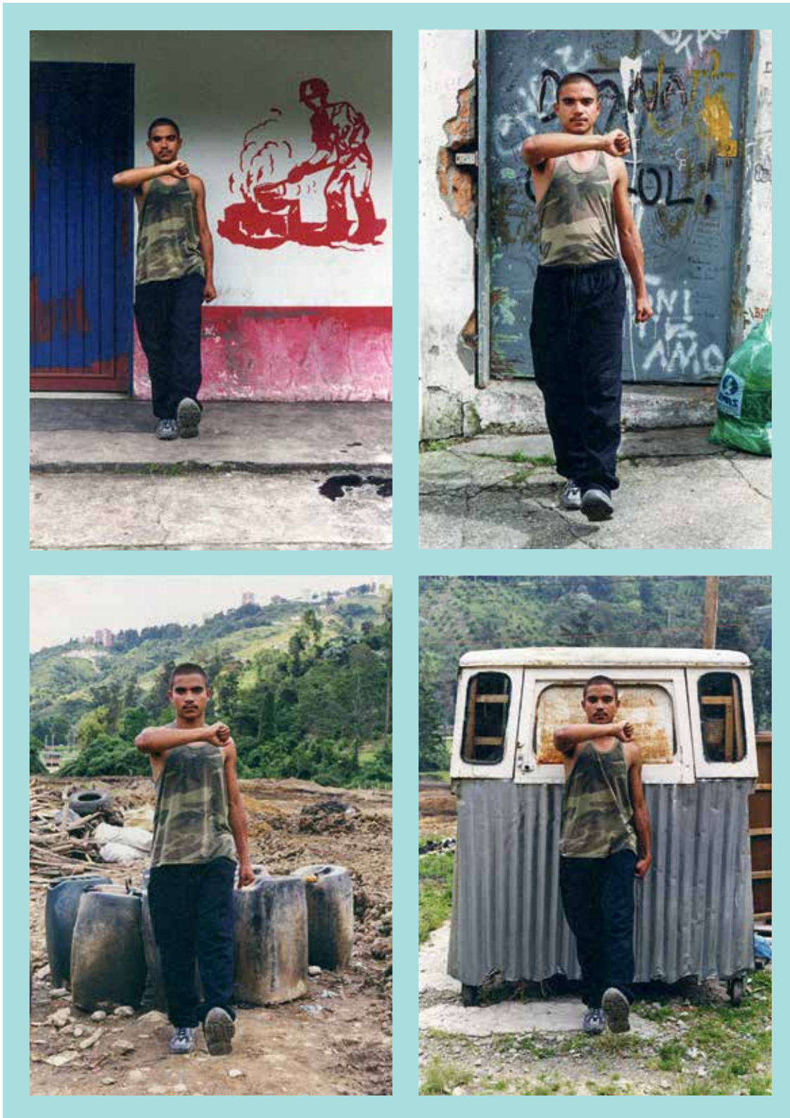
Imagen 2. Muro Radioactivo. 1000 fotografías pegadas en un muro. Jaime Ávila (sf). Detalle. 15 x 3 m.