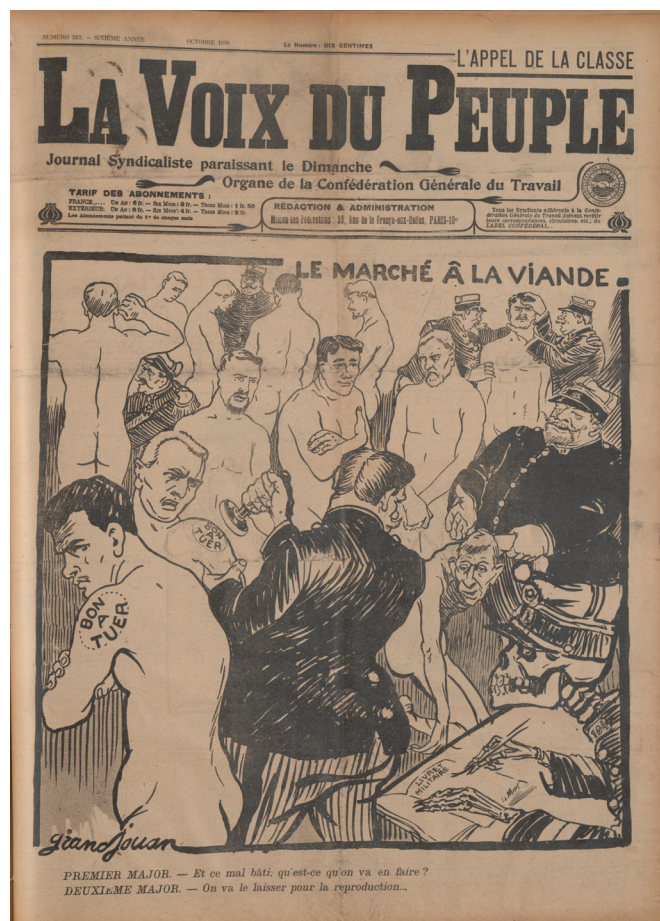
Imagen 7. Jules-Félix Grandjouan. Le Marché à la viande. En La Voix du Peuple , Paris, octubre 1906. IISG ZF 10330.