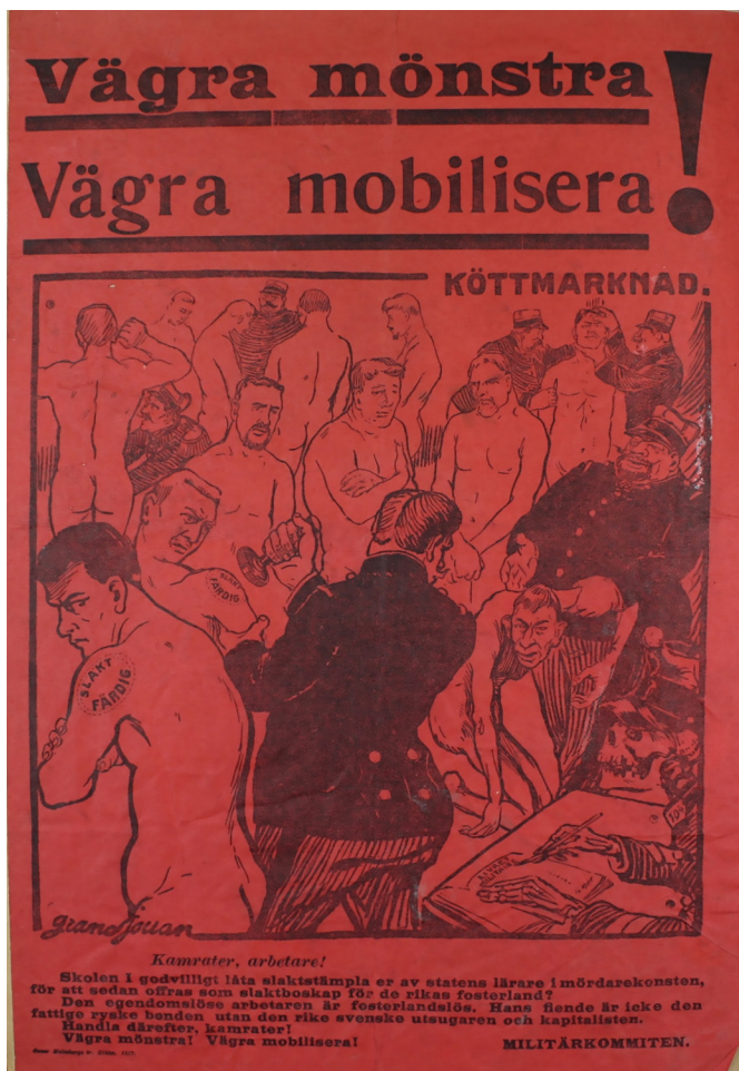
Imagen 6. Después de Jules-Félix Grandjouan. Vägra Mönstra/Vägra mobilisera! Cartel. 33x24 cm. Estocolmo, 1913.