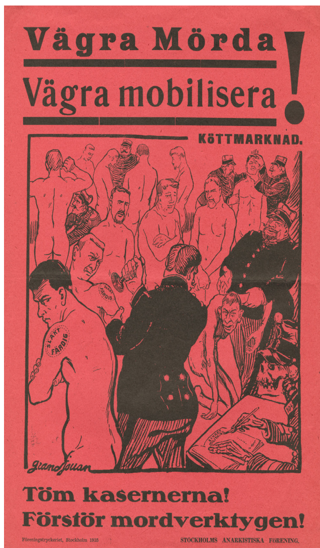
Imagen 5. Después de Jules-Félix Grandjouan. Vägra Mörda/Vägra mobilisera! Cartel. 33x24 cm. París, 1935. IISG BG C18/32.

directa del francés al sueco: "Köttmarknad" [carnicería]. Esto no se repite en el pie de página de la imagen. En ella se superpone una arenga afín con el sentir de sus pares argentinos: "Töm kasernerna! Förstör mordverktygen!" [¡Liberen las barricadas! ¡Destruyan las armas asesinas!].