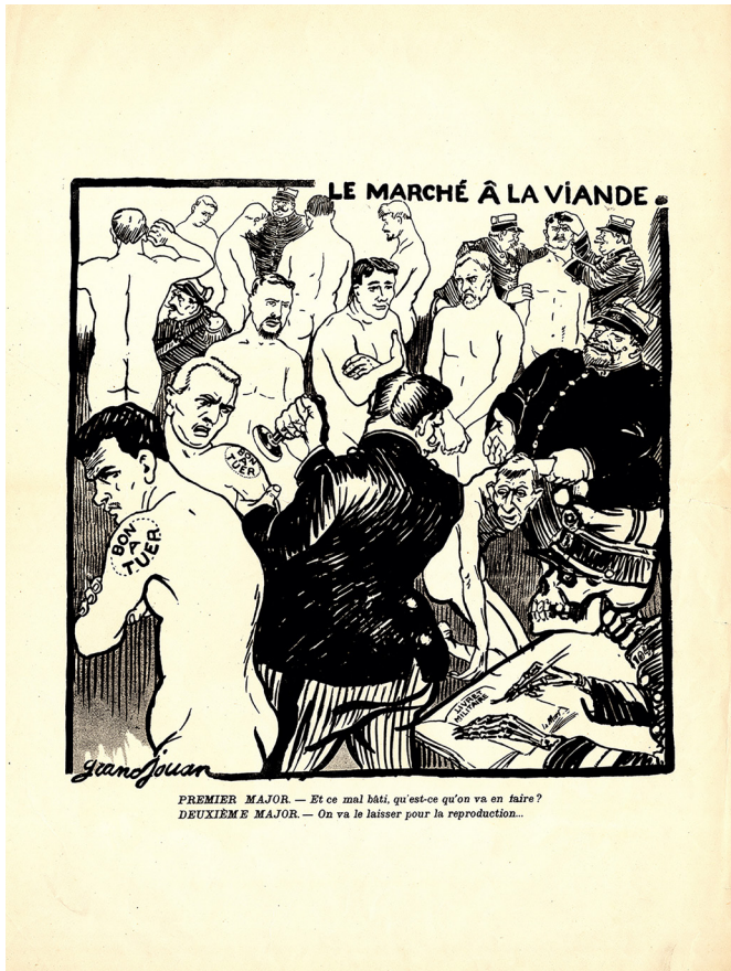
Imagen 3. Jules-Félix Grandjouan. Le Marché à la viande . Litografía. 60.5x45 cm. París, 1906. IISG BG D23/498.