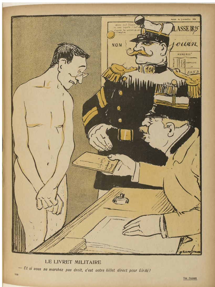
Imagen 2. Jules-Félix Grandjouan. Le livret militaire . En L'Assiette au beurre , París, 4 de agosto, 1906. Gallica-RES G-Z-337.

Esta diáspora migrante se ve reflejada en el número del 1 de mayo de 1927. En dicho número encontramos un texto antimilitarista de autoría anónima. En él se debate el proyecto de “militarización social” encabezado por la Liga Patriótica Argentina 1 como un camino hacia la degradación de “millares de hombres”, la emergencia de regímenes dictatoriales y de un “fascismo criollo”. El rechazo del alistamiento es incentivado a favor de la “autonomía y libertad” de cada individuo ( Hablemos de la Argentina , 1927). La propaganda antimilitarista no se limita al lenguaje verbal. Entran en escena dos obras gráficas: una