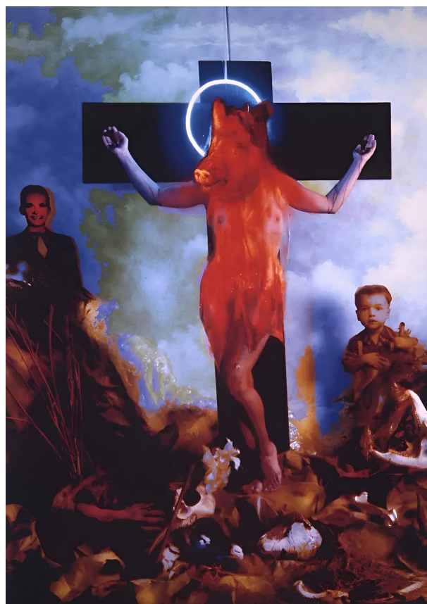
Imagen 1. La crucifixión del cochino levitando , 1993.

porque busca importunar, generar cierto malestar en la sociedad. En efecto, Garrido con su obra consiguió molestar a sus contemporáneos, ya que, por ejemplo, un clérigo solicitó que se retirara la fotografía; así mismo este sacerdote tildó a Garrido de satánico. Ahora bien, si esta obra sólo se quedara en importunar o generar desagrado a cierto grupo social, no sería considerada como feísta. Dado que, siguiendo la definición recién dada, el feísmo también pretende generar crítica social o reflexión en el público. Justo esto es lo que hace Garrido con " La crucifixión del cochino levitando "; pues en una entrevista que se le hizo al artista venezolano este afirmó: