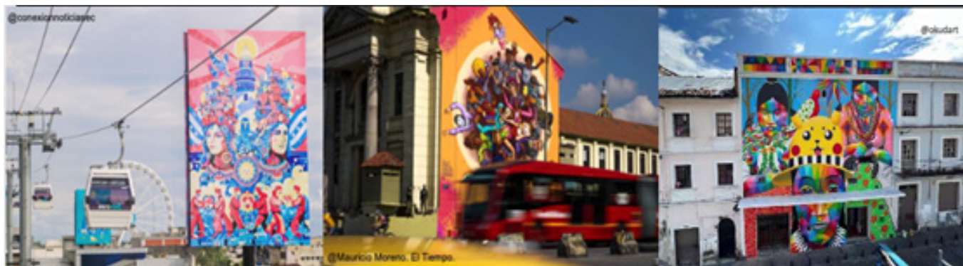
Figura 4. Aeroarte Primicias. (2024, mayo 15). Aeroarte: ¿novedad o contaminación visual en Guayaquil? (izquierda) Distrito Bronx. El Tiempo. (2022, mayo 15). Graffiti 'Pararse duro' es el nuevo mural del Bronx Distrito Creativo. (centro) Caminararte. Quito Informa. (2022, mayo 15). Mural de Okuda San Miguel: Una obra artística que embellece la ciudad y en la que no se emplearon recursos públicos. (Derecha)

imaginación y su retina de formas y referentes, sin que se dé cuenta de ello ni pueda ofrecerles resistencia" (2008, p. 67).