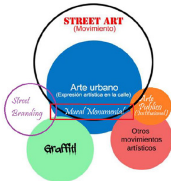
Figura 1. Imágenes artísticas visuales en las calles: Propuesta relacional. Con base en Fernández Herrero (2017) con categorías adicionales de Tricanico, Phillips y Canales; Barón López (2021) 3

como un termómetro de las coyunturas del panorama político y social.