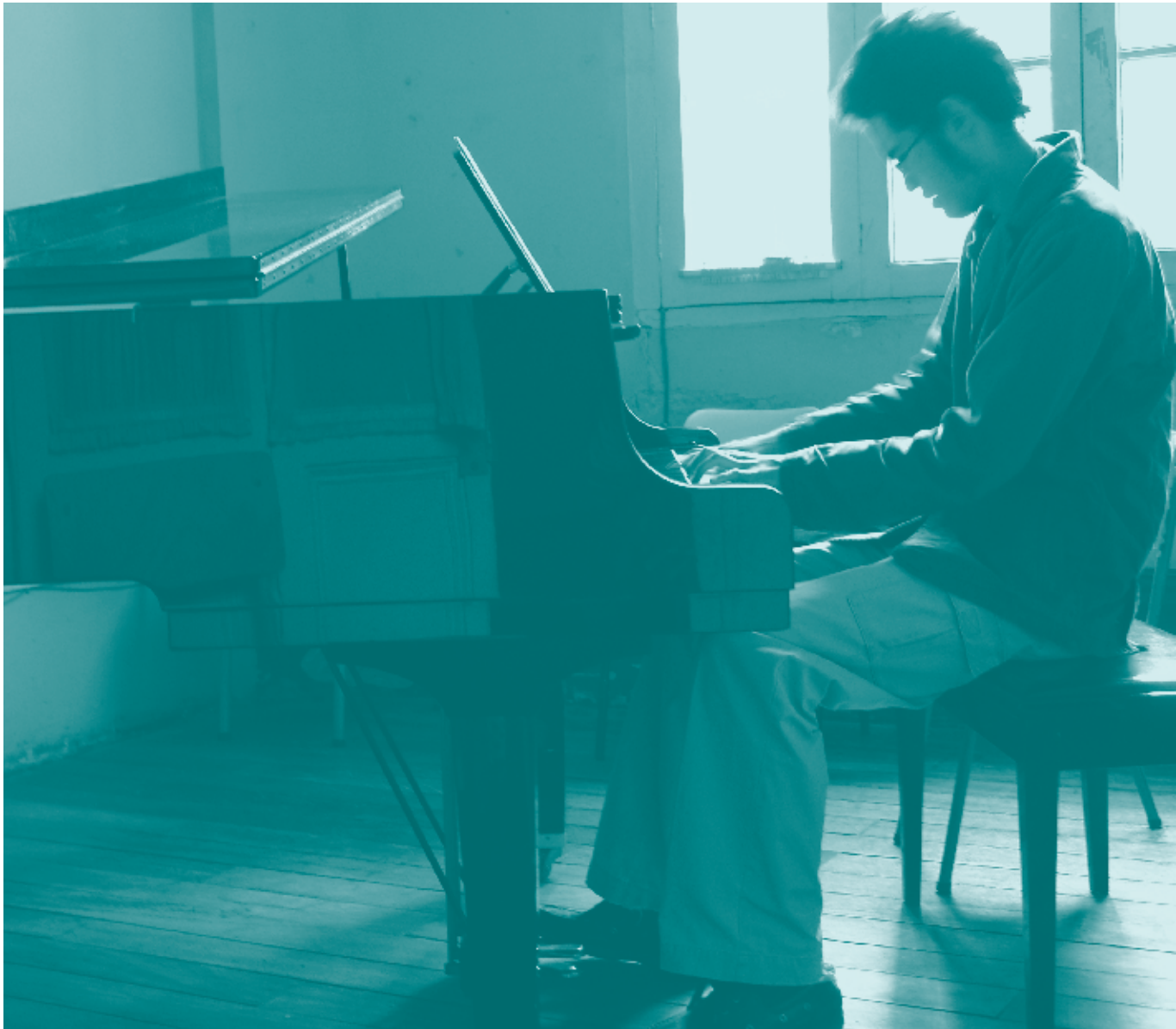
▲ Archivo Facultad de Artes ASAB. Fotografía: Alex Usquiano, 2007

especiales que poseen dones mágicos, ídolos o héroes que están más allá de lo terrenal (lo cual muestra que la muy mencionada aura benjaminiana no solo se encuentra en las obras sino también en los productores).