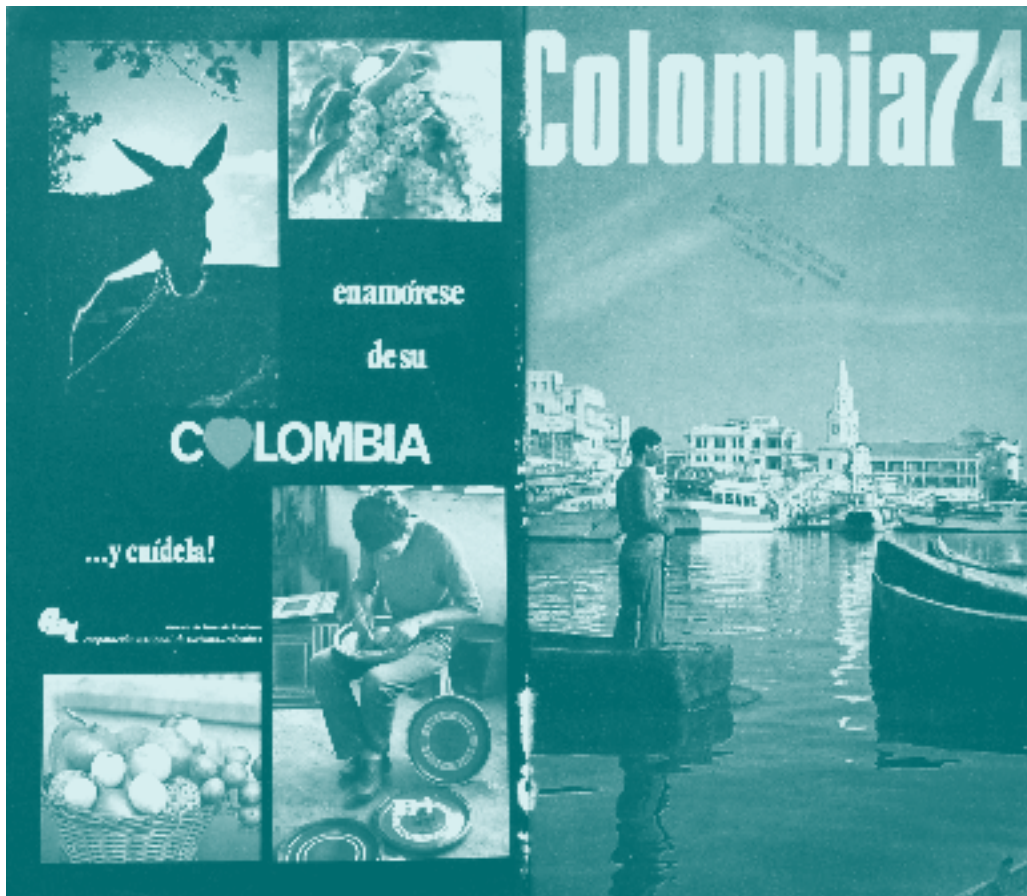
▲ Imagen 2. Pauta de la CNT en la Revista Colombia

veía representado en ella a través de diferentes producciones visuales.