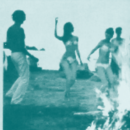
◀ Imagen 3. Pauta de la CNT en la Revista Colombia