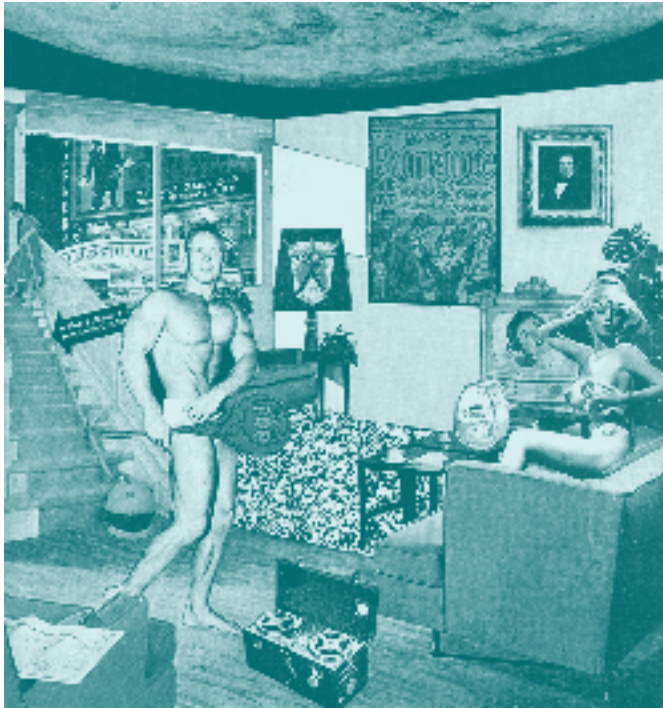
◀ “Just What Is It That Makes Today's Home so Different, so Appealing?” Richard Hamilton, Collage 1956. (Kunsthalle Museum, Tübingen, Germany)

su predestinación de pobres, artesanos y gremios. La prueba de esta distinción es patente en la fundación en 1561, por el propio Vasari, de una institución en Florencia que prolongará sus intenciones periodísticas divinizantes: la Accademia del disegno . Surge así el modelo académico en las artes visuales, uno muy anterior a otros modelos académicos establecidos posteriormente durante el reinado de Luis XIV, como el medicinal, el de la jardinería, el arquitectónico o el de moneda. El modelo académico visual fue un modelo muy usado por todo régimen absolutista subsiguiente, desde el de Luis XIV, pasando por Napoleón, Hitler y Stalin, hasta el de dictadores latinoamericanos como Trujillo o Videla, aunque en estos dos últimos se manifestó como asesinato o censura más que como arte estatal. Por un tiempo el legado de Vasari no fue muy popular, y su continuación se debe a Federico Zuccaro, cuando este abrió en 1593 la Academia San Lucas de Roma, usurpada prontamente por el papado, que logró exportar el modelo divinizante rápidamente a Francia. Con la fundación en 1648 de la Real Academia de Pintura y Escultura en París, durante el reinado de Luis XIV, el modelo creativo divino se extendió por toda Europa, comenzando por Londres (1707) y Madrid (1752), expandiéndose virulentamente por América en México (1785) y Filadelfia (1805), y terminando tardíamente en Bogotá (1886), y luego, en pleno siglo XX, en China (1928) y otros lugares.