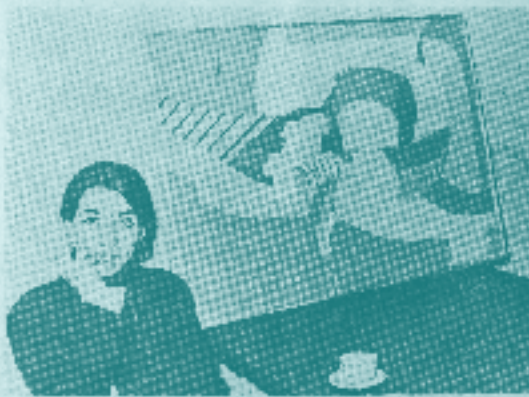
La Ganadora del Segundo Premio Junto a su Obra, en Bogotá