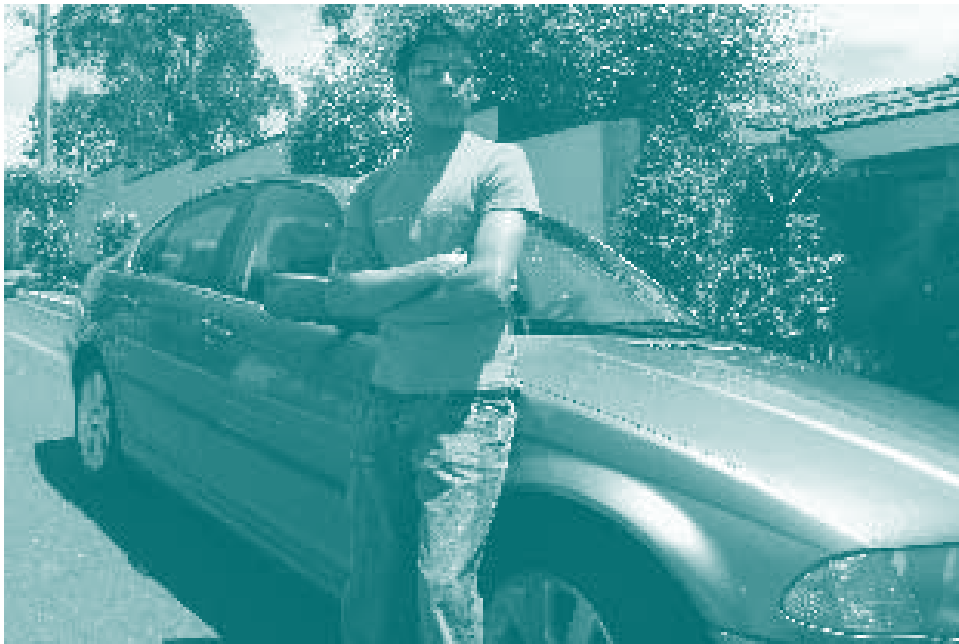
◀ Hijo de papi , colectivo ojo mecánico