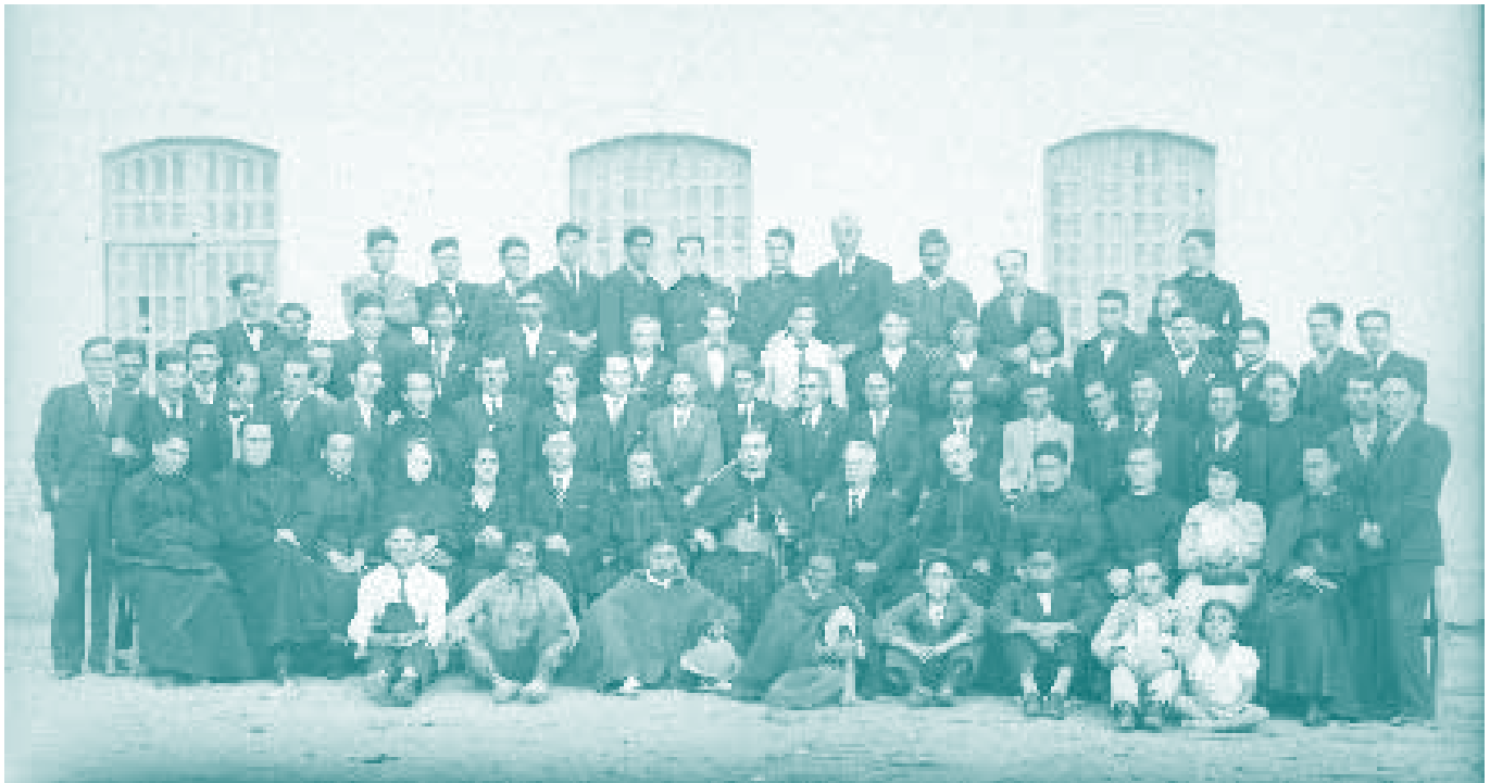
▲ "Retrato grupal", serie: Los notables, década de 1930

Pues he dado cuenta de cosas que se contienen, es decir bienes que se han hecho así para el servicio de dios y de Su Majestad con nuestras ilustres conquistas, y aunque fueron tan costosas de las vidas de todos los demás de mis compañeros, porque muy poco quedamos vivos, y los que murieron y fueron sacrificados, y con sus corazones y sangre ofrecidos a los ídolos mexicanos que se decían Texcatepuca y Uichilobos.