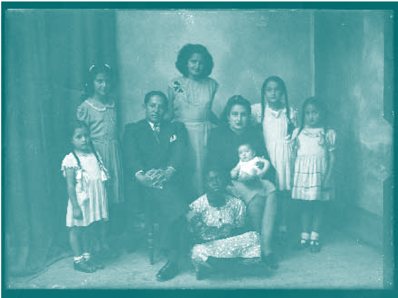
▲ "Retrato de familia", Ibarra, Miguel Ángel Rosales, ca. 1935

(posicionamiento y proximidad/distancia) que remiten a una forma de colonialidad del poder y del ser. El padre/hombre/burgués/blanco vs. la sirvienta/mujer/niña/negra. Una segunda mirada permite descubrir que la niña negra ha sido colocada por el fotógrafo en una posición ambigua: los padres la interpretarán como una posición de subordinación (el piso: región de lo primitivo, sucio, oscuro - calibanesco en la formulación de Roberto Fernández Retamar), pero al mismo tiempo el espectador advierte rápidamente que la niña ha sido puesta por el fotógrafo en el lugar de la composición que registra el final del recorrido de la mirada 6 . Un lugar en el que finalmente quedamos solos con la mirada que la niña negra nos devuelve. ¿Coincidencia? ¿Intuición de un fotógrafo comprometido con la ideología socialista?