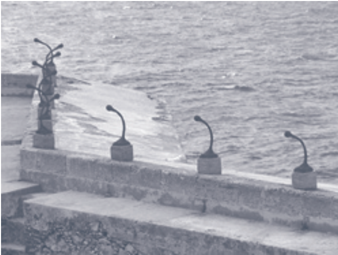
▲ 1,2,3 probando , Galería DUPP, Hierro fundido y hormigón. Dimensiones variables. Noviembre, 2000

raigalmente dialógica en los roles intercambiables de educador/educando, productor/lector se adscribe a un abordaje constructivista de la mediación, concebida esta desde los cuestionamientos, las problematizaciones, la interacción, la práctica reflexiva y liberadora (Freire, 1975; 1986; 1996; 1999).