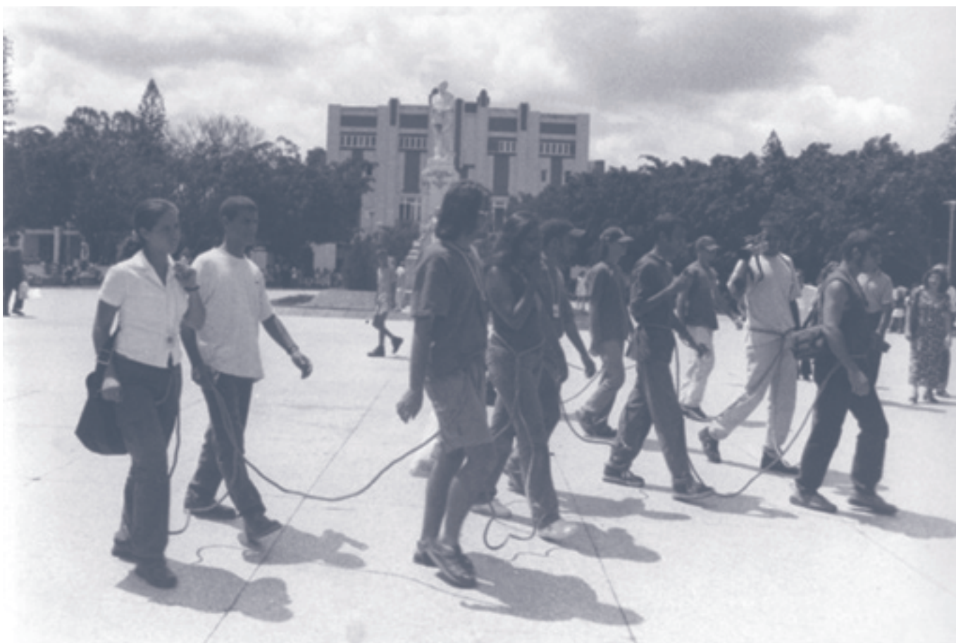
▲ Amarre. Colectivo Enema. Mayo, 2001

Un punto culminante del desenvolvimiento del proyecto fue la exposición del colectivo "Recursos humanos", que durante dos semanas se mantuvo bajo el principio de que diariamente cada miembro del colectivo se daba a la tarea de re-apropiarse de la acción que había realizado el día anterior su compañero, lo que resultó que al término de la exposición el colectivo había desenvuelto más de un centenar de performance. Para la ocasión el colectivo se hizo de un uniforme y de una tarjeta de asistencia personal que cada uno marcaba a la entrada y salida de su jornada laboral en la galería, en directa alusión al performance de Hsieh de un año marcando una tarjeta.