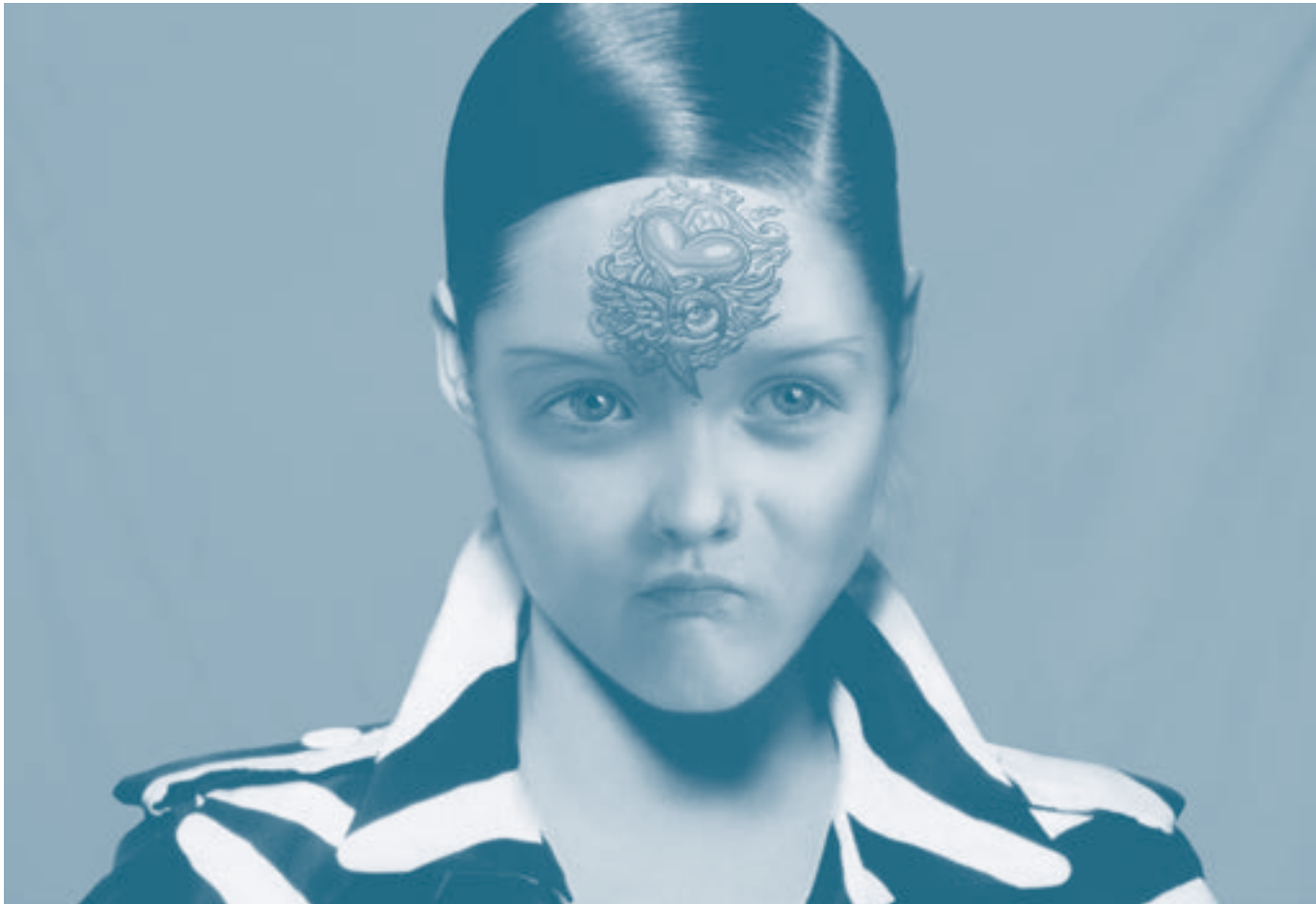
▲ "Sin título". Pride . Fotografía y montaje digital. Cecilia Avendaño, 2009.

y con una distribución homogénea que resalta aún más la presencia de cada silueta corporal.