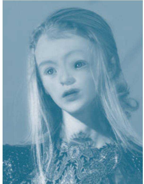
► "Sin título". Pride . Fotografía y montaje digital. Cecilia Avendaño, 2009.

de sí mismo (2007, p. 56). Solo un individuo con estas características puede garantizar la reproducción del actual sistema de acumulación capitalista y su dinámica imparable de mercantilización. Los cuerpos construidos en Pride constituyen metáforas visuales del proceso de flotación del individuo contemporáneo, y de la forma (proliferante) en que los rasgos físicos y la imagen corporal se han convertido en mercancías. Su autora, en su papel de consumidora de imágenes y signos, de constructora imparable, de clonadora de fragmentos para la creación de imágenes impactantes estéticamente, también se revela en sintonía con la lógica de flexibilidad y fluidez. Pride es producto de esa lógica, pero no adopta una postura crítica frente a ella. No hay una alteración en el retrato o en el cliché publicitario, la posible revuelta que se plantea en los cuerpos saturados de signos es arrastrada por lo convencional de estos, y la inestabilidad de las figuras se hace encajar dentro de una estética aséptica y brillante. Lo que guía a esta obra es la espectacularidad estética de la rareza.