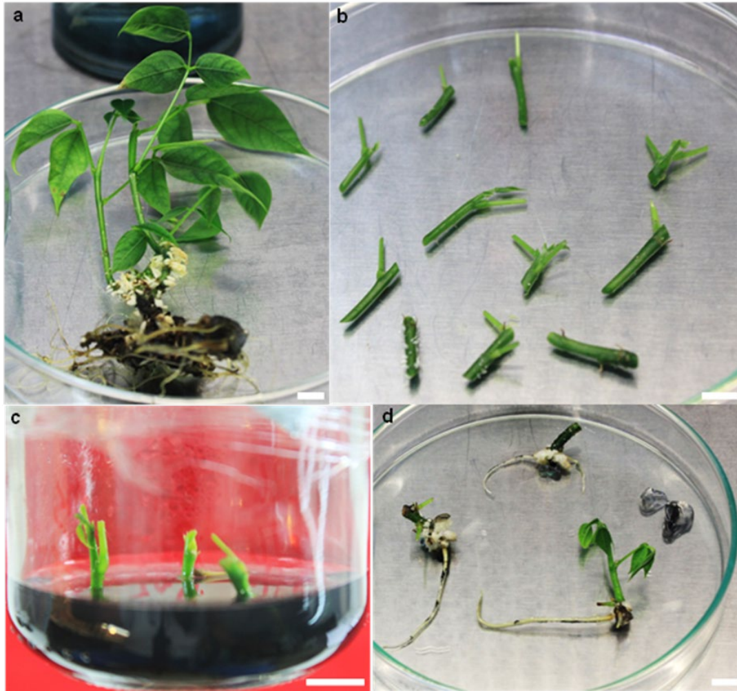
Figura 2. Enraizamiento de segmentos nodales de E. edulis (pajuro): a) plántula donadora de segmentos nodales, b) segmentos nodales con una a dos yemas axilares, c) colocación de los segmentos nodales en medios de enraizamiento, d) segmentos nodales enraizados a la quinta semana de cultivo in vitro . Barra blanca = 1 cm.

En la etapa de aclimatación, la tasa de supervivencia superó el 90 %, indicando claramente que la composición del sustrato Premix brindó condiciones óptimas para que las plántulas tuvieran éxito durante el proceso, obteniendo plantas vigorosas y de buen aspecto fitosanitario (Figura 3c).