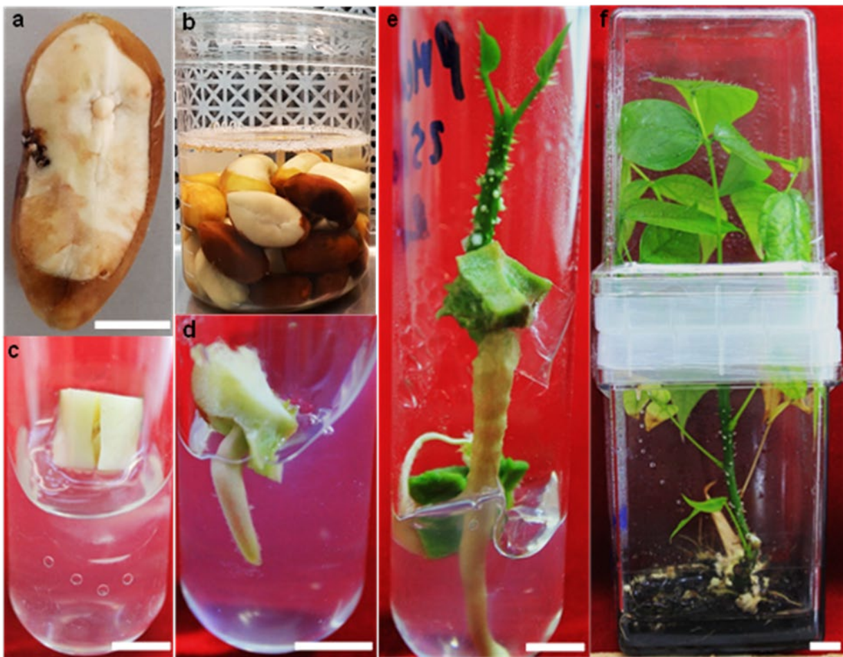
Figura 1. Establecimiento in vitro de los embriones cigóticos de E. edulis (pajuro): a) semilla lavada y desprovista del tegumento en la zona de la radícula del embrión cigótico, b) remojo y desinfección de las semillas, c) embrión cigótico con parte de cotiledones en medio de germinación, d) inicio de la germinación del embrión cigótico a los 15 días de cultivo in vitro , e) crecimiento y desarrollo del embrión cigótico in vitro , f) plántula a las 12 semanas de cultivo en medio de crecimiento y desarrollo. Barra blanca = 1 cm.

El enraizamiento de los segmentos nodales ocurrió entre la cuarta y la quinta semana de cultivo (Figura 2d). El mayor número de raíces (1.8) de 3.2 cm se observó en el 91.7 % de los segmentos nodales al emplear 5 mg.L -1 de AIB, mientras que el uso de 1 y 3 mg.L -1 de AIB y la combinación de 2 mg.L -1 de ANA más 0.5 mg.L -1 de AIB mostraron una respuesta inferior (Figura 3a y 3b). Las raíces adventicias inducidas se caracterizaron por ser gruesas y se originaron en la parte basal del segmento nodal (Figuras 2c y 4a).