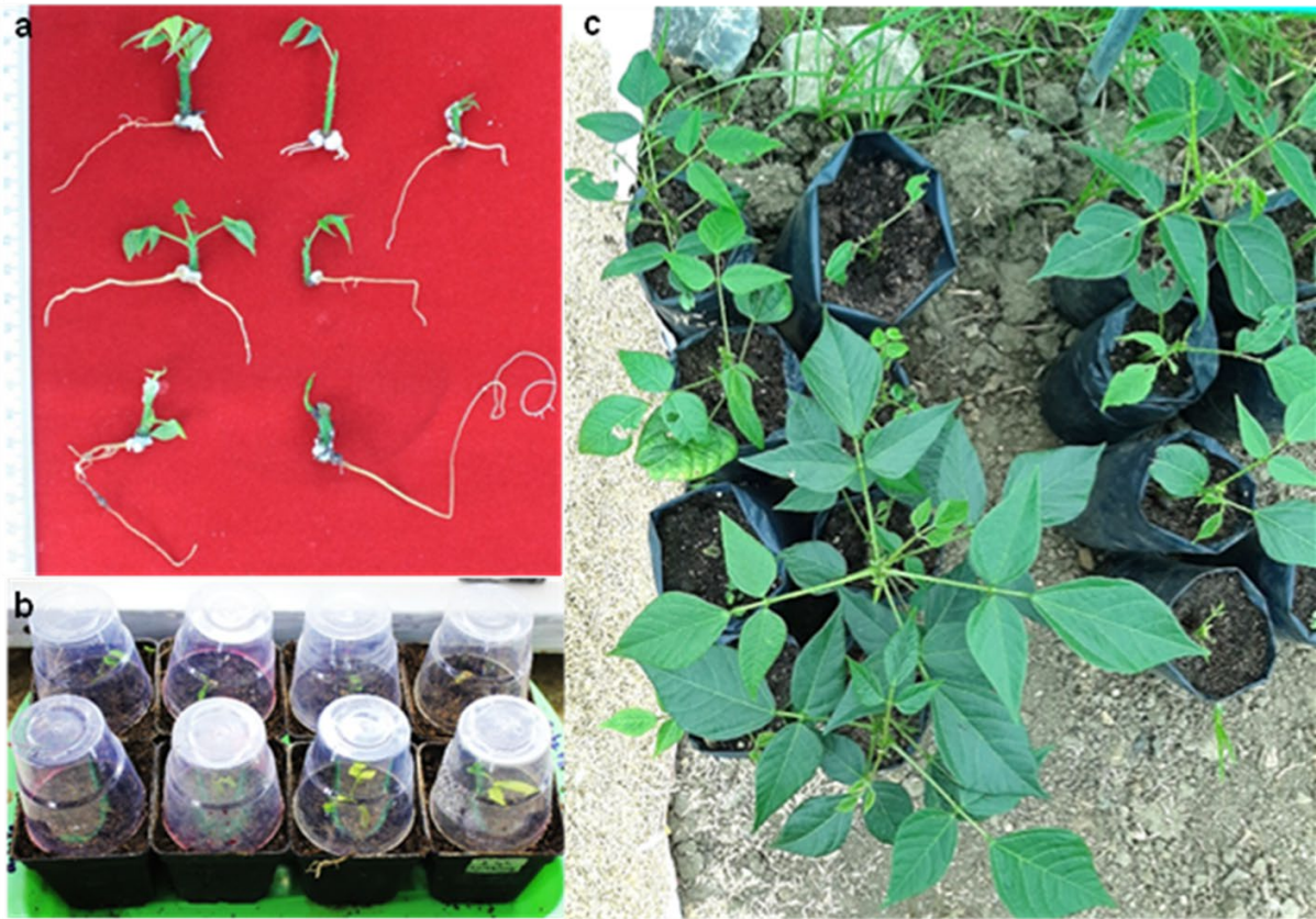
Figura 4. Acclimatación de plántulas de E. edulis (pajuro) propagadas in vitro : a) plántulas enraizadas in vitro , b) acclimatación de plántulas, c) crecimiento y desarrollo de las plántulas en casa malla

minutos. A los 15 días de cultivo in vitro , se observó la emisión de la radícula. Es preciso añadir que, si se utilizaba una menor concentración de lejía comercial (5 %) o un menor tiempo de exposición (15 minutos), las semillas se contaminaban, y, si la concentración excedía el 10 %, el embrión cigótico perdía viabilidad.