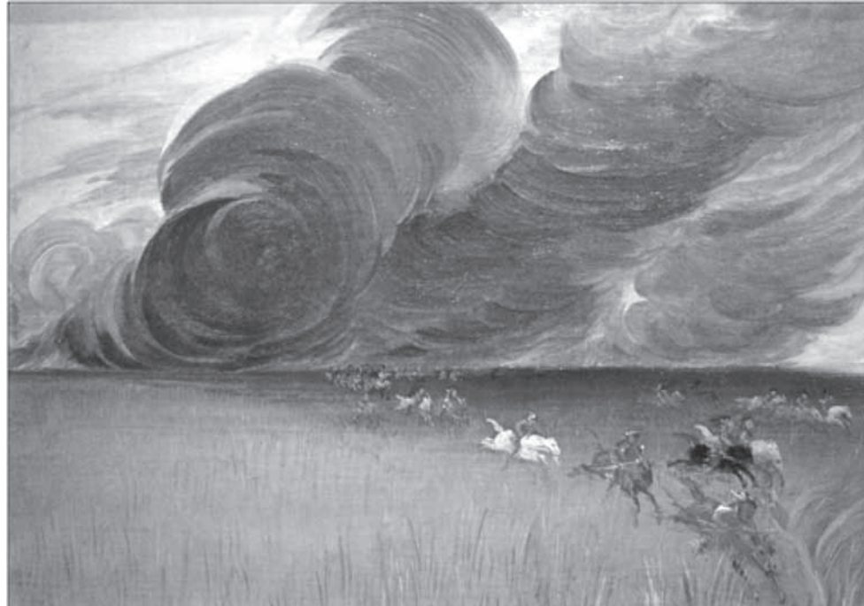
Prairie Meadows Burning, 1832, George Catlin (1796-1872). Smithsonian American Art Museum. Washintong D.C Julio de 2013.