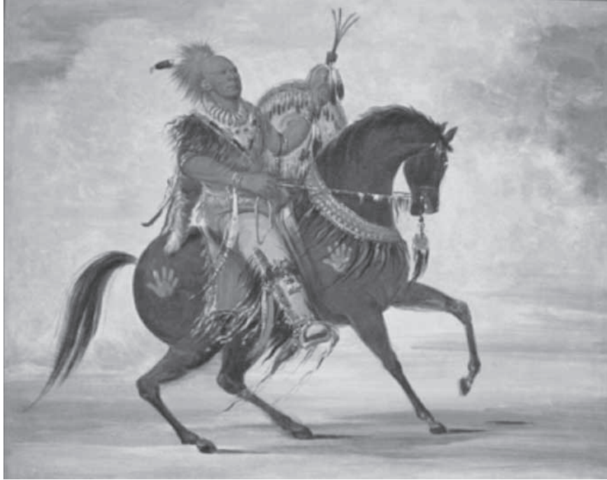
Keokuk, 1835, George Catlin (1796-1872). Smithsonian American Art Museum. Washintong D.C. Julio de 2013.