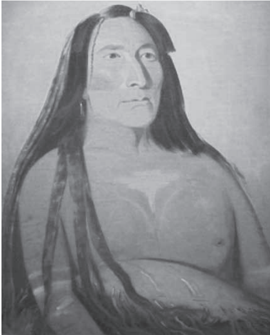
Mäh-to-tóh-pa, Four Bears, Second Chief in Mourning, 1832. George Catlin (1796-1872). Smithsonian American Art Museum. Washintong D.C Julio de 2013.

La diversidad de criterios en la política pública para la definición de quién es indígena y la manera arbitraria con la que se establecen estas categorías se refleja, por ejemplo, en el proceso del censo nacional que basa las estadísticas de raza en la auto-identificación de los encuestados y que incluye en la categoría indígena a los nacidos en centro y Suramérica pero excluye a los nativos de Hawái o las Islas del Pacífico, quienes se cuentan en otra categoría para este ejercicio 13 . El gobierno, para estos efectos, reconoce entonces como indígena a aquel que se autodefine como tal; sin embargo, en las relaciones tribales este criterio ya no es suficiente, dado que eso implica