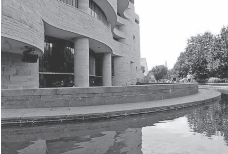
National Museum of The American Indian. Washington D.C, Julio de 2013.

“We got back our worth, our pride, our dignity, our humanity.” (Arengas indias en la toma de Alcatraz, 1968)