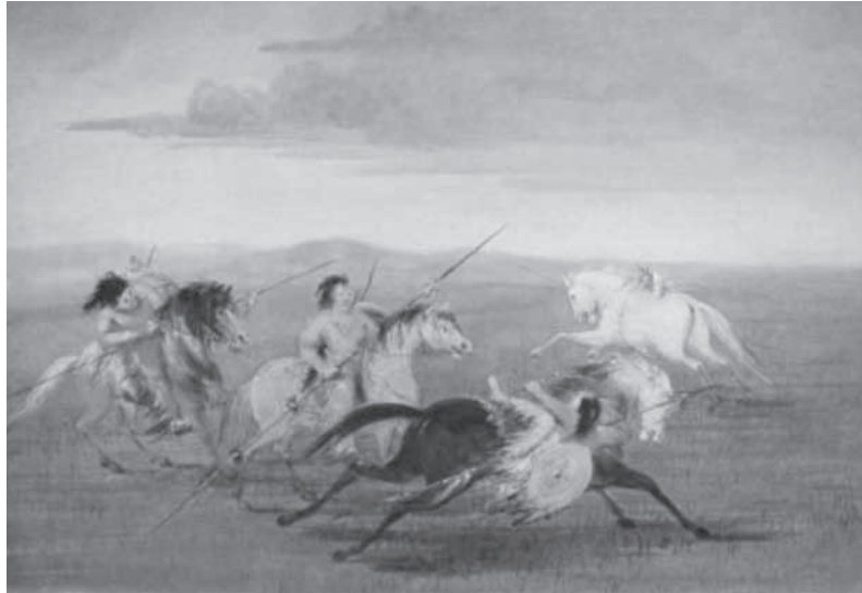
George Catlin (1796-1872). Smithsonian American Art Museum. Washintong D.C Julio de 2013.

ción indígena frente al total es de 18%, seguido por Oklahoma (11%) y Nuevo México (11%). Las tribus con mayor población son los Cherokee (331.493), Navajo (230.401) y las tribus nativas de Alaska (89.462) (Information Please, 2000-2013).