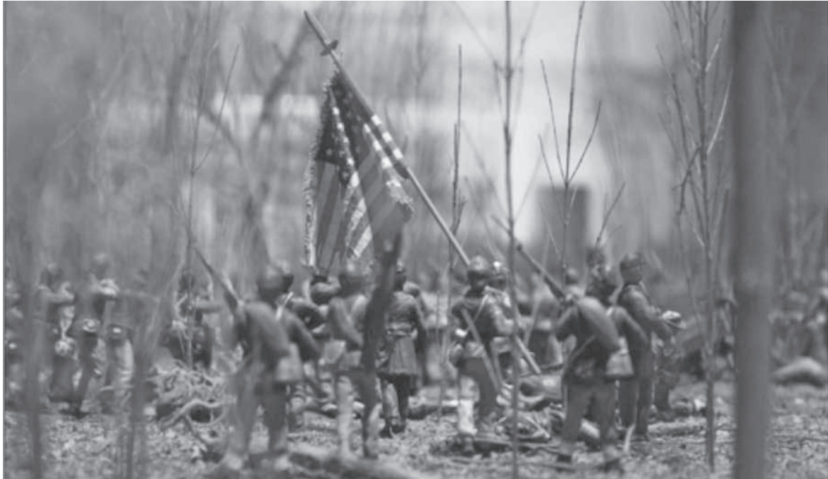
The National Civil War Museum. Harrisburg (Pensilvania). Ejércitos de la Unión.

en el territorio de Estados Unidos, durante el transcurso del siglo XIX no se les otorgaría ciudadanía a los indígenas, aunque estos hubieran formado parte de los ejércitos de la Unión durante la Guerra Civil. Esta enmienda, posterior a la cruenta Guerra de Secesión que causó más de 750.000 víctimas (BBC Mundo, 2012), amplió por lo menos de manera formal la posibilidad de naturalización, ciudadanía y, por lo tanto, los derechos constitucionales a los esclavos negros y sus descendientes, pero no a los nativos americanos.