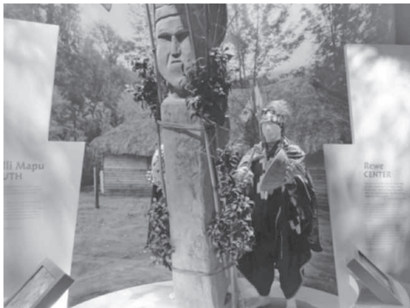
National Museum of The American Indian. Washington D.C, Julio de 2013

Post 6 son célebres por señalar las debilidades del museo el mismo día de su apertura. Ambos textos coinciden en la falta de coherencia y perspectiva histórica de la puesta en escena del museo, la colección de objetos de muchas procedencias sin un pegamento narrativo lo suficientemente fuerte para crear una unidad explicativa y un recuento coherente sobre los indígenas en la conformación de Estados Unidos: “No se hace un esfuerzo por trazar la evolución de los indígenas desde sus siglos de existencia por sí solos en esta tierra a su lugar actual en las reservas y entre el resto de nosotros” (Fisher, 2004, p. 45).