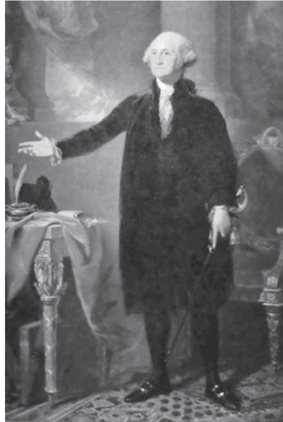
George Washington. Smithsonian American Art Museum. Washington, D.C. Julio de 2013.

En este contexto se ha desarrollado la política federal sobre los indígenas, las relaciones con los blancos, y las propias dinámicas internas de las tribus. Las relaciones indígenas-gobierno, siguiendo a Singletary & Emm (2011), se pueden comprender desde la siguiente periodización: el tiempo de la Trade an