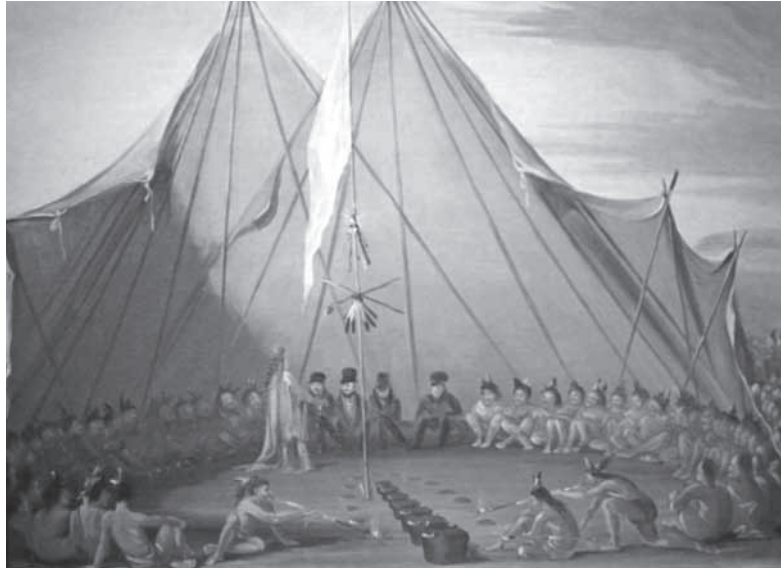
Sioux Dog Feast, 1832–37. Western Sioux/Lakota. George Catlin (1796–1872). Smithsonian American Art Museum. Washintong D.C Julio de 2013.