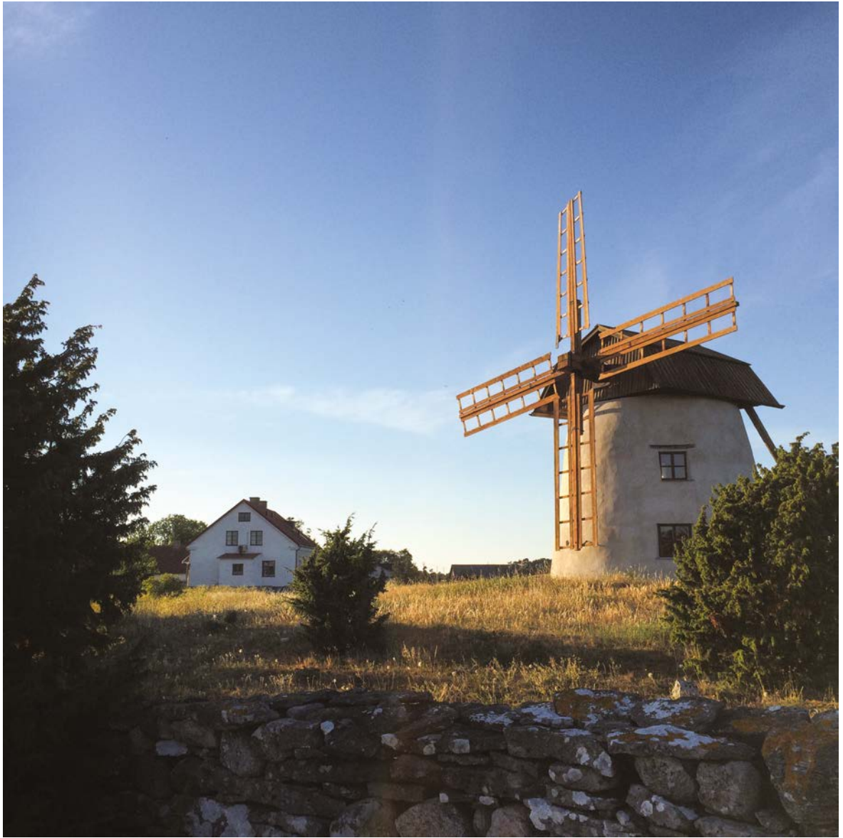
Imagen 11. Casas y molino de Ingmar Bergman en Dämba, Fårö.