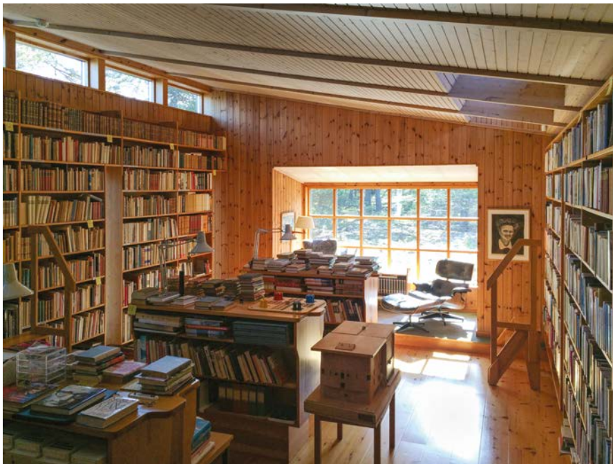
Imagen 3. Biblioteca de Ingmar Bergman en Fårö.