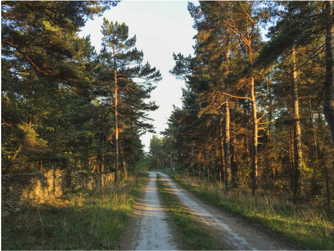
imagen 4. Carretera oculta que conduce a la casa de Ingmar Bergman en Hammars, Fårö.