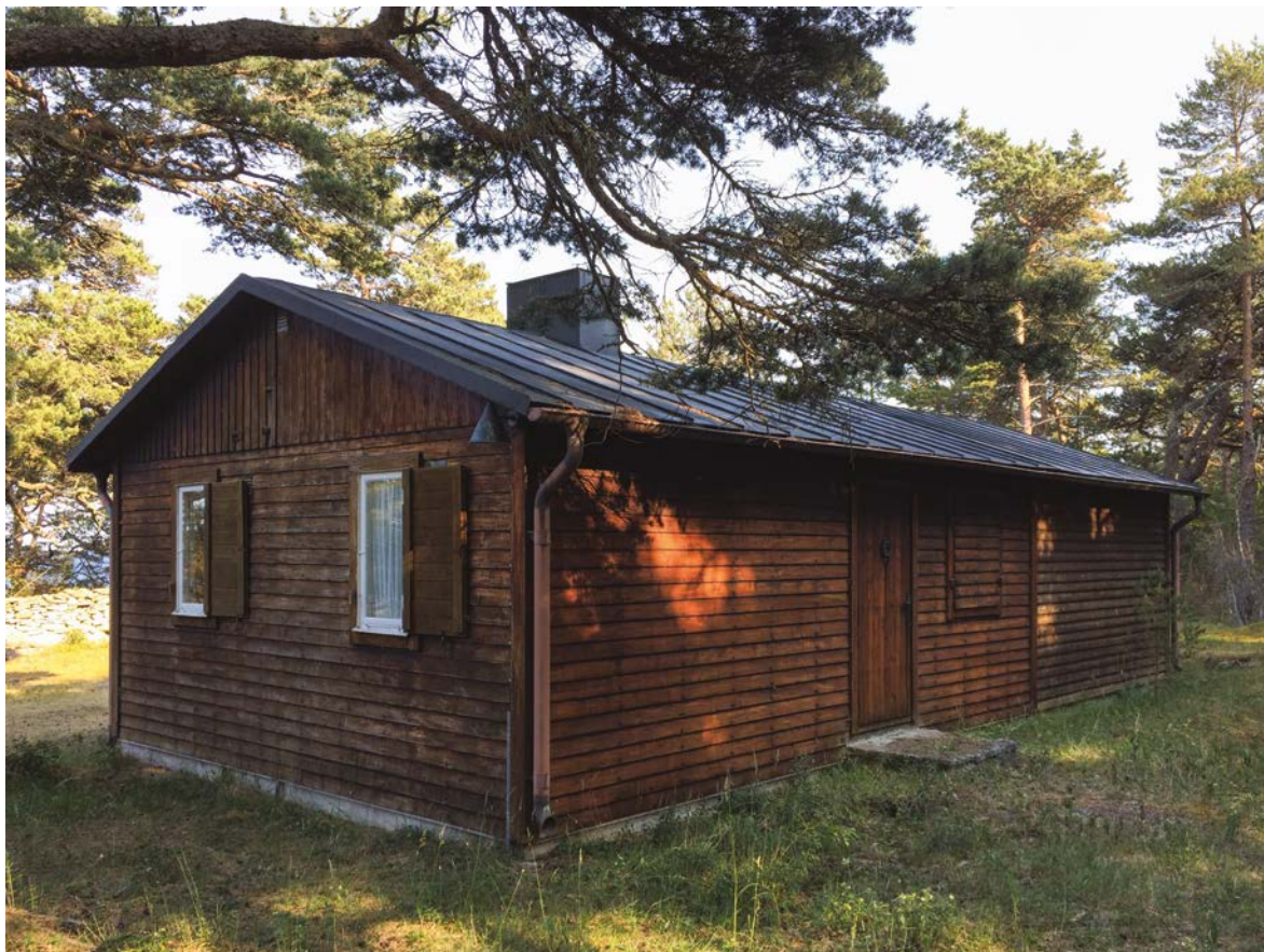
Imagen 10. Skrivstugan, "la cabaña del escritor", a unos metros de la casa de Bergman en Fårö y donde fue filmada ESCENAS DE LA VIDA CONYUGAL (1974).