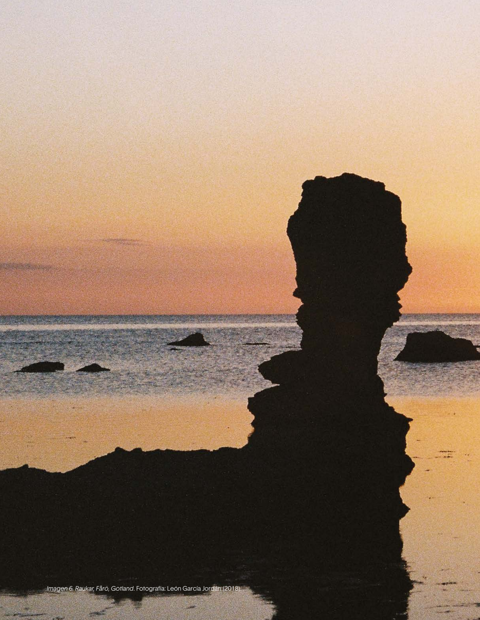
Imagen 6. Raukar, Fårö, Gotland.