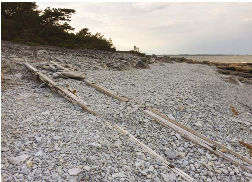
Imagen 9. Vestigios de travelling del rodaje de PERSONA (1966).

El suelo que acoge los restos de la última esposa del maestro y los huesos invencibles del creador de En presencia de un payaso , se presentan como una sorpresa discreta, íntima, adicional, para todos aquellos que van a Fårö, como aquel que sigue el camino de Santiago.