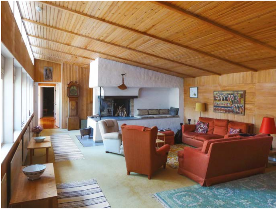
Imagen 2. Salón de Ingmar Bergman con su célebre chimenea de inspiración rusa.