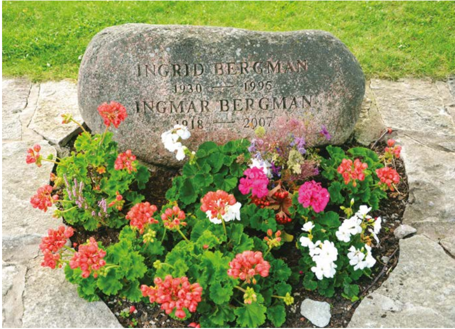
Imagen 7. Tumba de Ingmar Bergman y de su mujer Ingrid von Rosen, en el cementerio de Fårö. Fotografía: León García Jordán (2018).