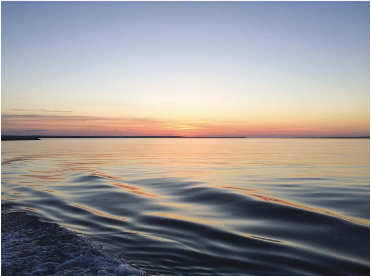
Imagen 5. Vista desde el Ferry que conduce de Fårösund a la isla de Fårö.

dejan la sospecha de que no se está solo en este mundo sin Bergman. No hay hoteles a la vista. Así que el visitante debe asegurarse de conseguir una vivienda alquilada entre los lugareños y saber convivir con la solitaria simpatía de todos aquellos que se encargan de mantener a flote la barca del cine. Al contrario de lo que sucede en La pasión de Ana , no parece haber desquiciados en la isla. Por lo menos no se vislumbran en el helado verano sueco de sus playas. Sin embargo, para todo aquel que proviene de otros climas, no deja de ruborizar la idea de tener que vivir allí los inviernos de noches eternas y temperaturas que compiten con las de los extremos más bajos de la Tierra. La locura se instala en todo aquel que se imagina las frías y solitarias noches de Bergman a sus 89 años en Fårö.