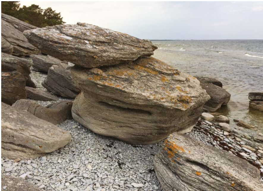
Imagen 1. Playa de Fårö donde fue filmada COMO EN UN ESPEJO (1960).

billete de 200 coronas, sino concentrando las principales actividades en el microcosmos del genio: Fårö (la isla de los corderos). Fue allí, comenzando la década del 60, donde Ingmar Bergman descubrió su paraíso. Buscando locaciones para su película Como en un espejo , se encontró, en la mitad del mar Báltico, un territorio que se convertiría en su morada hasta el fin de sus días y en el territorio de cinco películas, dos documentales y una serie de televisión que paralizó su país y luego se introdujo en el mundo por las vías de las salas de cine: Escenas de la vida conyugal . La saga creativa en Fårö es, quizás, una mínima parte en la producción de un maestro absoluto que realizó cerca de 60 largometrajes, 125 obras de teatro mal contadas, programas de radio, versiones para televisión y una buena cantidad de libros que consolidaron su viejo anhelo de convertirse en escritor. La obra de Bergman es descomunal tanto en calidad como en cantidad y su nombre es un referente inmediato para todos los amantes del llamado "cine de autor". Pero lo que sucedió en Fårö no tiene comparación. Sin saberlo, los largometrajes realizados en su isla sagrada (la citada Como en un espejo , Persona , Vergüenza , La hora del lobo , La pasión de Ana ) se convertirían en la consolidación de un estilo y en