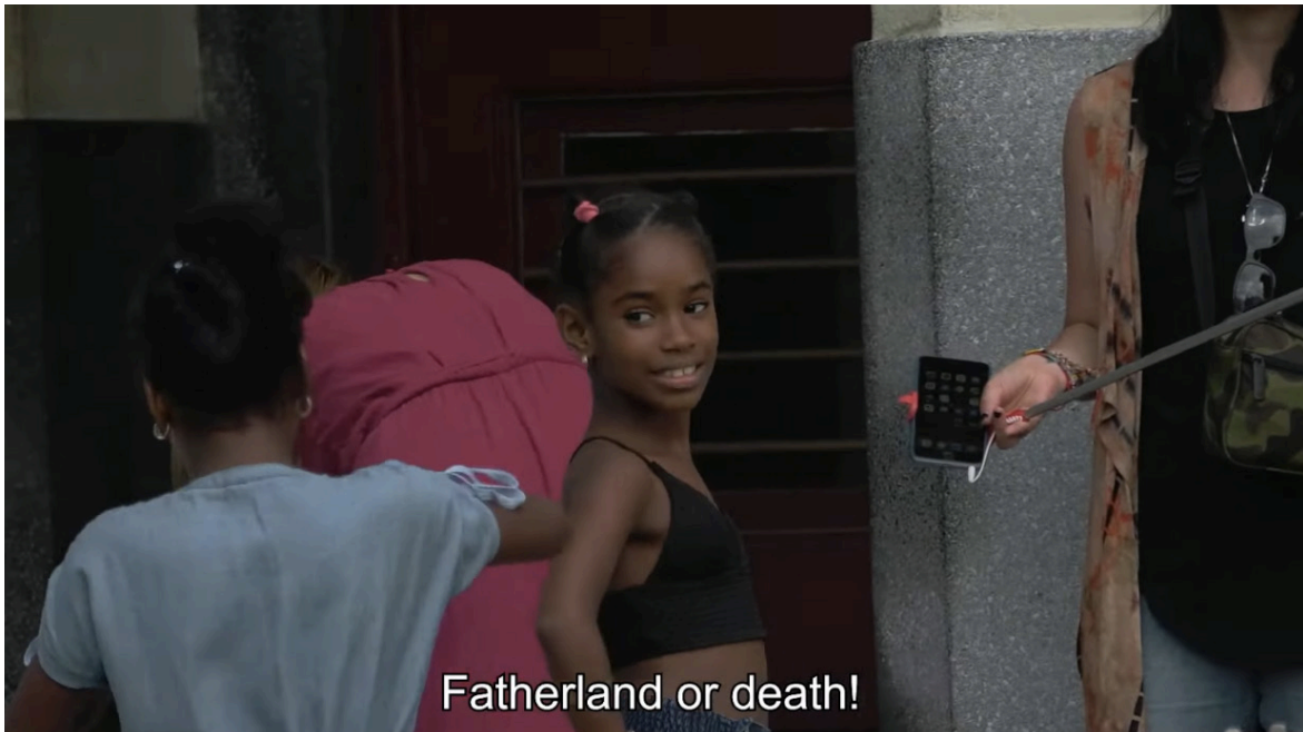
Imagen 13. Fotograma de Epicentro (2020). «Patria o muerte». Captura de pantalla.