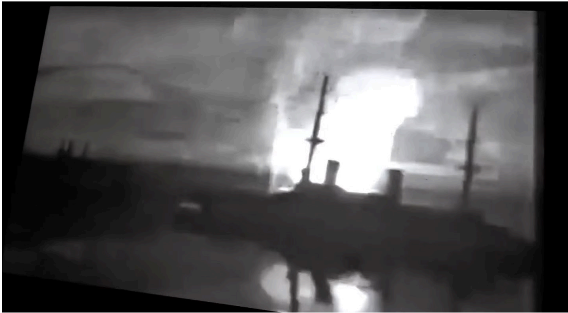
Imagen 4. Fotograma de Epicentro (2020). Captura de pantalla.