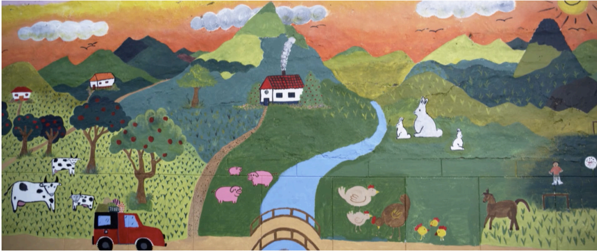
Imagen 24. Fotograma de Los colores de la montaña (2010). Captura de pantalla.