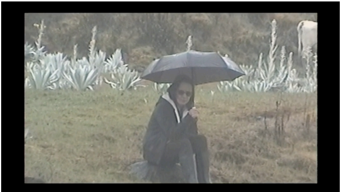
Imagen 9. Fotograma de Pirotecnia (2019). Captura de pantalla.