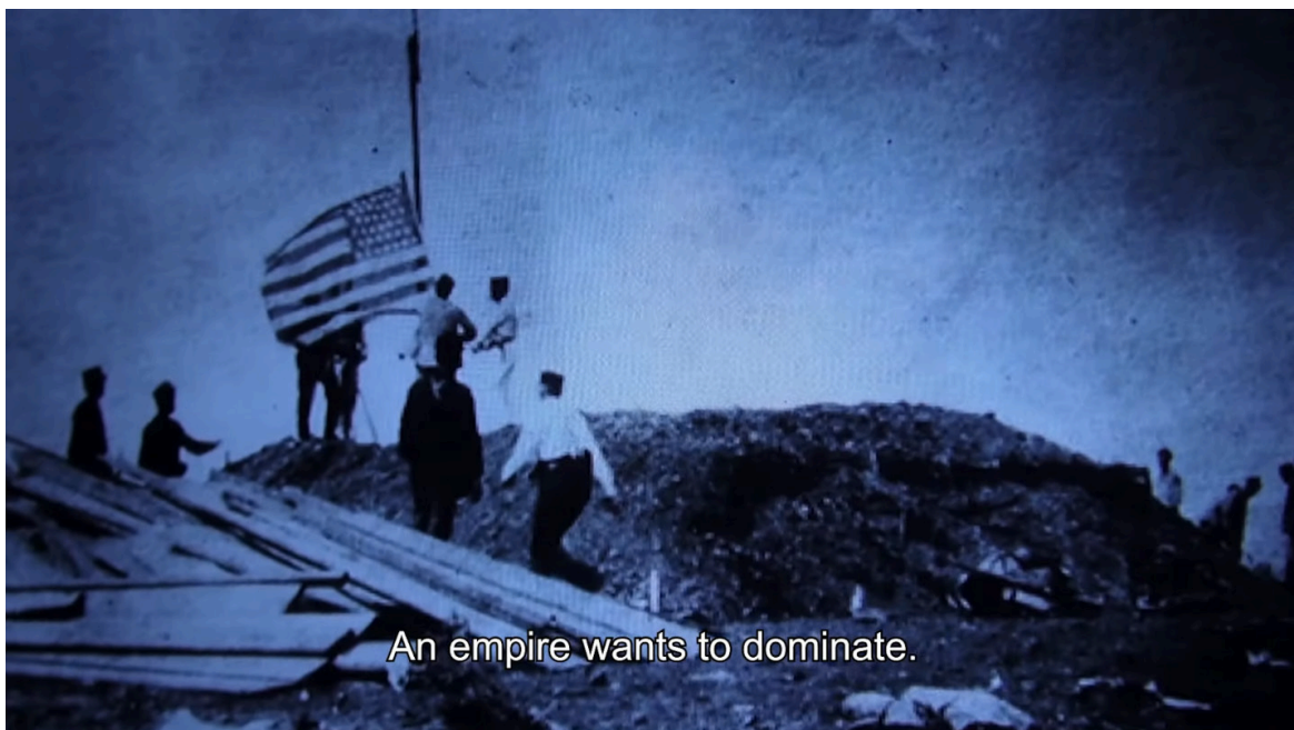
Imagen 3. Fotograma de Epicentro (2020). «Un imperio quiere dominar». Captura de pantalla.

nos dicen que son los mares cubanos»: el efecto parece el mismo si solo vemos un barco que desaparece cuando el agua salta y acompañamos la imagen con unas determinadas palabras, aunque a veces ni siquiera faltan estas. El austriaco habla con un hombre quien le cuenta de la ocasión en que cuando era niño su padre vio una grabación de él. En ella se veía que otro niño corría en medio de un terreno donde polvo y tierra volaban como si salieran de una explosión; en ese entonces el padre —recuerda su hijo ya adulto— preguntó: “¿y de dónde sacaron explosivos ustedes?!”. Como se puede hacer saltar el agua, se puede hacer saltar algo de tierra. Los artificios cinematográficos han hecho historia.