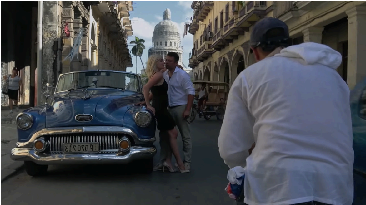
Imagen 12. Fotograma de Epicentro (2020). Captura de pantalla.