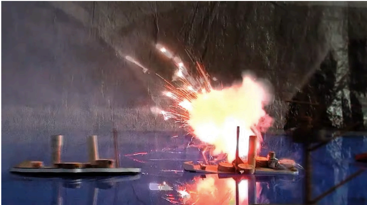
Imagen 5. Fotograma de Epicentro (2020). Captura de pantalla.