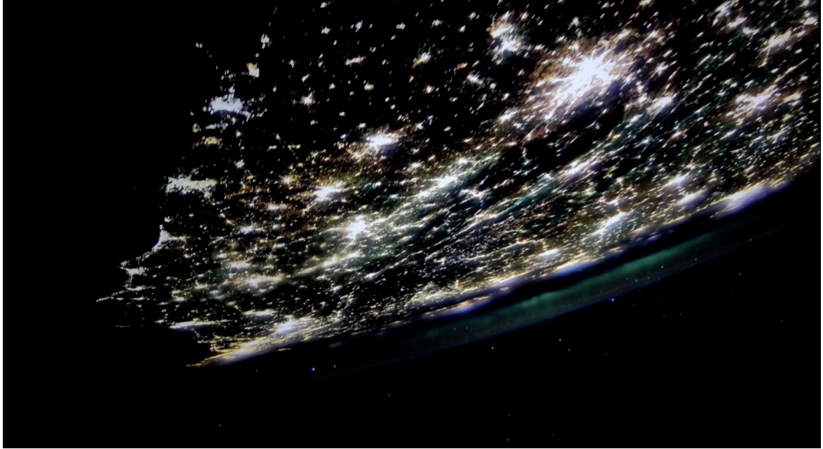
Imagen 26. Fotograma de Epicentro (2020). Captura de pantalla.

aspectos se expresan en los filmes que hemos visitado. Al abordar el afuera y las imágenes nos confrontamos a nosotros mismos.