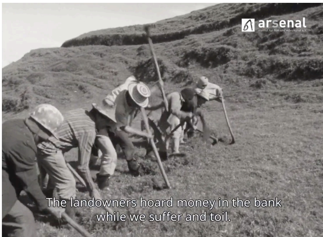
Imagen 17. Fotograma de Nuestra voz de tierra, memoria y futuro (1982), restauración de Arsenal - Institute for Film and Video Art E.V. «Los terratenientes tienen plata amontonada en el banco mientras uno pasa necesidades». Captura de pantalla.