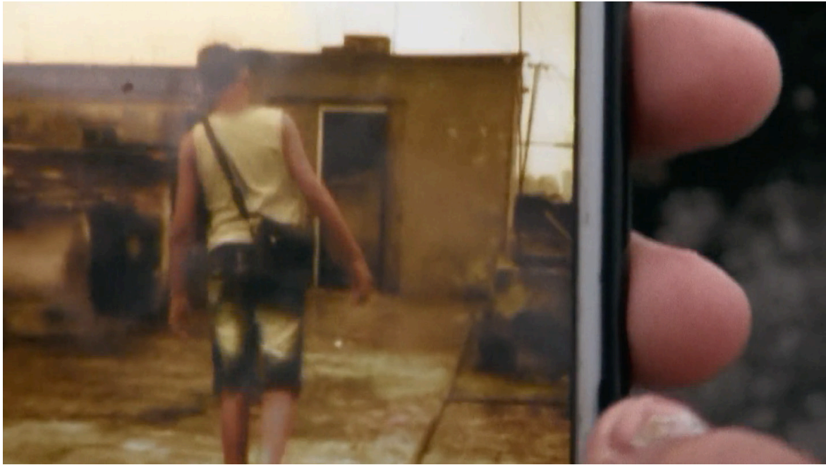
Imagen 22. Fotograma de Epicentro (2020). Captura de pantalla.