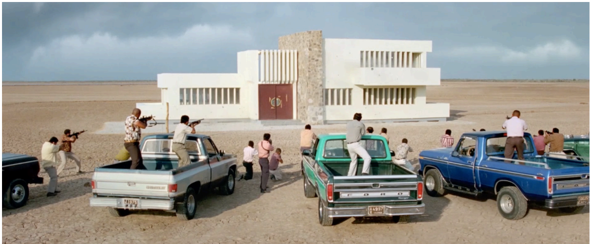
Imagen 19. Fotograma de Pájaros de verano (2018). Captura de pantalla.

puestas en cómo hacer para que ese gusto creado, y por tanto no natural, no se momifique o quede detenido y cristalizado en unas relaciones que sí considero que tienen trazas coloniales y en las que, a pesar de la hibridez y movilidad que pueda caracterizar a estos espacios liminales, hay asimetrías de poder en las que la conjunción del poder económico y político se traslada a la cultura. (2020, Cinestesia)