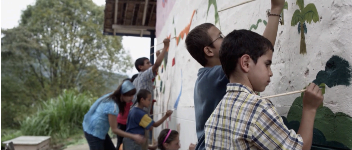
Imagen 25. Fotograma de Los colores de la montaña (2010). Captura de pantalla.