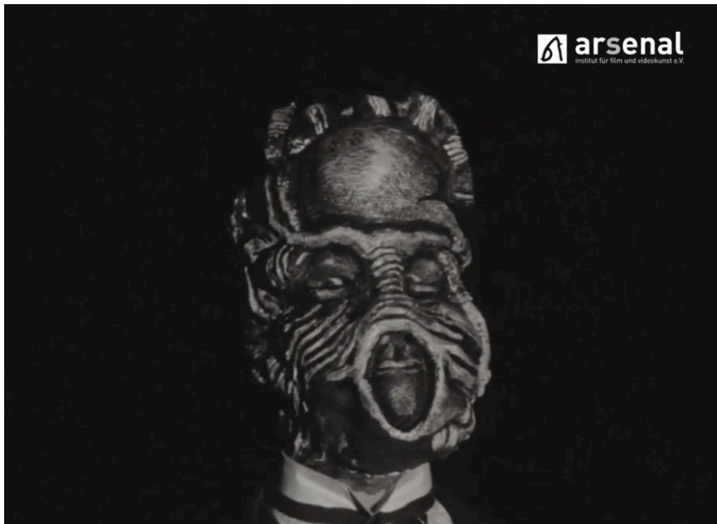
Imagen 16. Fotograma de Nuestra voz de tierra, memoria y futuro (1982), restauración de Arsenal - Institute for Film and Video Art E.V. Captura de pantalla.