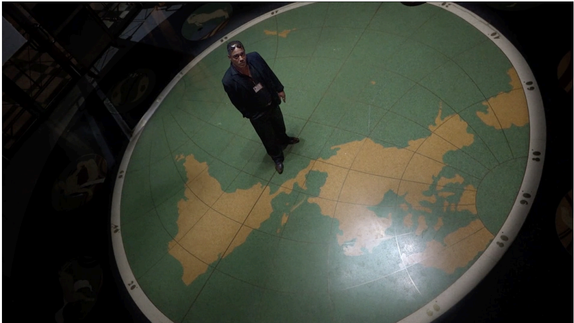
Imagen 1. Fotograma de Epicentro (2020). Captura de pantalla.

Desde hace algo más de cien años la mayoría de pueblos e individuos del mundo han vivido sus experiencias espacio-temporales a través de las hipnóticas imágenes cinematográficas que son posibles por una máquina de una modernidad [asimétrica]: el cinematógrafo. Esto nos dice Hubert Sauper al inicio de su película Epicentro (2020). En ella nos encontramos con el austriaco que hacia el año 2016 estaba en La Habana, Cuba. Allí, se ha hecho del cine un epicentro y el cine, entre otras cosas, también ha hecho de uno a la Isla . Entre estos dos se han producido relaciones «epicéntricas» como puntos de muy alta intensidad en lo que podrían ser, si las vemos gráficamente, las líneas de los terremotos de la historia, una historia múltiple que también es la(s) historia(s) de las imágenes en movimiento. Son historias e imágenes construidas, asimétricamente, entre los nativos de la Isla y los extranjeros. Sin ellas es probable que el mundo no sería lo que es y ha sido desde que se toparon.