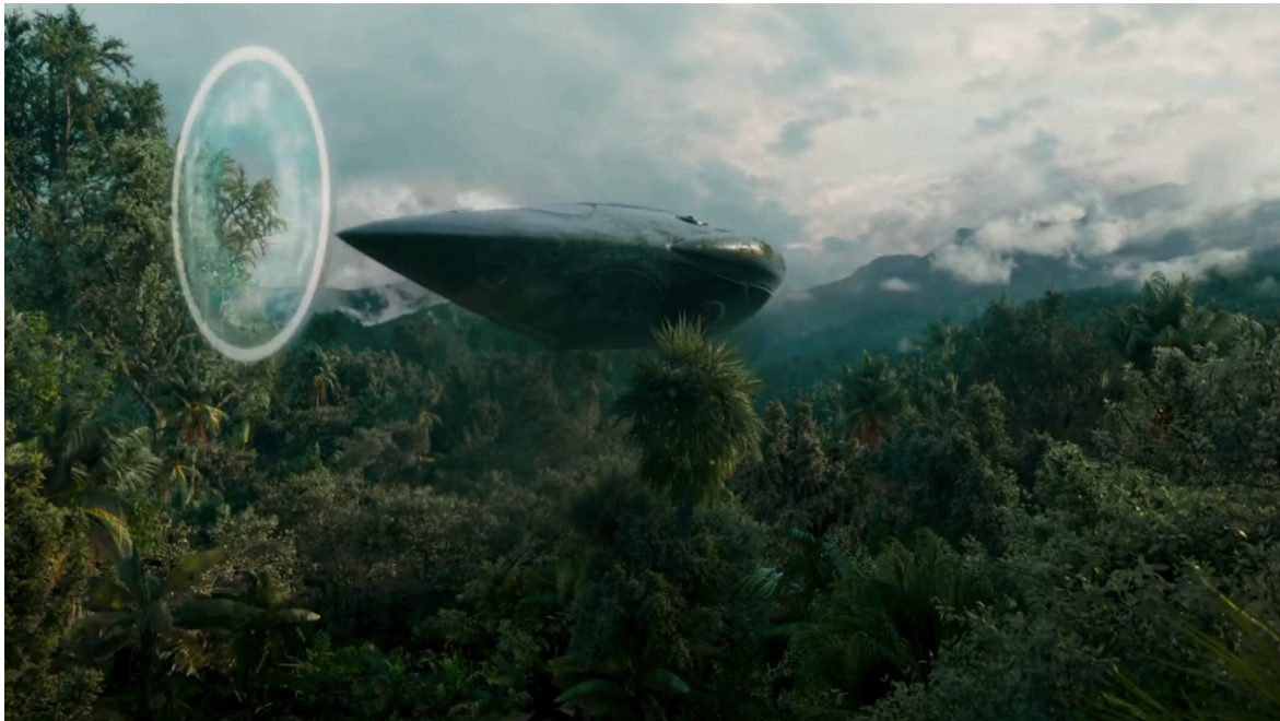
Imagen 11. Fotograma de Memoria (2021). Captura de pantalla.