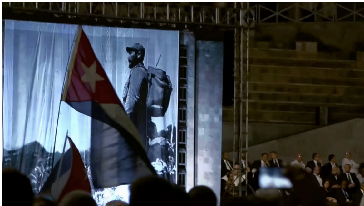
Imagen 14. Fotograma de Epicentro (2020). Captura de pantalla.

Estas consecuencias nacen, me parece, dadas unas tensiones. Tensiones entre imágenes por sus usos capitalistas, comunistas y, quizás uno más, uno que no tiene origen en el extranjero. El logro del director puede descansar no solo en que nos permite ver estas tensiones imaginarias y reales, sino que su mismo «hacer la película» inscrito en las susodichas