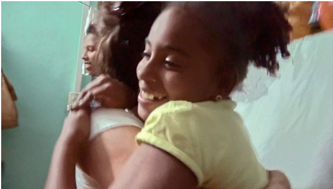
Imagen 21. Fotograma de Epicentro (2020). Captura de pantalla.