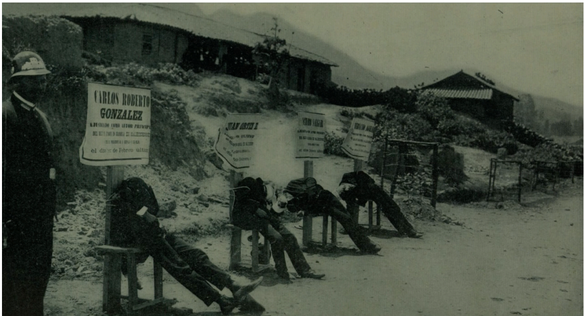
Imagen 6. Fotograma de Pirotecnia (2019). Captura de pantalla.

La película inicia retomando archivo fotográfico en torno al atentado del 10 de febrero de 1906 contra el entonces presidente Rafael Reyes. Tras dicho atentado se fusilaron a los criminales. La voz en off del director en la película entonces nos cuenta que: