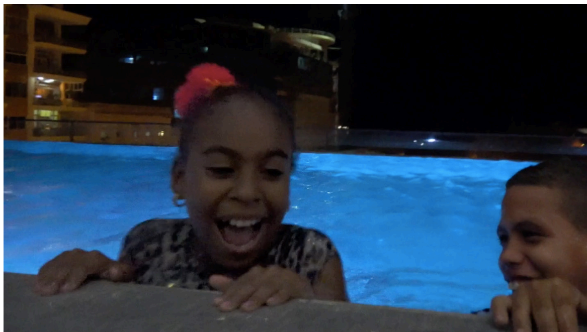
Imagen 15. Fotograma de Epicentro (2020). Captura de pantalla.

tensiones puede ser ejemplo de otras imágenes que, junto a los cubanos en cuestión y las imágenes que ellos ven, consisten en nuevas ficciones. Unas más bien cargadas de algo maravilloso aún cuando es precario y hostil, de un asombro que se erige en forma de conocimiento del mundo que, quizás como deseo sensible y poético, no uniforma la percepción y vivencia de las experiencias. Se trata acaso de otra manera de imaginar y crear diferente a las de los proyectos europeos que no está en función de la burocracia estatal o del sistema mercantil.