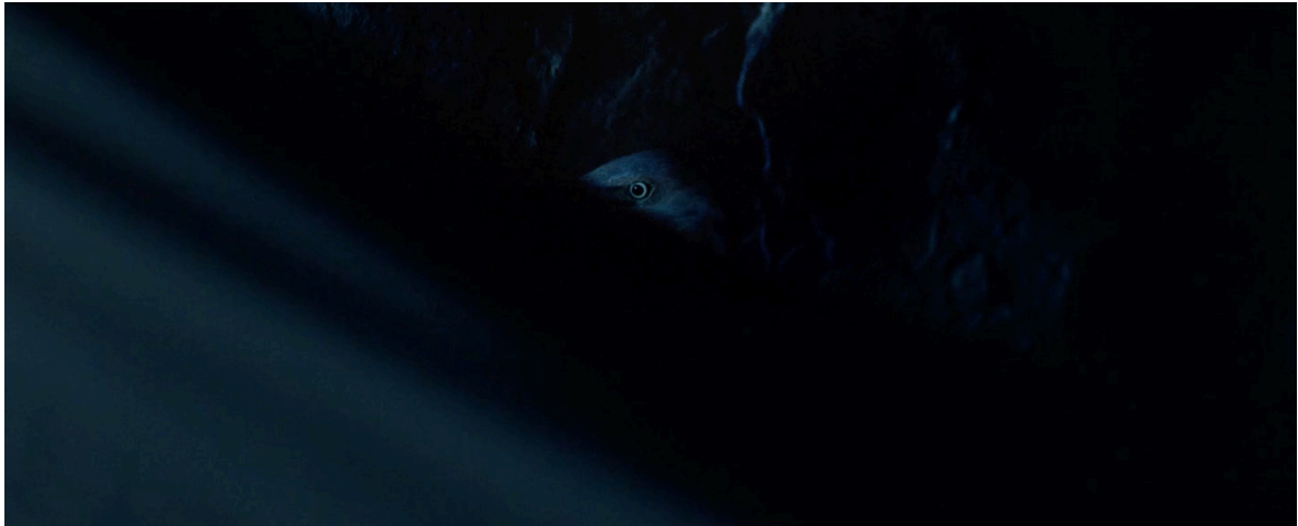
Imagen 18. Fotograma de Pájaros de verano (2018). Captura de pantalla.