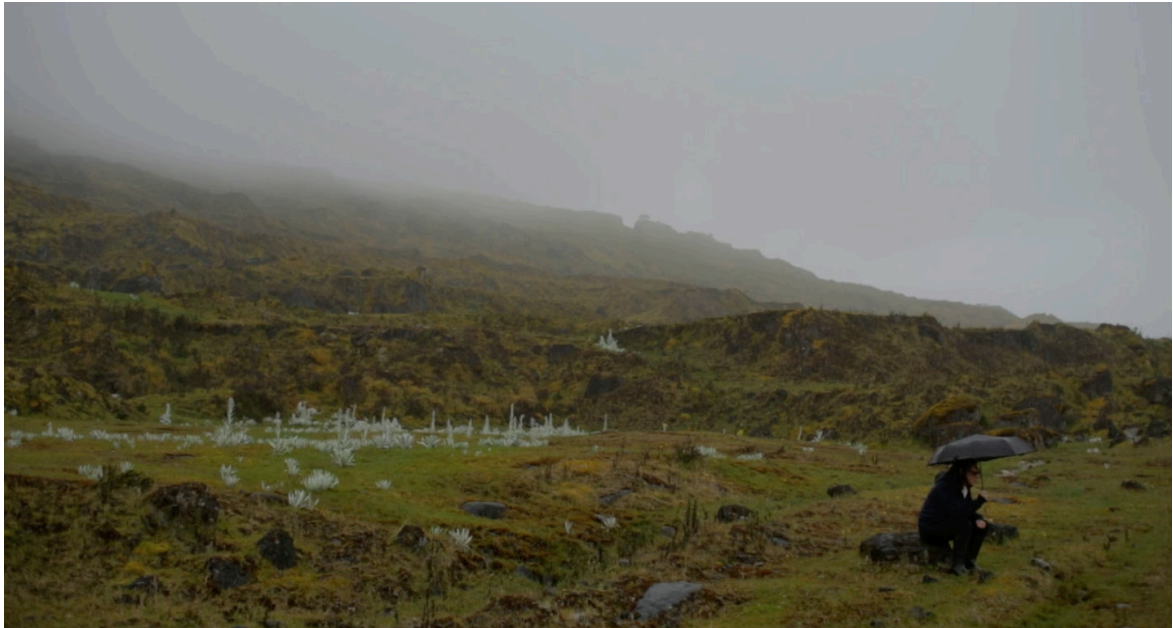
Imagen 8. Fotograma de Pirotecnia (2019). Captura de pantalla.