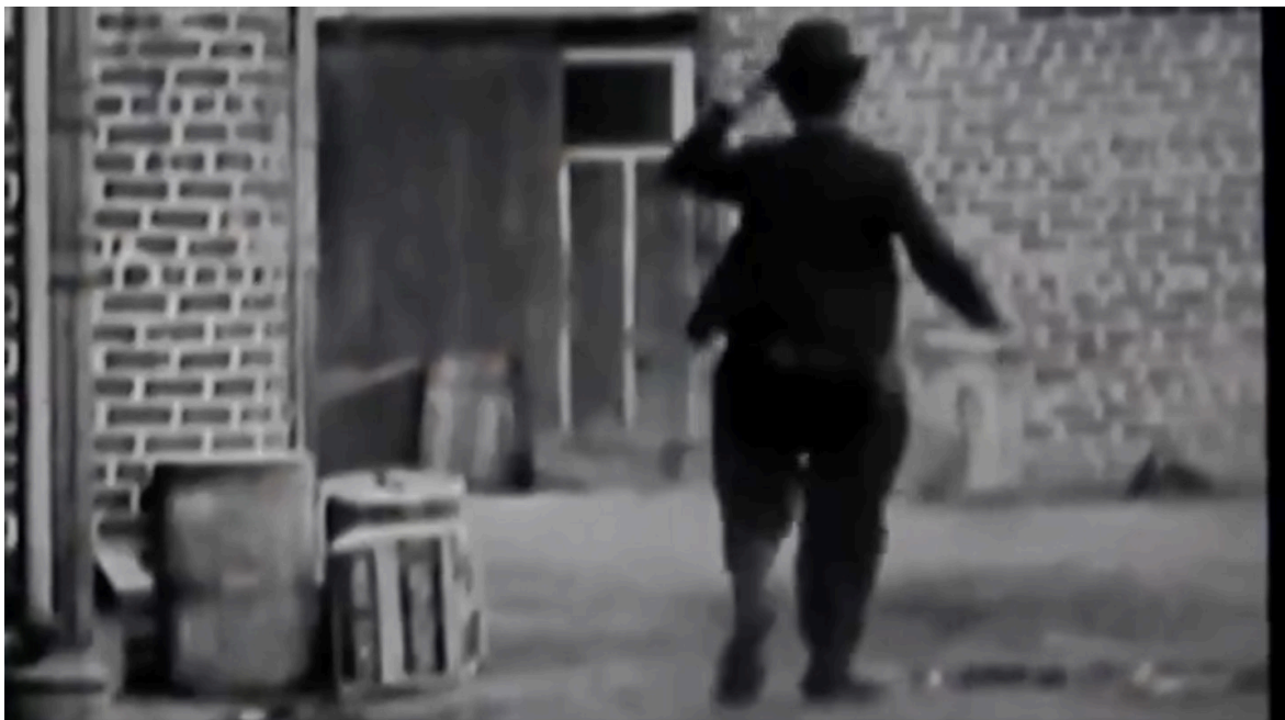
Imagen 23. Fotograma de Epicentro (2020). Captura de pantalla.