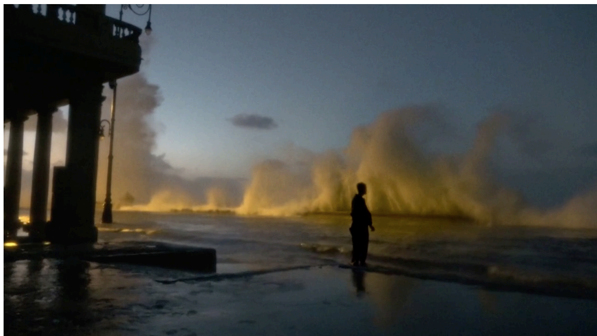
Imagen 2. Fotograma de Epicentro (2020). Captura de pantalla.

El cine ha hecho parte de la historia de violencia de Cuba, una historia que podemos ver como un fluido informe de imágenes cuya fuerza todavía golpea las playas de la Isla a la manera de una ola que viene, crece, se va y decrece irregularmente en el tiempo. Vemos y escuchamos olas feroces, intimidantes, estruendosas, como productos de una explosión: así inicia la película. Sentimos una fuerza de otro tiempo que llega a la playa y recordamos que en esas aguas hubo una explosión; o nos golpea en la pantalla y con su sonido estruendoso pensamos, tal vez imaginamos, que a lo mejor la explosión fue producida como una imagen audiovisual. La ola nos conmueve y nos interpela. Sauper vuelve sobre el archivo de la grabación de «la explosión del barco USS Maine en los mares cubanos», o podría llamarse «la simulación de una explosión con un barco en miniatura en una bañera llena de agua que