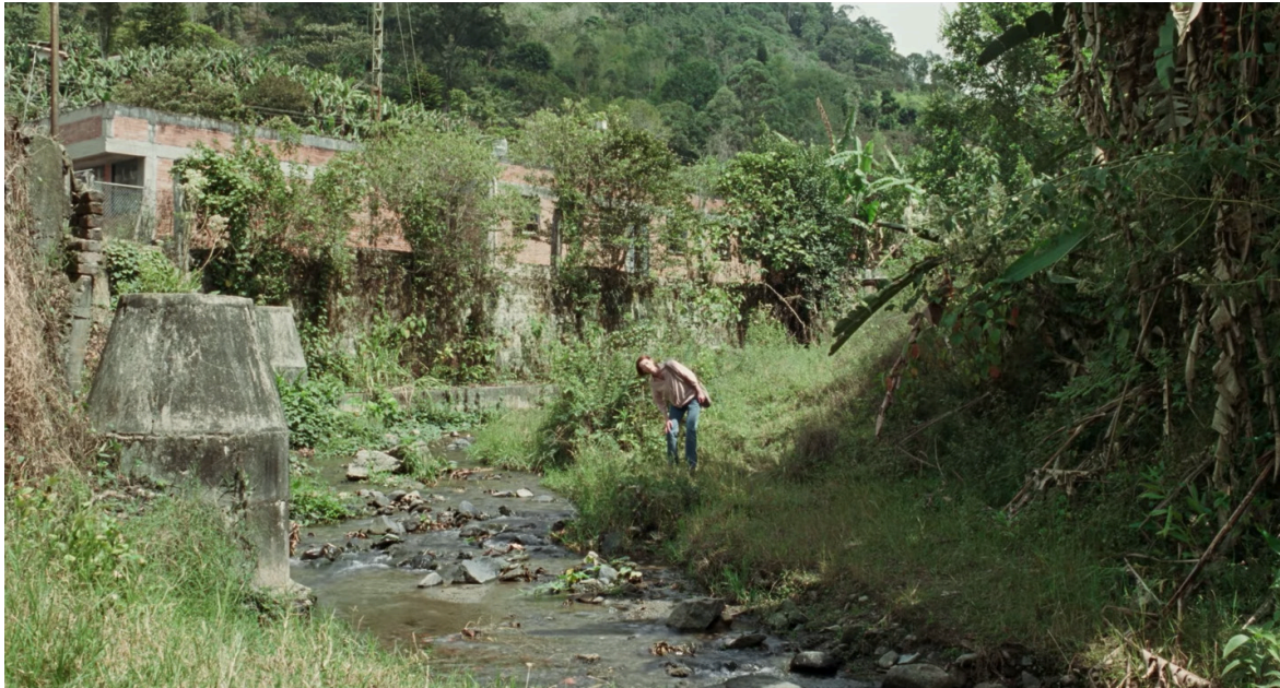
Imagen 10. Fotograma de Memoria (2021). Captura de pantalla.