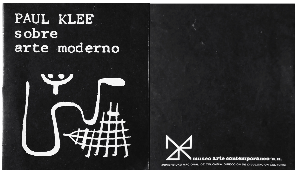
Imagen 5. Portada y contraportada del catálogo Paul Klee sobre arte moderno (1973). Publicado por el Museo de Arte de la Universidad Nacional.

autorizada y la puso de su lado, lo que enojó a otros críticos, entre ellos al propio Rubiano, como veremos más adelante. A pesar de sus evidentes logros, traducidos en una muestra que supo entender y exhibir potentemente a los nuevos artistas colombianos, la Bienal fue criticada. En uno de sus más amargos artículos, "Primera Bienal de Bogotá, ¿corriente de aire fresco?", Rubiano llamó a la presentación de la Bienal "gárrula y falaz", y a las obras reunidas