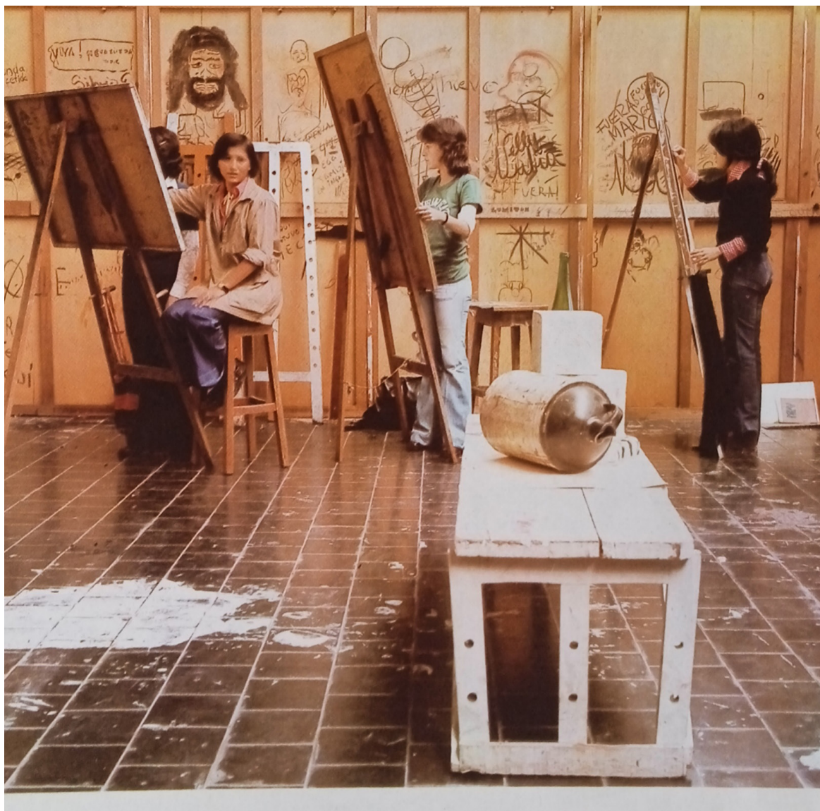
Imagen 6. Escuela de Bellas Artes de la Universidad Nacional (1975).

¿Y cuál fue la reacción del público? La normal. La gente se sintió desconcertada ante tantas novedades y ante tantas cosas que difícilmente se pueden entender como arte. Se siente agredida ante tanta violencia, ante tanta distorsión y ante tanta chabacanería. Y, finalmente, incapaz de entender o poder acceder a los significados de muchas de las obras expuestas. Sentimientos normales porque el público en general siempre está rezagado con respecto a las actividades de