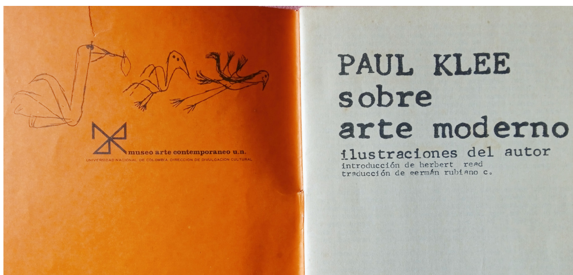
Imagen 4. Páginas interiores del del catálogo Paul Klee sobre arte moderno (1973). Publicado por el Museo de Arte de la Universidad Nacional

primera vez en años, la guerra tocaba las puertas del arte. Así lo testificó Rubiano: