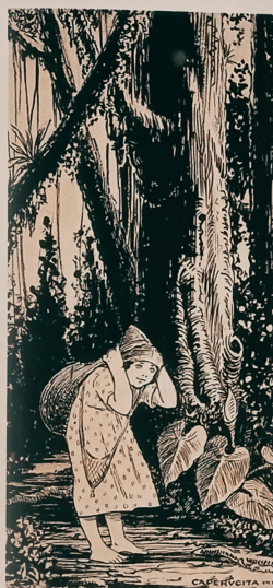
"Caperucita", caricatura de Ricardo Rendón. A la derecha, "La lucha es larga, comencemos ya", del Taller 4 Rojo (D. Arango y N. Zárate).

Herbert Read recordó en El significado del Arte cómo el arte y la religión emergieron de la mano desde la época prehistórica. Durante muchos siglos su vinculación –en todas las diversas civilizaciones– pareció indisoluble. Sin embargo, desde el Renacimiento, hace cinco siglos, se presentaron los primeros síntomas de separación. El arte creado por un individuo –cada vez más apreciado y tenido en cuenta–, con el objeto exclusivo de no expresar sino su personalidad, terminó por imponerse. Desde ese momento, el arte y la religión han seguido caminos diferentes.