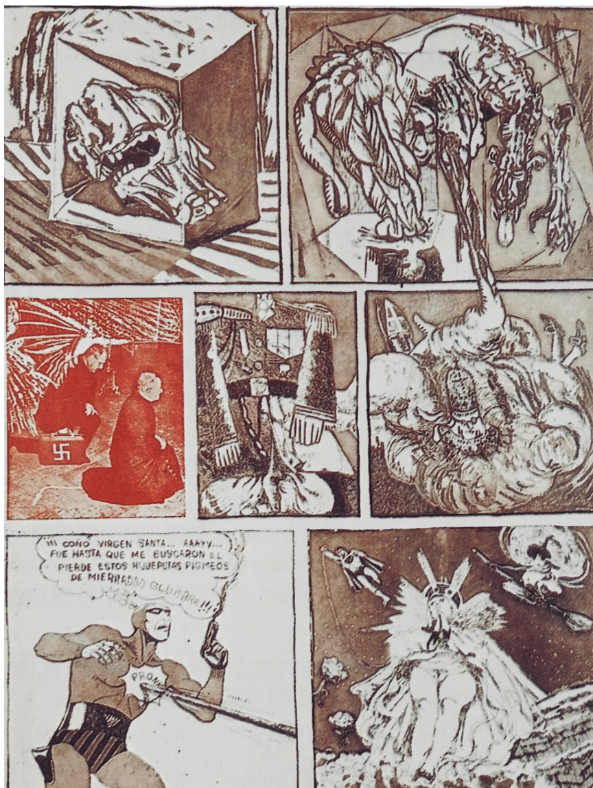
Imagen 7. Augusto Rendón. "mitos y monstruos" (1971). Publicada en la Enciclopedia Salvat de Arte Colombiano en 1975.

y sin duda fue fundamental para enriquecer su vida académica. Allí contribuyó a la creación del Instituto de Investigaciones Estéticas (IIE) en la Facultad de Artes, el cual dirigió y donde sin duda se encontraban los más serios historiadores del arte en Colombia de fines del Siglo XX. Y allí, como se ha mencionado, dio un lugar relevante a la Colección Pizano, conformando además la importante colección de obras del Museo de Arte.