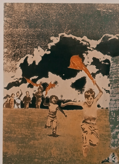
Imagen 2. Capítulo "la Figuración política." (1975) Enciclopedia Salvat de Arte Colombiano.

El arte del siglo XX es eminentemente laico. Desde fines del siglo pasado ha sido una larga investigación for-