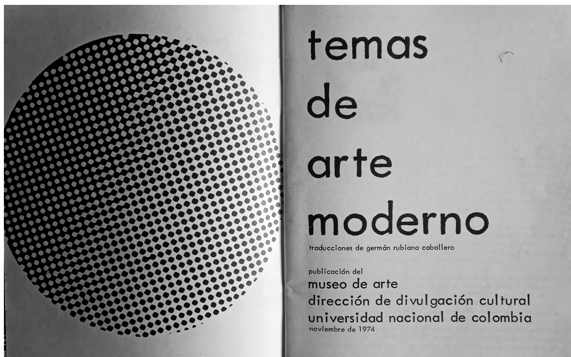
Imagen 3. Página interior del catálogo Temas de Arte Moderno (1974). Museo de Arte de la Universidad Nacional.