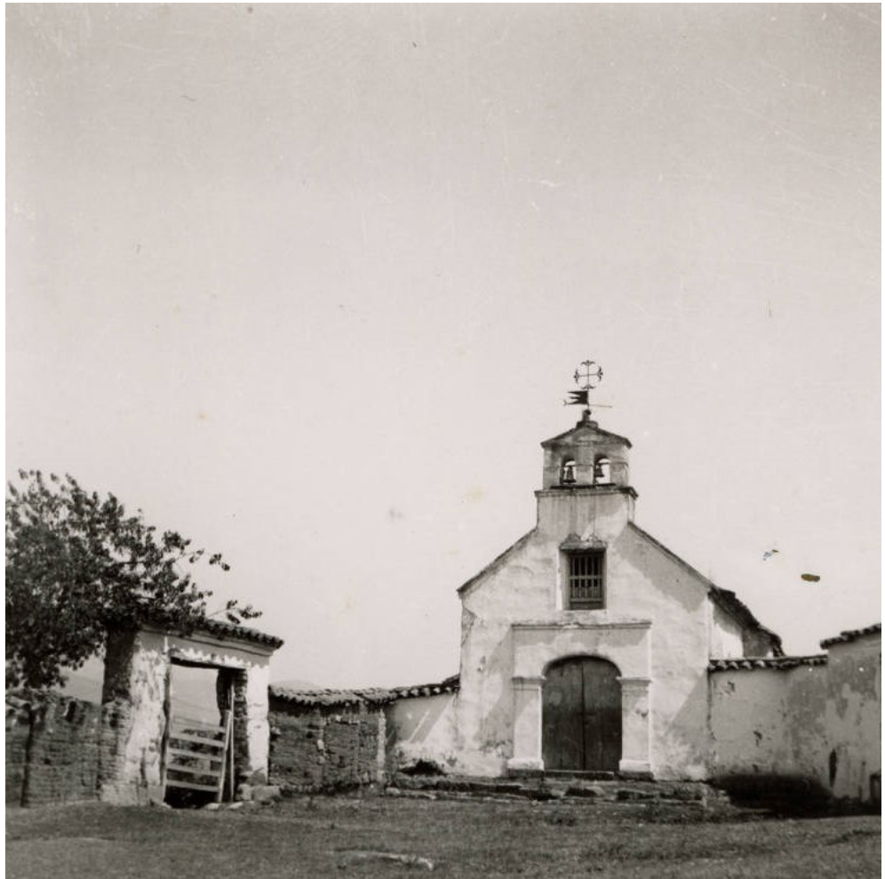
Imagen 6. Capilla de Santa Bárbara en Tabio. Fachada principal. Fotografía de Luis Villaveces Santamaría (1941). Perteneciente al Repositorio digital de Patrimonio Documental y Bibliográfico de la Universidad de Los Andes (Colombia).

histórica y del patrimonio, en municipios cercanos e instituciones de orden religioso.