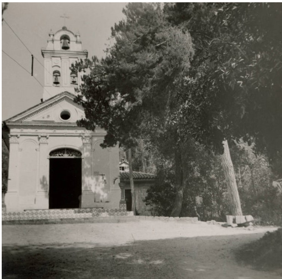
Imagen 7. Capilla del Señor de la Piedra de Sopó. Fachada principal. Fotografía de Luis Villaveces Santamaría (1941). Perteneciente al Repositorio digital de Patrimonio Documental y Bibliográfico de la Universidad de Los Andes (Colombia).

municipio de Tabio, y la antigua capilla de Nuestro Señor de la Piedra en el municipio de Sopó, las cuales coinciden con las características anteriores.