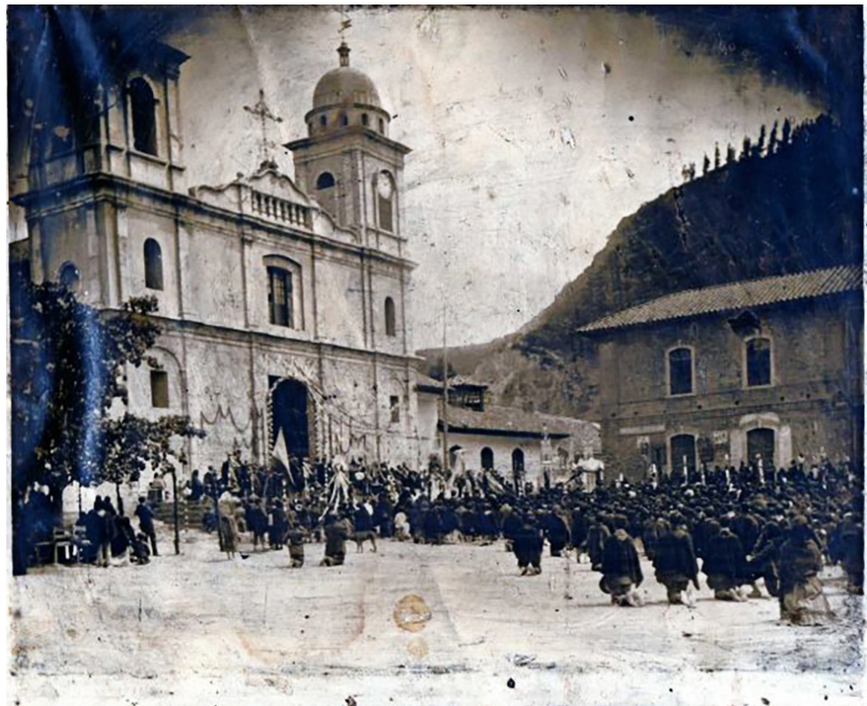
Imagen 4. Registro de las Fiestas a la Virgen María. Por algunos detalles de la edificación del costado izquierdo, puede ubicarse la fecha del registro en la década de 1910.

Si bien estas fotografías no nos permiten reconstruir la historia propia de la Virgen de Checua, cuentan con una profunda raíz memorialística y gran valor testimonial, pues van más allá del carácter puramente documental, siendo ventanas que nos permiten asomarnos a momentos, rostros y lugares del pasado, proporcionando una conexión tangible con la historia local. Estos registros, al igual que los relatos de los sabedores, han servido para llenar los vacíos de los documentos, pues nos dan un registro del contexto sociocultural y nos revelan los rostros de aquellas personas y familias que hacían parte de