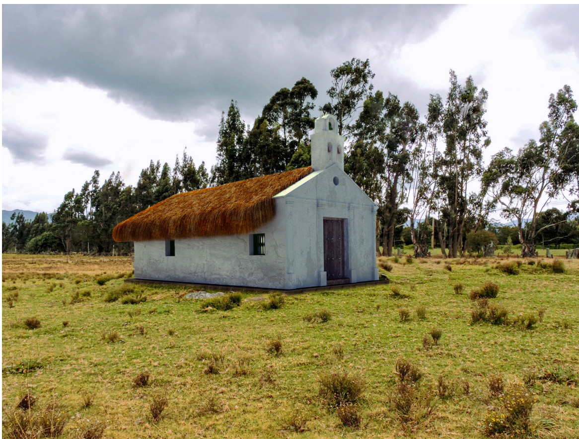
Imagen 8. Reconstrucción virtual de la Capilla de Checua. 2023.

en 1848 la veneración de la imagen y permitió que se le erigiera un altar. También ese año el arzobispo de Bogotá, Manuel José Mosquera, aprobó la Cofradía del Señor de la Caña. Estas dos decisiones contribuyeron al fortalecimiento del culto y a la propagación de la tradición entre fieles de otras regiones colombianas.