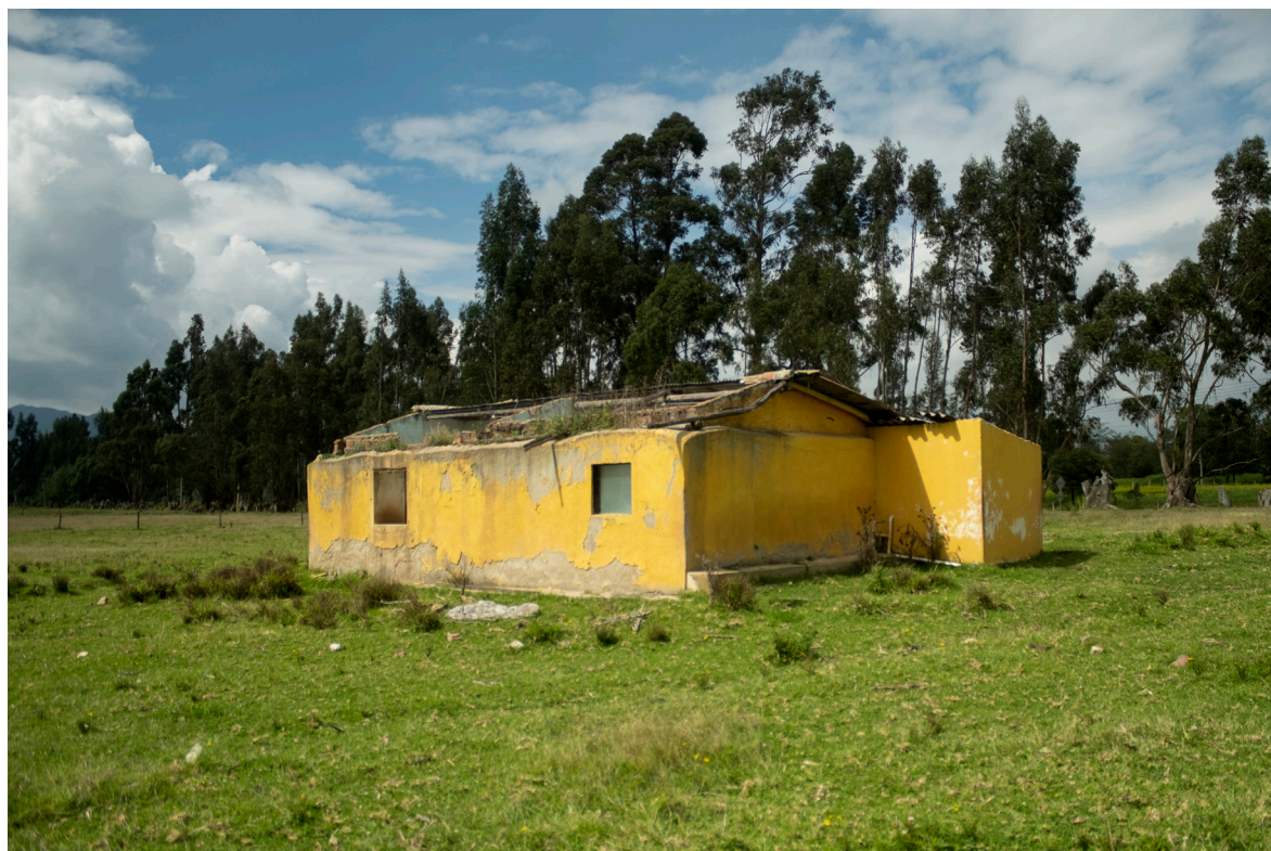
Imagen 3. Posibles ruinas de la Capilla de Checua, acondicionadas como casa unifamiliar a mitad del siglo XX.

resultado sacar a la luz una parte de la historia del municipio desconocida o mal interpretada hasta el momento.