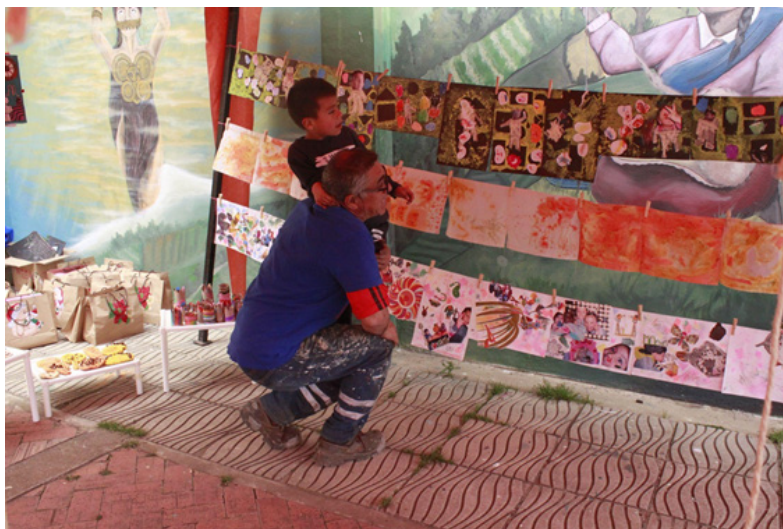
Imagen 3. Caracoles (5 años) y su abuelo viendo la exposición.

de jugar y movilizar otras estructuras en las que estamos inmersos.