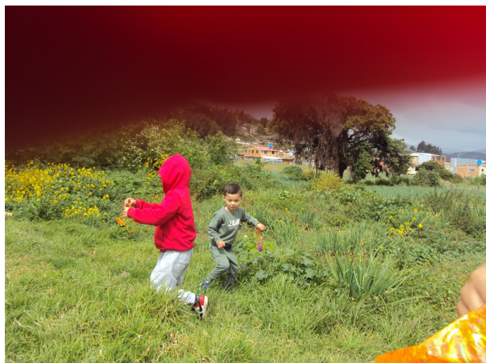
Imagen 9. Fantasma de papel y Sonic Rojo jugando en el cultivo afuera del jardín.