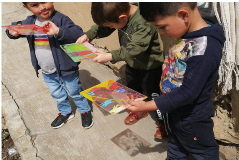
Imagen 5. No le temo a las lombrices, Corro como Sonic y Pijama de huellitas con sus imaginografías sobre el paisaje.

solitarios (contrario a los dibujos hechos por la Madre Comunitaria: una manzana, una oveja, etc.) sino que siempre estaban acompañados por un paisaje/comunidad constituida por nubes, arcoíris, ríos, montañas, personas, trazos espontáneos, manchas y texturas de colores.