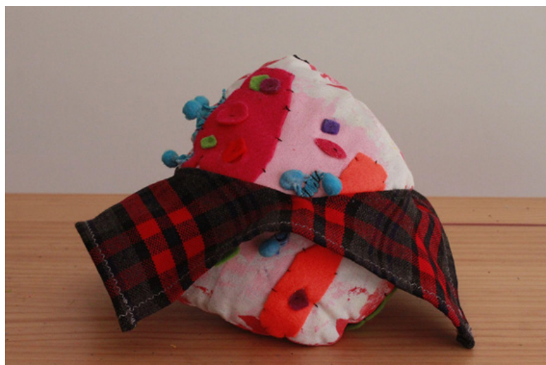
Imagen 4. Semilla nativa con ruana. Imaginografía hecha por Vestida de princesa (4 años).

una coherencia estética con la materialidad del territorio y el bricolaje propio del contexto rural. El espacio de exposición buscaba que los rincones propuestos no fueran espacios totalmente diferenciados, sino que los participantes pudieran pasar de un lado a otro y cruzar lecturas saltando por momentos diversos del proceso de las niñas y niños. De igual manera algunas imaginografías podrían pertenecer a un espacio o a otro por lo que la lectura era cruzada. El espacio fue organizado de manera que invitara a las niñas y niños a la narración a través del juego y la creación, lenguajes que habían usado durante el proceso de investigación y de esta manera la conversación se diera de manera más espontánea.