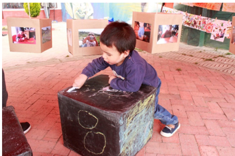
Imagen 2. Mueve Sillas (2 años) interviniendo dispositivos de dibujo en la exposición.

La exposición que construimos con las niñas y niños tuvo un espíritu crítico y reflexivo en cuanto a los ejercicios de poder y la tradición colonial y extractivista. La curaduría partió de las piezas que se construyeron en los talleres de creación que fueron realizados en el jardín, los cuales en principio estuvieron basados en los temas que trabajaba la Madre Comunitaria (familia, territorio, animales, cuerpo) y poco a poco a partir de la etnografía sensible fuimos abriendo la posibilidad de profundizar o abordar temas que interesaban a las niñas y niños.