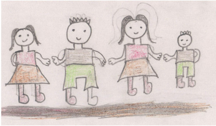
Figura 2. Dibujo de familia realizado por Cristiano.