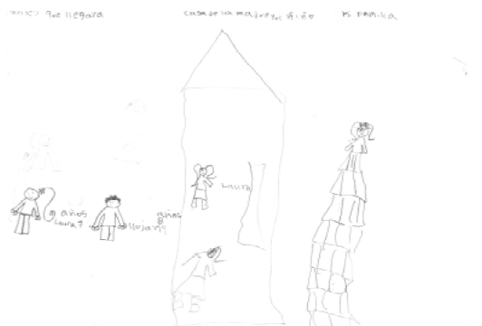
Figura 2. Dibujo realizado por “A” quien espera familia adoptiva.