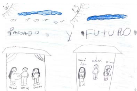
Figura 1. Dibujo realizado por “J” quien espera reintegro al núcleo familiar.

Durante su permanencia en la institución los niños se enfrentan por una parte a los ritmos institucionales de cuidado, que se distancian necesariamente de las experiencias familiares; y, por otra, a