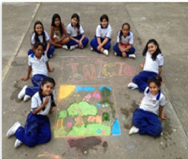
Figura 5. Pintura y narración de Leyendas Primaria.

Durante esta reconstrucción escrita, orientada por un formato, cada estudiante plasmó su comprensión e interpretación personal del texto. Algunos mostraron mayor destreza que otros para completar la guía. Algunos fácilmente dibujaron los tres momentos de la secuencia narrativa e incluyeron en sus composiciones su interpretación personal. Los estudiantes concluyeron que existe un constante entrecruzamiento entre el mito y la leyenda, donde se pueden encontrar explicaciones de carácter etiológico; es decir, que intentan explicar las costumbres y los ritos de una sociedad. Finalmente, hubo un momento en el cual los estudiantes socializaron sus composiciones por grupos y escogieron bajo sus propios criterios de selección las mejores. Para terminar la actividad, los estudiantes imaginaron y plasmaron en un formato la interpretación personal de la leyenda el Yurupary, o la imagen que más les llamó la atención, para ser plasmada en tiza sobre el asfalto. El siguiente es un ejemplo de la creación artística del grado tercero: