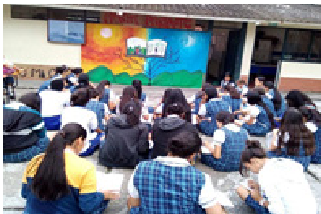
Figura 9. Narración del mural parlante por estudiantes del grado séptimo.