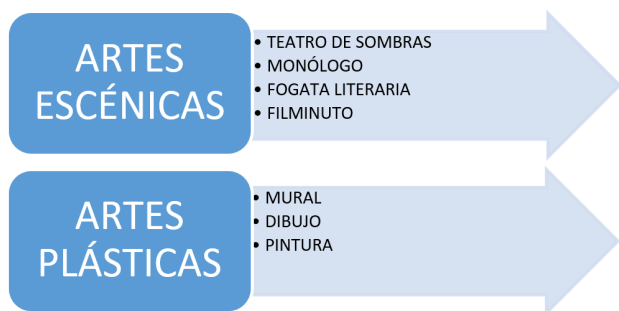
Figura 1. Manifestaciones artísticas.

establecimiento educativo, en el marco de su proyecto educativo institucional a fin de fortalecer la comprensión lectora en los estudiantes del grado tercero y séptimo.