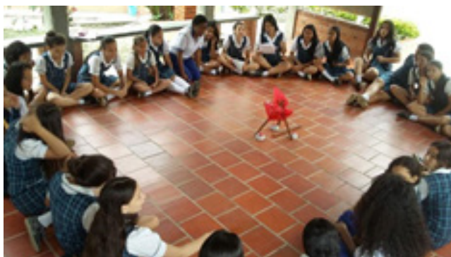
Figura 7. Fogata literaria grado séptimo.

corresponde a la fogata literaria desarrollada por el grado séptimo: