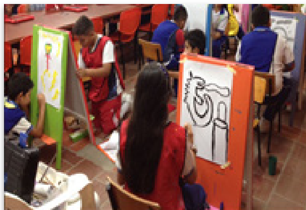
Figura 8. Elaboración de las imágenes del mural parlante por estudiantes del grado tercero.

El desarrollo de esta actividad fue bastante fructífero para cada uno de los estudiantes, pues en el momento de la creación de su propia historia, teniendo como base el mural hablando, algunos de ellos ya tenían en sus mentes qué cuento inventar. Para, de esta manera, expresar el mensaje que le podía transmitir el mural parlante mediante la creación de su propia historia. Finalmente, todos participaron activamente, expresando sus intereses y emociones con respecto a la imagen realizada.