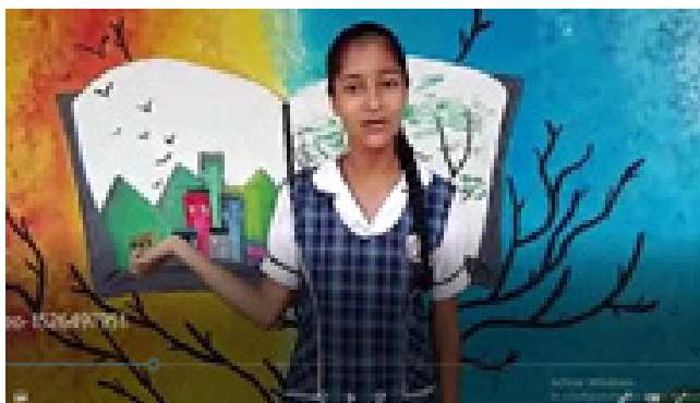
Figura 10. Imagen correspondiente a un filminuto desarrollado por el grado séptimo.