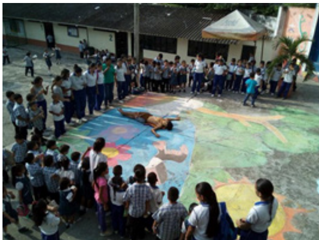
Figura 4. Escenificación y socialización de “Leyendas Bachillerato”.

Ziliani-Cárcamo (1994), los cuales describen a un lector que aprende información explícita y desarrolla destrezas de significación en palabras, oraciones y párrafos. La influencia de las artes en el ejercicio de comprensión hace posible que el contacto con el texto sea más cercano, placentero y comprometido; ya que la manipulación de material para crear productos artísticos de la propia autoría dispone a todos los sentidos. Además de representar actividades en las que los estudiantes ponen todo su empeño, primero, para comprender el texto y, segundo, para representar de la mejor forma esta comprensión que construyen con ahínco. Es posible confrontar la experiencia con autores como Cassirer (1973), quien asegura que el hombre es por naturaleza un animal simbólico, el cual se ha envuelto en formas lingüísticas, imágenes artísticas y símbolos míticos; esto facilita que la mente humana recree el mundo a través de su propio código simbólico. Así mismo, Chomsky (1995) hace referencia a la utilidad de las artes en la mejora de la comprensión lingüística; de acuerdo con el autor, es necesario entender, aceptar y poner en práctica el hecho de que las artes naturalmente son capaces de potenciar a la mente, predisponerla para el lenguaje y prepararla para la comprensión. El siguiente es un ejemplo de cómo a través del dibujo, la pintura y el teatro, los estudiantes llegaron a realizar obras artísticas de gran impacto: