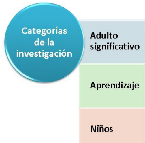
Figura 1. Procedimiento de investigación.

Antes de evidenciar la revisión de la literatura concerniente a los conceptos inherentes del estudio base para la redacción de este artículo, se presentan aquí las categorías que dieron vida a la investigación. Conceptos que hicieron de “brújula” para encauzar el estudio, ver figura 1.