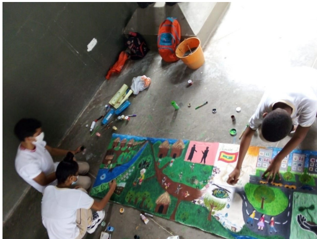
Figura 1. Reconstrucción creativa de relatos de vida sobre el desplazamiento forzado.

La implementación de la estrategia pedagógica para la reconstrucción y la recuperación de la memoria, al ser pensada no solamente en aportar metodológicamente a un proceso de enseñanza-aprendizaje, sino que por medio de ella se puede generar cambios y transformaciones en la realidad socioeducativa sirvió como sustento para conocer la presencia de la realidad conflictiva, y que guarda estrecha relación con el pasado y el origen de las familias de los estudiantes que hacen parte del grupo.