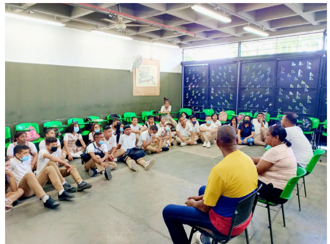
Figura 2. Círculos de narraciones testimoniales de historias de vida en el conflicto armado.

Se confirma un impacto positivo en cada una de las fases de la estrategia didáctica. Desde el momento en que se comienza a implementar, los estudiantes participantes tienen una disposición para realizar actividades que lo implican a él y a la vez implica a los otros, y a su realidad. Se parte de la confrontación y el diálogo de esa realidad conflictiva para proponer, de manera creativa, una