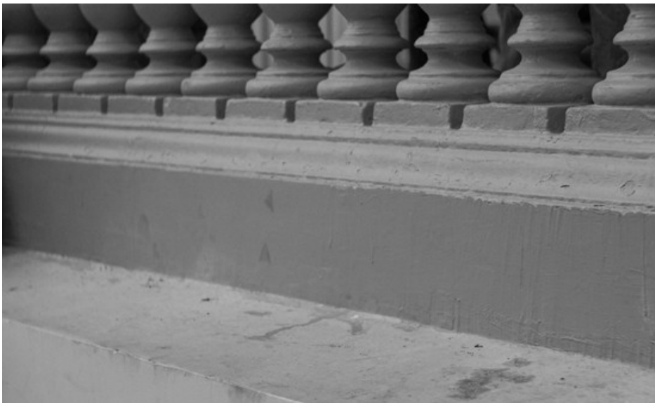
Figura 4. Devenir 3