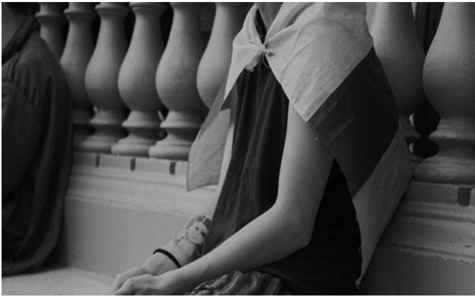
Figura 3. Devenir 2