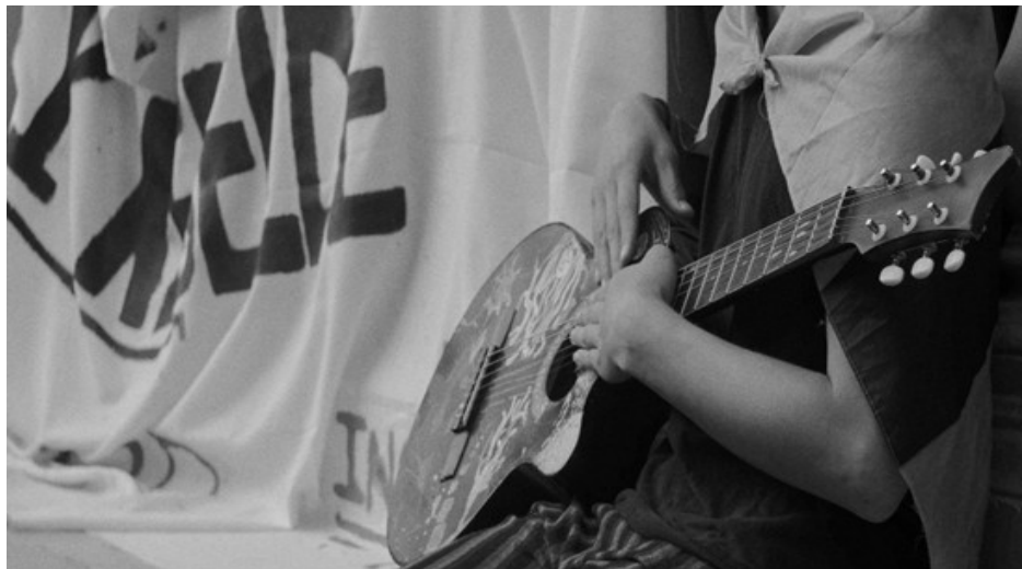
Figura 2. Devenir 1