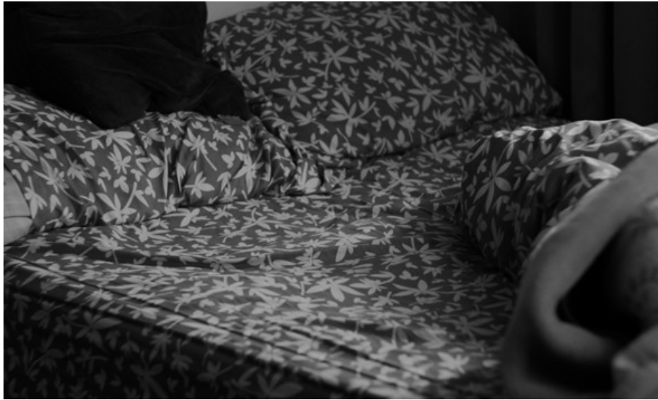
Figura 5. Huellas