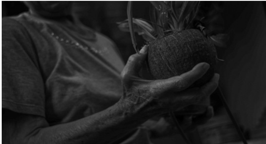
Figura 1. Orquídeas

Es allí, en la búsqueda del devenir propio, donde solo quedarán las voces de aquellos que ya no están, siempre presentes y combatientes.