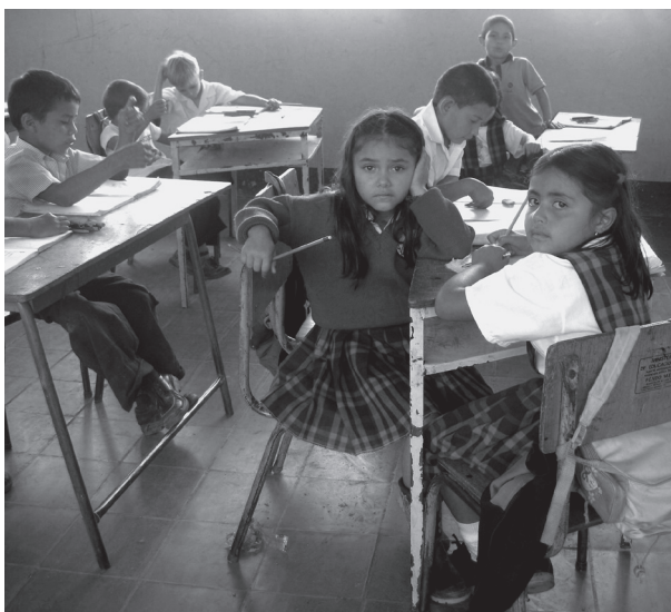
Niños Escuela Rural San Jacinto de Chapa. Proyecto Almas, rostros y paisajes. 2008

La escuela forma parte del universo infantil. Ya sea por concurrir a ella o por estar excluido de ella, es un elemento fundamental de la vida cotidiana por presencia o por ausencia. Los informantes con los que trabajamos y las preocupaciones que, con ellos, abordamos exigían su escolarización para