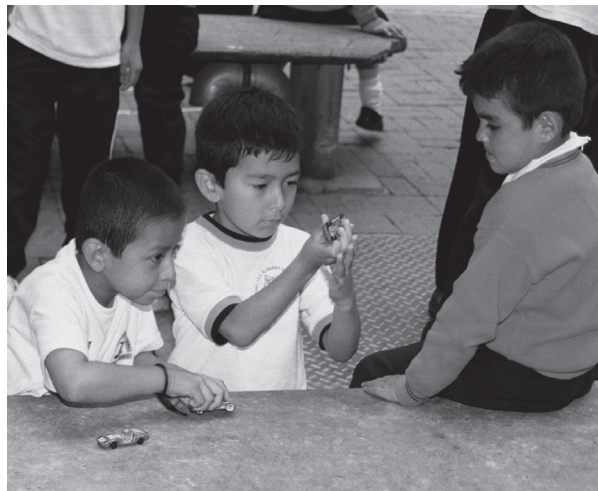
Juguetes en recreo. Hernán Garcés. 2010

Notamos, finalmente, un desplazamiento de los juguetes tradicionales, en una serie que comienza en los informantes de más o menos treinta años pasando por testimonios de informantes que fueron niños en los noventa y llegando a la actualidad. Este desplazamiento tiene un denominador común: los saltos tecnológicos, la miniaturización de la tecnología y el acceso de una parte de la población en estudio a ellos configuran las “nuevas pantallas” como espacios significativos de juego en la cotidianidad infantil. Ya no importa si los niños acceden, efectivamente, a una computadora o a una consola de juegos. El deseo de tenerlos o la ida a casas de amigos que los poseen constituye un escenario nuevo en lo que concierne a los juguetes entendidos como auxiliares de juego. Cuando decimos desplazamiento no estamos marcando la desaparición de los juguetes “tradicionales” del horizonte de la niñez, sino su desplazamiento en los testimonios a favor de los dispositivos tecnológicos que ocupan, cada vez más, un espacio importante en