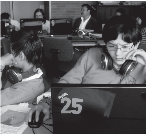
Imagen proyecto con la radio también se aprende. 2010

propuestas de la página que son, a la vez, las del canal. Junto con la venta de artículos de todo tipo comercializados bajo la marca del canal o de los programas que, en su conjunto, conforman segmentos completos de programación, se estructura el proceso que sí encontramos como diferente en relación al pasado reciente: los canales de televisión se constituyen como instituciones anclados en diferentes dispositivos tecnológicos y mediáticos en los que se apoyan para intentar fidelizar a la audiencia.