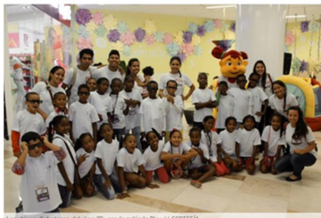
Imagen 1. Visita a las salas de CINELAND Cartagena. Por primera vez los niños de cinecitos asisten a una sala de cine