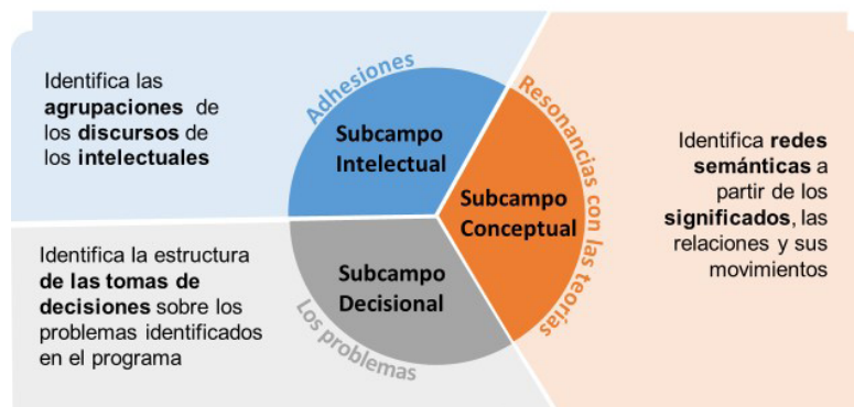
Figura 2: Esquema de la estrategia metodológica para abordar los campos: formación de profesores, currículo y didáctica de las matemáticas.